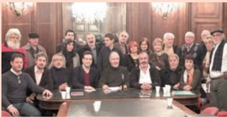
Horacio Rodríguez Larreta.

El lunes 7 de julio, en una conferencia de prensa en la Legislatura, miembros de 13 Juntas Comunales y legisladores de varios bloques expresaron su rechazo al flamante Decreto 251 de Mauricio Macri y