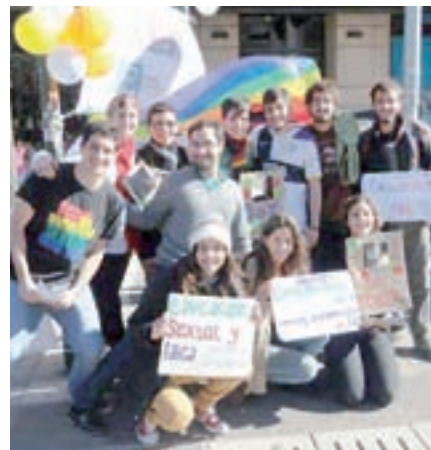
El 28 de junio, Día del Orgullo, en Paraná.

Los socialistas respetamos la libertad de cultos, aunque no los compartimos. A lo que nos oponemos es a seguir bancando con plata de todos a una institución retrógrada que pretende imponerle sus prejuicios a toda la sociedad y es enemiga de los derechos de las