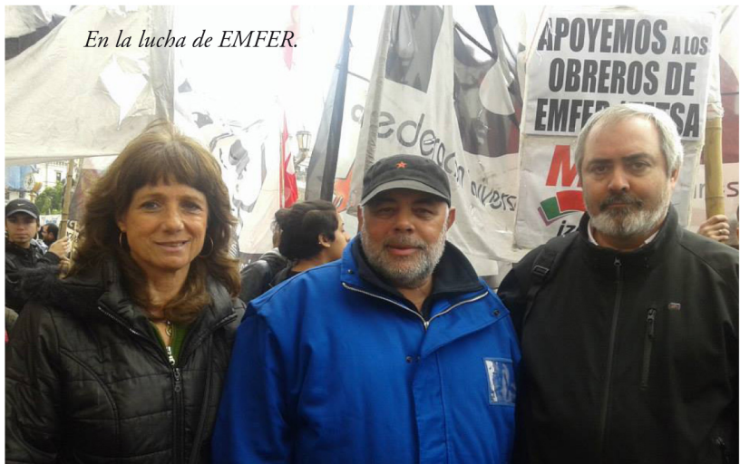
En la lucha de EMFER.

JUEVES 24 JULIO 16.30 hs CONCENTRARSE 9 de Julio y Av. de Mayo Marcha a Plaza de Mayo Convoca: Encuentro Memoria, Verdad y Justicia No a la criminalización de la protesta Ni ajuste ni represión