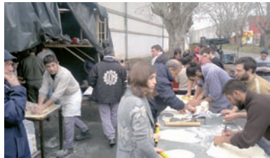
Amasando en la cocina de ENFER.

Pero los delegados no están solos, hay un activismo numeroso, muy fuerte y muy combativo, que todo el tiempo acompañó a los delegados y que no se despega de la base. Los compañeros que garanti-