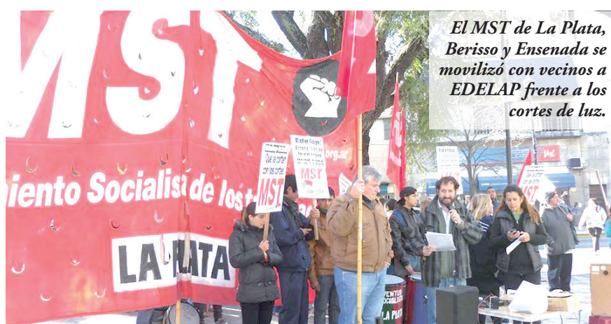
El MST de La Plata, Berisso y Ensenada se movilizó con vecinos a EDELAP frente a los cortes de luz.

Al finalizar la cordial reunión, todos coincidieron en lo positivo del encuentro, y en avanzar en la campaña electoral para aprovechar la oportunidad que tiene el frente Alternativa Popular, para llegar a la Legislatura y los Concejos Deliberantes tucumanos.