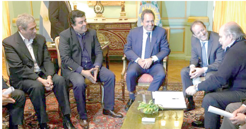
Gobernador Scioli y Ministro Granados con intendentes

Su misión es "la prevención, con características de policía de proximidad" (art. 7). Y sus funciones, "la