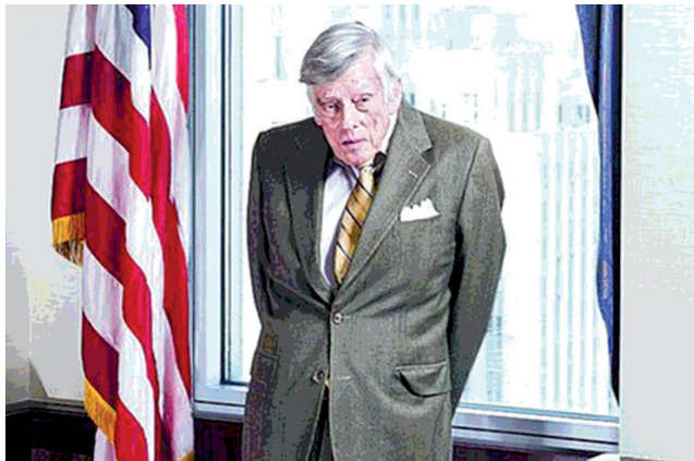
Griesa, el juez de los buitres

El juez Griesa, el mejor amigo de los especuladores, arrancó la semana negando el pedido del gobierno argentino para restituir el Stay (recurso de amparo que permite negociar sin cumplir el fallo). A pesar de los esfuerzos denodados del kirchnerismo por pagar, los buitres ya olieron el banquete y quieren venir por todo, incluso los activos de YPF.