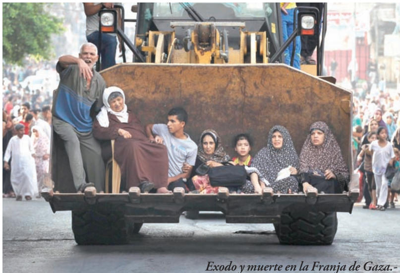
Exodo y muerte en la Franja de Gaza.

Los nombres militares que detalla el ejército sionista son variados, pero el nombre común es uno solo: genocidio planificado. Eso y no otra cosa es lo que ocurre. No es una guerra ni hay dos bandos iguales. Las imágenes que muestran la destrucción de Gaza recuerdan a Guernica bombardeada, o a Varsovia atacada en la segunda guerra mundial destruida por la Alemania nazi. El estado de Israel, inventado e impuesto a sangre y fuego en 1948, con uno de los ejércitos más poderosos financiado por EEUU, realiza sistemáticos ataques de limpieza étnica contra la población civil. Es el accionar de un régimen de características nazi-fascistas que se niega a perder el control de la zona, que es su razón de ser como avanzada imperialista en medio