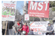
En La Plata.