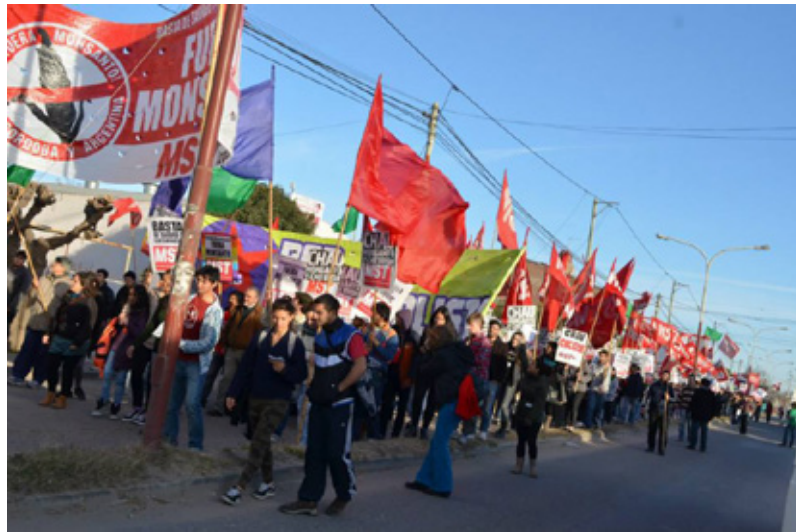
El rol de la FAO, la Vía Campesina y el Evita en Argentina

En resumen: esta legislación está diseñada para terminar de garantizar el control hegemónico por parte de Monsanto –y otras corporaciones- del mercado de semillas y todo el paquete biotecnológico –glifosato incluido- para la producción de alimentos en el país. Quien controla qué se planta controla qué se come, cuánto cuesta y de qué naturaleza es.