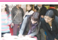
En la Ciudad Autónoma de Bs As