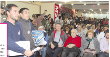
Obreros de LEAR participaron del acto y recaudaron dinero para su fondo de lucha.