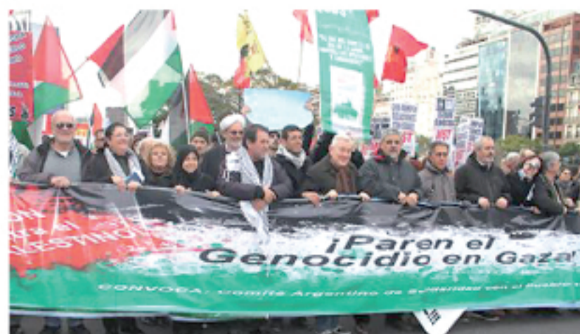
25 de julio, marcha unitaria a la cancillería y a la embajada de Israel.