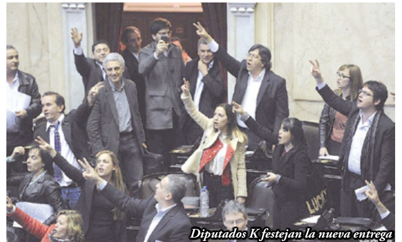
Diputados K festejan la nueva entrega

Con una oposición tan de derecha y sumisa al imperialismo, no es difícil imaginar por qué el gobierno de Cristina se ilusiona, con la re-reelección de