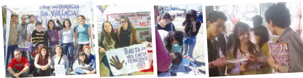
La campaña de Juntas en Neuquén, la UBA (CBC Puán), Quilmes (feria de Bernal) y Santiago del Estero.