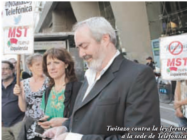
Twitazo contra la ley frente a la sede de Telefónica

logístico y de infraestructura a las multinacionales telefónicas que irán a explotar el servicio de cable, pese a su negro prontuario en materia de desinversión y decadencia en los servicios de telefonía cuya explotación comercial privada mantienen desde la década menemista