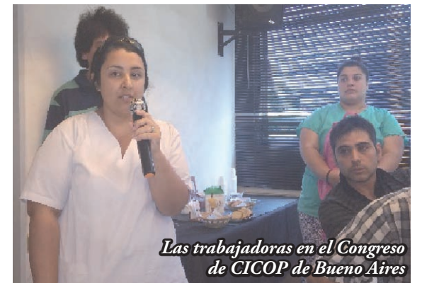
Las trabajadoras en el Congreso de CICOP de Buenos Aires

En esta nueva etapa los trabajadores profundizaron la necesidad de extender su conflicto y el fondo de lucha para mantener las posibilidades de pelea. Las recorridas por el Hospital Posadas y la posterior presencia en el corte en Haedo es un ejemplo de solidaridad