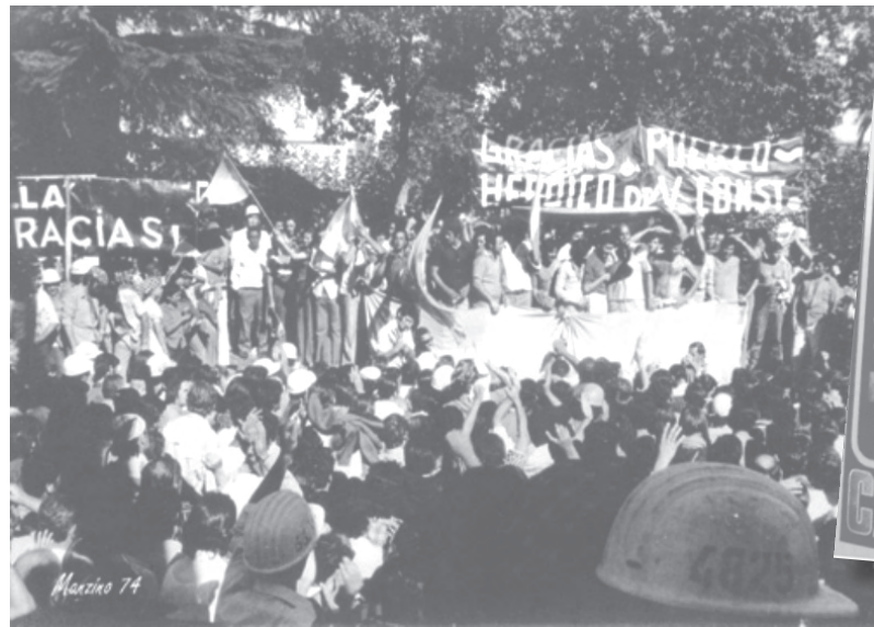
Masivo apoyo popular a los trabajadores

Mientras los trabajadores ocupábamos las fábricas éstas estaban acordonadas por los policías y nadie podía entrar. La triple A amedrentaba a los familiares, entraban en los domicilios de los compañeros a saquearlos, y el odio popular crecía y nos reclamaba a los obreros para que nos uniéramos venciendo el cerco represivo. Fue así que las