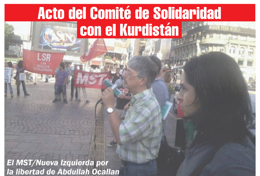
El MST/Nueva Izquierda por la libertad de Abdullah Ocalan

1- La economía de Ucrania sufrió un fuerte retroceso luego de la caída de la ex URSS. El país fue gobernado por el gobierno pro ruso hasta su derrota en el 2004 a manos de la “revolución naranja”. Los líderes de este levantamiento encabezados por Yulia Tymoshenko, con su giro pro europeo no hicieron sino agravar las penurias del pueblo de ese país, que en el 2009, vio reducir su PBI un 14 %. El pro ruso Yanukovich tomó el poder luego de las elecciones del 2010 para seguir profundizando la crisis de Ucrania y el enriquecimiento de la oligarquía del país.