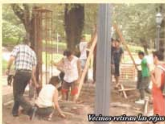
Vecinos retiran las rejas