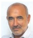
Raúl Gómez, Candidato a gobernador

Nadie duda de que 300 milímetros caídos en 15 horas sea demasiada lluvia. Pero cuando se combinan con la negligencia de los funcionarios a cargo, un brutal ataque a la naturaleza y la total ausencia de previsión, el resultado es fatal.