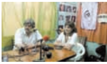
Radio en Moreno.