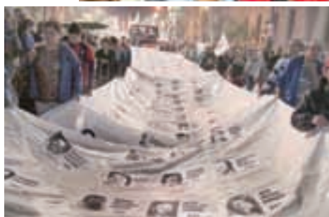
Compañeros asesinados del PST ¡presentes!