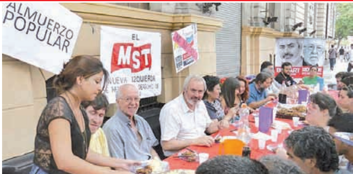
Contra la cena millonaria de Macri, almuerzo popular frente a la Jefatura de Gobierno.