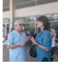
Hospital de Moreno.