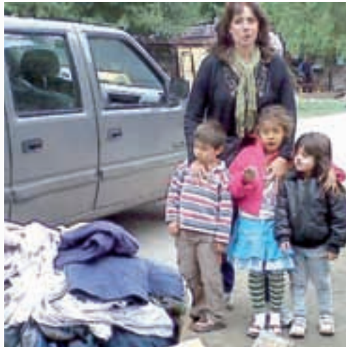
Ayuda para los inundados.