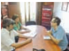
Periódico El Civismo de Luján.