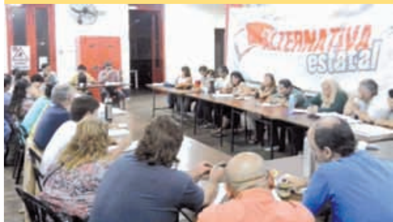
Referentes de nuestra agrupación nacional analizaron los conflictos y la próximas elecciones de ATE.