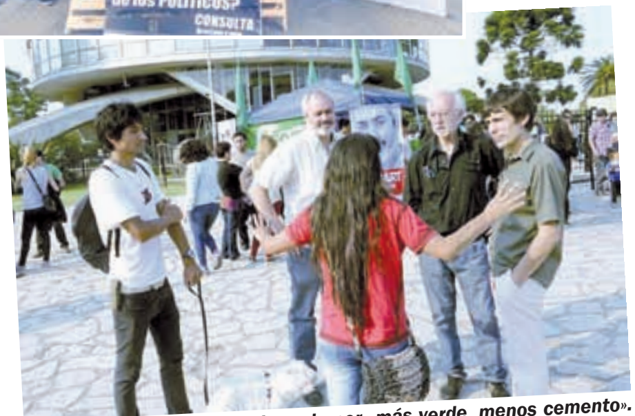
Frente al Planetario, jornada por «más verde, menos cemento».

100 mesas de consulta a los vecinos, contra los privilegios.