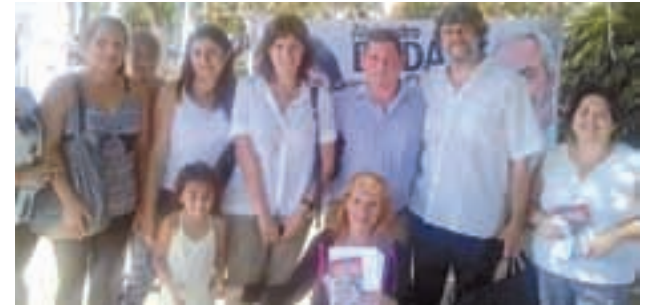
Con vecinos en José C. Paz.