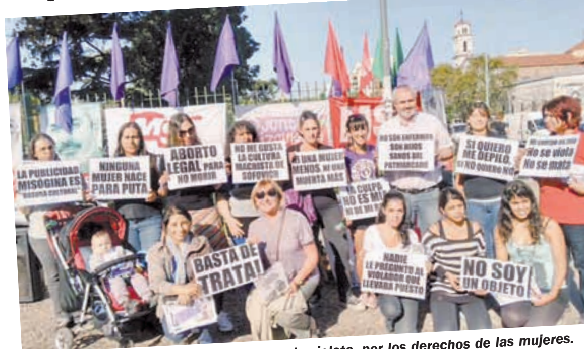
En Parque Centenario, jornada violeta, por los derechos de las mujeres.