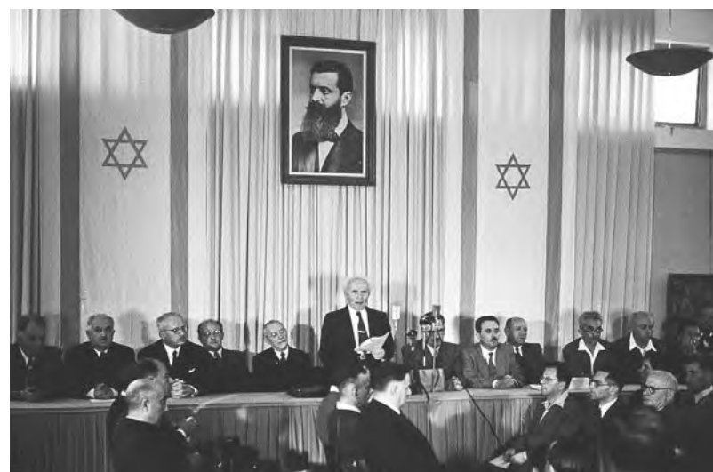
Ben Gurión proclama el nacimiento del Estado de Israel

Este gabinete a tenido "roces" con la política de Obama de negociación con Irán, en un momento en que el imperialismo necesita nuevos acuerdos ante su creciente debilidad en el conflic-