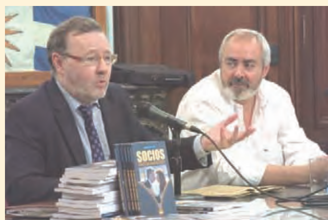
Se presentó el libro "Socios. Todos los pactos PRO-K"

niños y el castigo a los responsables. Hay que separar del cargo a los funcionarios implicados y romper la cadena mafiosa, investigando a las grandes marcas sin talleres propios y a los organismos que convalidan dichas estructuras ilegales. De lo contrario, estamos destinados a que se sigan repitiendo hechos como este."