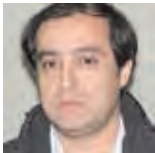
Daniel Mercado Delegado General Banco Nación

Desde el año pasado con más de 10 paros generales los trabajadores bancarios venimos luchando en contra del impuesto a las ganancias que erosiona el poder adquisitivo de los salarios. Este año comenzamos la lucha en unidad con el paro de los gremios del transporte del 31/3 que paralizó el país reclamando contra el injusto impuesto. Y empezamos la negociación salarial reclamando un aumento mayor al 30% para recuperar el salario perdido por la inflación del año pasa-