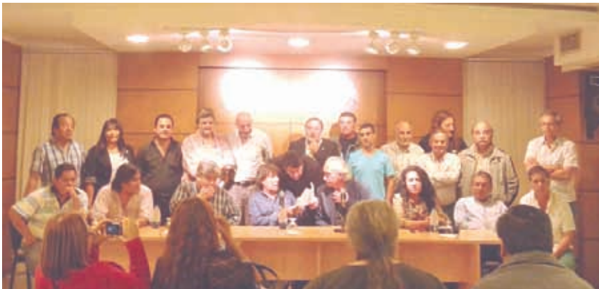
La CTA autónoma convoca a marchar el 8 y a parar el 9

Naturalmente, no podemos desconocer que aunque sobran motivos para una medida nacional –de hecho llega bastante tarde– y los reclamos son justos, Moyano, Barrionuevo y otros dirigentes convocantes también se están realineando al compás de los vaivenes políticos que se vienen dando en el país y tendrán expresión en las elecciones presidenciales. Por eso este paro llega de un modo similar al anterior del 31 de marzo, convocado desde arriba, sin debate entre las bases de cada lugar de trabajo. Desde las CGTs ratificaron que quieren un paro pasivo, sin movilización. Tampoco viene acompañado de propuestas de continuidad, más allá de frases de ocasión de algún dirigente. En ese contexto, ha sido correcta la decisión tomada por la CTA