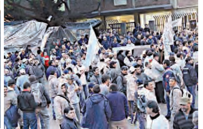
Asamblea de aceiteros en Rosario.

no llegamos a ningún lado. Lo que en verdad necesitamos los trabajadores es un verdadero plan de lucha que con estos dirigentes burocráticos es imposible, por eso nues-