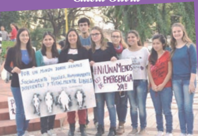
San Justo (Santa Fe)