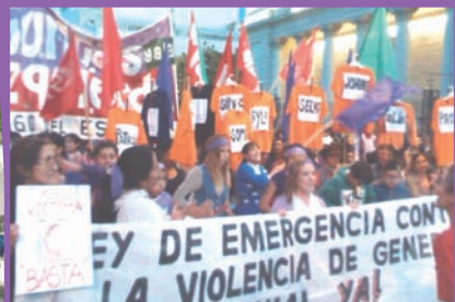
Santiago del estero