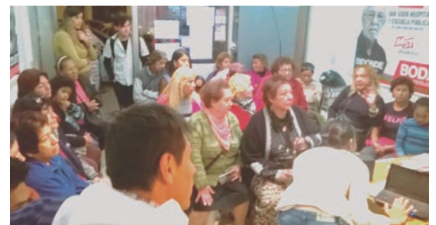
Ciudad de Buenos Aires: uno de los talleres sobre femicidio para preparar la marcha por Ni Una Menos.

Desde el MST y Juntas y a la Izquierda compartimos plenamente los 9 puntos de reclamo que se leyeron el 3J (ver en pág. 10) y que, palabras más, palabras menos, son los mismos que venimos planteando nosotrxs. Es más: coincidimos en que de las 5 propuestas originales se haya retirado una: la de crear tribunales especializados en violencia de género.