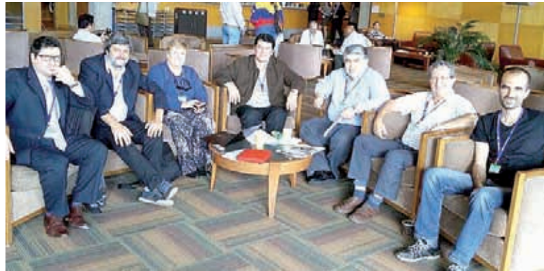
Delegación de la CTA (a) a la OIT.

funcionales a las necesidades de hacernos pagar la crisis internacional a los trabajadores y a los pueblos. Esos intereses defienden y para eso necesita desacreditar a quienes enfrentan consecuentemente esta política patronal y anti obrera. Por eso más allá de esta campaña de calumnias, nuestro compromiso es seguir peleando en todo el país y en todos los ámbitos internacionales a los que podamos asistir, por defender y ampliar los derechos de los trabajadores y la más irrestricta libertad sindical, así como por un nuevo modelo sindical democrático. Nadie va a desviarnos de ese objetivo ni a debilitarnos pese a las desigualdades de recursos que detentan el poder político, las corporaciones y la burocracia sindical asociada. Por el contrario con más fuerza que nunca seguiremos adelante denunciando lo que haga falta denunciar a favor de los intereses de la clase obrera y los sectores populares. En ese sentido, agradecemos las grandes muestras de solidaridad que hemos recibido estos días de CTA, FeSPROSA, CICOP, así como de otros amplios y diversos sectores del sindicalismo, el campo popular y la izquierda. En esa pelea, por supuesto que los trabajadores y la izquierda nos enfrentamos a empresarios y poderosas cor-