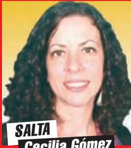
SALTA Cecilia Gómez DIPUTADA