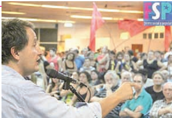
Escribe Carlos del Frade

Por primera vez en su historia, la Legislatura de la provincia de Santa Fe tendrá diputados de izquierda. Un hecho singular que es consecuencia de una construcción muy particular: el Frente Social y Popular. La mayor unidad de organizaciones políticas y sociales de izquierda que se ha dado en la Argentina, entonces, tuvo su fruto en el reconocimiento de más de 90 mil santafesinas y santafesinos.