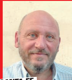
SANTA FE Cacho Parlante SENADOR