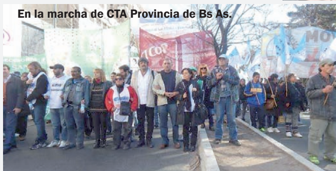
En la marcha de CTA Provincia de Bs As.