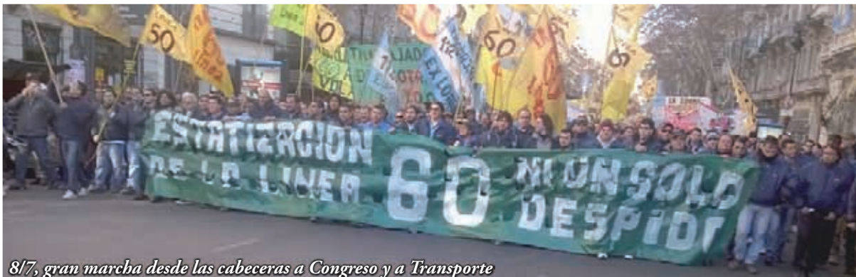
8/7, gran marcha desde las cabeceras a Congreso y a Transporte

A la medida de no cobrar boleto, DOTA respondió con el despido de 47 trabajadores primero, y de 5 más días después. El Ministerio de Trabajo, que había dictado una conciliación obligatoria ante el despido de Benítez, no volvió a intervenir. La policía bonaerense de Scioli estuvo bloqueando la cabecera de Maschwitz para que no salgan unidades, por disposición del fiscal Flores, de la Fiscalía de Escobar. El Ministerio de Transporte no dijo nada, a pesar de que una gran marcha de trabajadores llegó hasta su puerta el pasado 8/7.