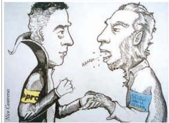
Ni Drácula ni el Hombre Lobo.

Como sucesor de un espacio que se autodefine como nacional y popular, Cristina impuso a un