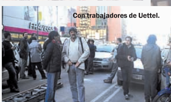
Con trabajadores de Uettel.