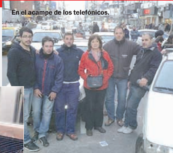
En el acampe de los telefónicos.