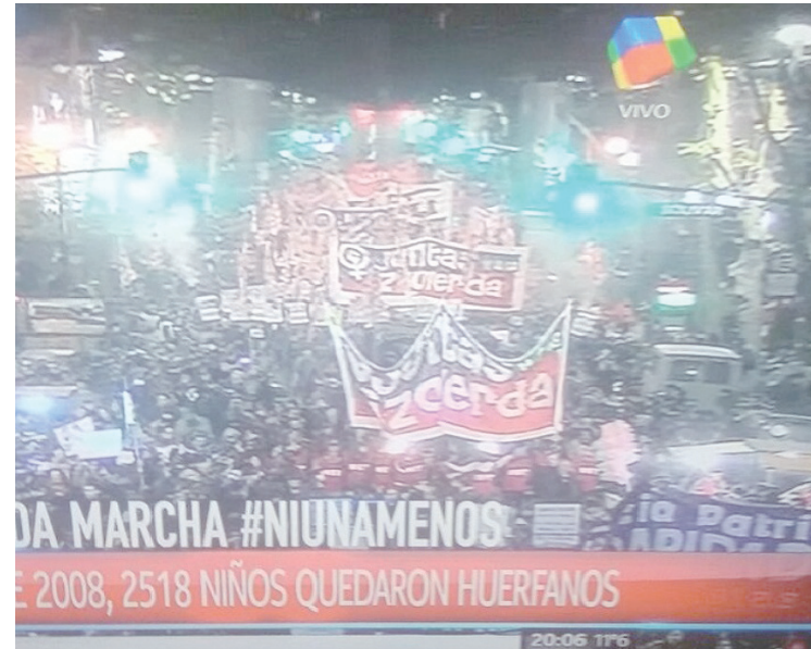
Así mostró el canal América el ingreso de la columna de Juntas y a la Izquierda y el MST a Plaza de Mayo.

Asimismo, en los espacios de mujeres de izquierda y progresistas resultó escandaloso el tuit de Jorge Altamira: “La trata de mujeres no es machismo, es la explotación capitalista organizada de mujeres y niñas/os”.