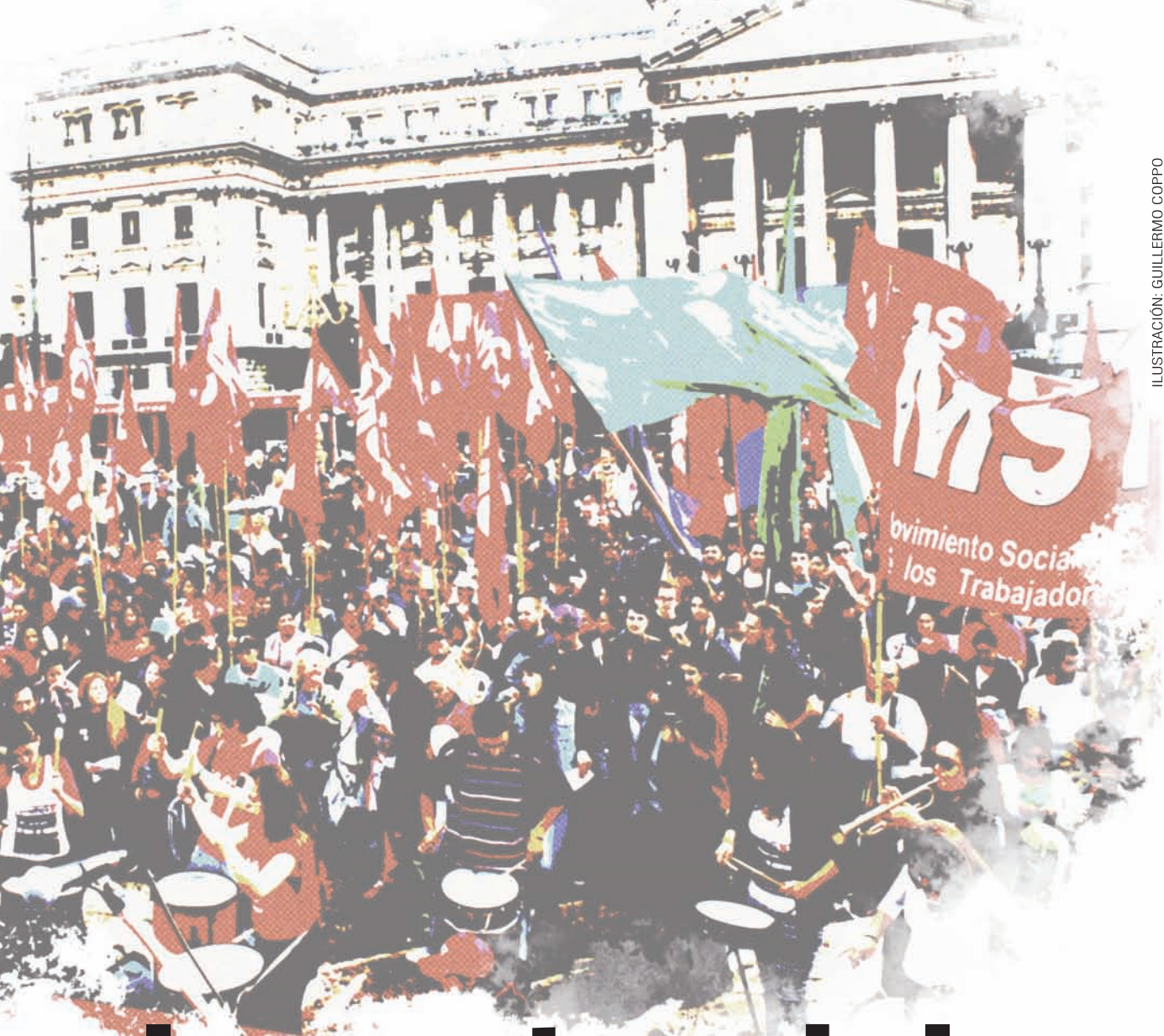
ILUSTRACIÓN: GUILLERMO COPPO

EN EL BICENTENARIO: SEGUNDA INDEPENDENCIA O MACRI