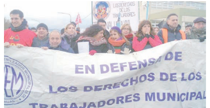
Cabecera de la marcha a los Tribunales de Ushuaia.

Hicimos una denuncia formal de la violación a los derechos humanos y pedimos una mesa de diálogo sin condicionamientos. Porque las partes deben sentarse y nos ofrecimos de mediadores. Pero a partir de denunciar el carácter represivo del gobierno y rechazar el pedido de exoneración contra 17 docentes y dirigentes del SUTEF. La falta de respuestas y la continuidad del conflicto exigen reforzar el apoyo para ir al triunfo de esta extensa y firme lucha.