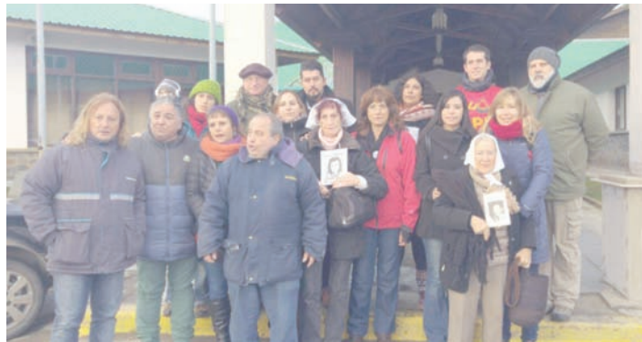
Nuestra delegación solidaria a Tierra del Fuego.

La actividad fue intensa. Tanta era la fuerza y combatividad que ni sentía el gélido clima austral. Te emociona ver a compañeras y trabajadores de tantos gremios con los que fui haciendo contacto y estrechando lazos. Están firmes en su lucha, pese los más de 100 días de protesta. Los intentos por desgastarlos no calan en la base, pese a que gremios como ATE o Sanidad hayan levantado.