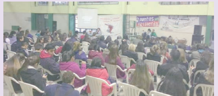
Concordia. Organizaron AGMER local (docentes), Colectivo de Géneros y Agrup. Fuentealba del Profesorado de Ciencias Sociales, junto al MST.

Del 8 al 10 de octubre se hará en Rosario un nuevo Encuentro de Mujeres, un espacio en donde cada año miles de mujeres de todo el país nos reunimos para debatir y avanzar en nuestras demandas.