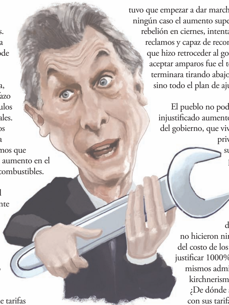
ILUSTRACIÓN: GUILLERMO COPPO

Desde el MST-Nueva Izquierda venimos exigiendo la eliminación total del IVA a todos los productos de consumo popular y masivo, no sólo para los jubilados y planes sociales sino para todos los trabajadores. Y que el costo fiscal, que tanto preocupa al FPV, salga de impuestos progresivos a las grandes ganancias y fortunas de los capitalistas y oligarcas que son los que generaron la crisis que hoy padecemos los trabajadores y el pueblo.