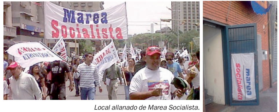
Local allanado de Marea Socialista.

lleva adelante el gobierno. Y luchando para reconstruir el proyecto nacional demolido por tres años de ineficiencia, soberbia y cinismo.