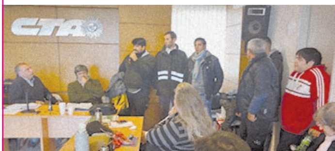
Difundiendo el conflicto, en el Congreso de CICOP.

Para parar este ataque global a los ferroviarios tercerizados, es necesario romper con la espera, volver a organizar a los compañeros y prepararnos para salir a luchar nuevamente, y ahora que los ferroviarios de convenio salen a luchar les damos nuestro apoyo y necesitamos unificar los reclamos y que todos los compañeros despididos vuelvan a trabajar.