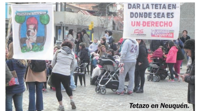
Tetazo en Neuquén.

A este sistema capitalista y patriarcal la única teta que le molesta, y por ende la censura y la reprime, es la