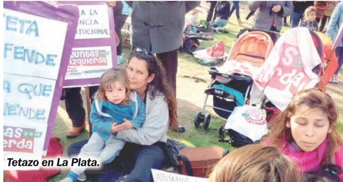
Tetazo en La Plata.

El sábado 23, "Tetazo" en las principales plazas del país. Con San Isidro como centro, miles de mujeres -junto a nuestros hijos, amigas, compañeros, familiares y vecinos- tomamos las plazas para amamantar juntas en protesta contra la violencia policial y por nuestros derechos.