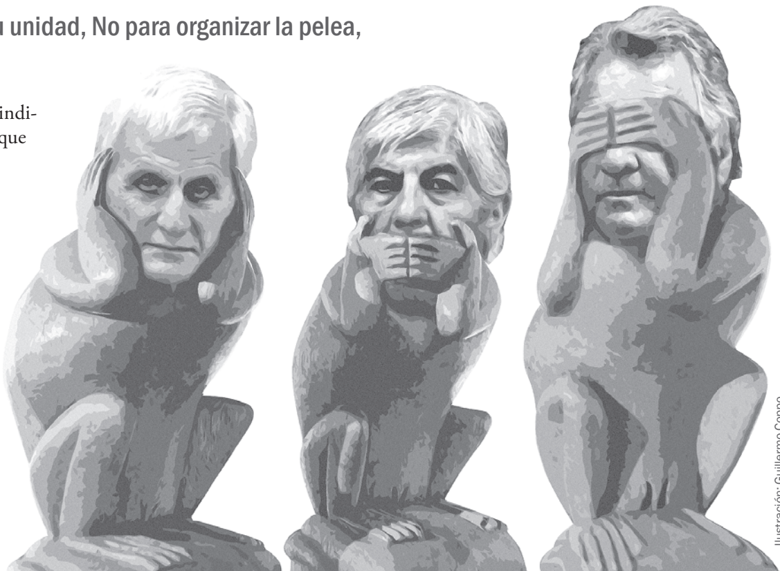
Ilustración: Guillermo Coppo

No los une el amor, porque reflejan los intereses de diferentes sectores patronales, que pujan por sus propias necesidades. Los une el espanto a la base que demanda democracia sindical y a la renovación combativa que crece desde abajo. Están ensayando un consenso a través de un triunvirato. Como las cuotas prometidas por Macri vienen retrasadas y además la situación general empuja al conflicto, han ensayado algunos reclamos. No hablan de medidas de fuerza. Se limitan a alguna amenaza verbal pese a que es notoria la necesidad de enfrentar el ajuste con herramientas de lucha unificadas. También es claro que la inacción es uno de los principales puntos de sustento del gobierno debilitado por los reclamos.