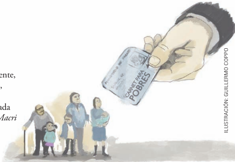
ILUSTRACIÓN: GUILLERMO COPPO

El PBI de nuestro país es aproximadamente de 545.000 millones de dólares. La inversión estatal es salud consolidada (la suma de los presupuestos nacionales, provinciales y municipales) sigue estancada en el 2,7% del PBI. Unos 14.715 millones de dólares.