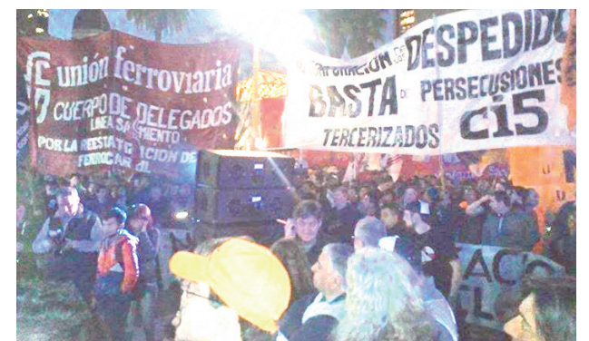
Los ferroviarios del Sarmiento y tercerizados de C15 juntos en Plaza de Mayo el 9 de agosto.