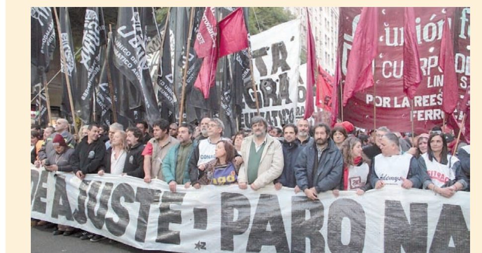
9/8, marcha unitaria de la izquierda asindical a Plaza de Mayo.

Si vos estás convencido de que la unidad y la construcción de un nuevo proyecto político amplio, unitario y de izquierda es una necesidad, ayudanos a librar esta batalla. Te invitamos a sumarte a nuestro partido, el MST-Nueva Izquierda. En tu barrio, tu lugar de trabajo o de estudio podés darnos una mano.