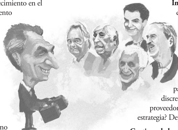
ILUSTRACIÓN: GUILLERMO COPPO

PRO a TPP (Trans-Pacific Partnership). El Acuerdo Transpacífico es la estrategia de EE.UU. para recuperar el espacio perdido en el mundo compitiendo con China. Y es el destino final al que conducen las relaciones carnales de Macri con el imperialismo. Ya dio el primer paso al participar como «observador privilegiado» en la cumbre realizada el 20 de junio en Chile.