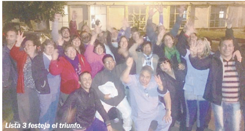
Lista 3 festeja el triunfo.