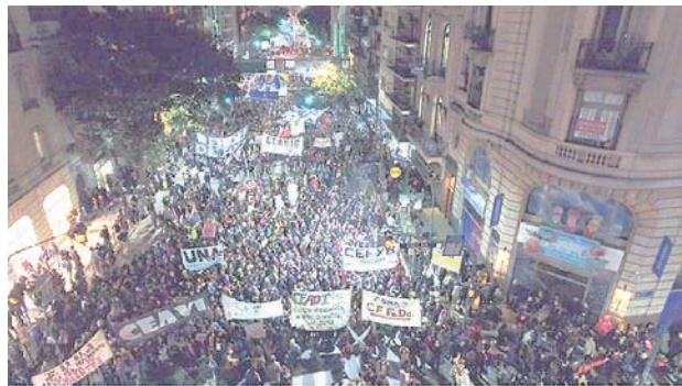
Marcha educativa, 12 de mayo

Los docentes nos encontramos crecientemente presionados por la lógica mercantil de la producción del conocimiento, presionados hacia posgrados arancelados y la producción serial de papers y la competencia por incentivos. Esto en un marco de pauperización salarial y escasa o nula capacidad de participar democráticamente en las decisiones que nos afectan. El gobierno de Macri se propone avanzar en la normalización capitalista del