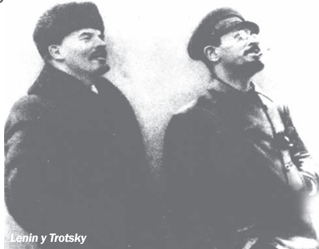
Lenin y Trotsky

A Trotsky le tocó la dura misión de mantener vivos los principios del marxismo-leninismo en medio de la noche fascista y estalinista. Gracias a esa pelea desigual se mantuvo la memoria y la acción revolucionaria que el estalinismo pretendió liquidar. Por eso las nuevas generaciones que redescubren a Marx, ven en el trotskismo un continuador de su obra y la de Lenin. No es casual que un escritor cubano, que no tiene origen en