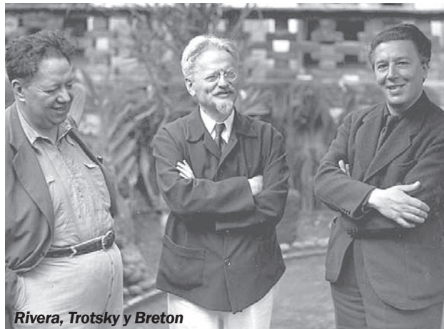
Rivera, Trotsky y Breton