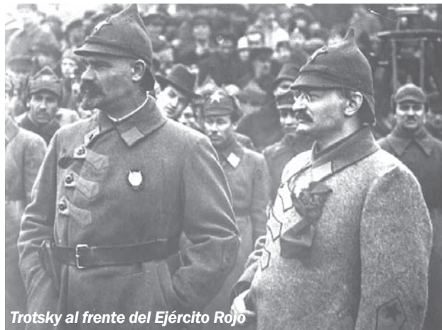
Trotsky al frente del Ejército Rojo

el marxismo, como Leonardo Padura, al que pudimos entrevistar en La Habana en julio de 2012, haya escrito esa hermosa novela llamada El hombre que amaba los perros en que la que popularizo la epopeya de Trotsky.