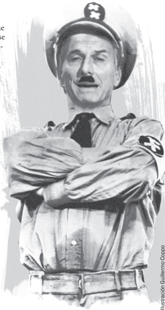
Ilustración Guillermo Coppo

Cuando un gobierno pone en duda cuestiones tan importantes, tan caras al pueblo argentino, tan presentes a pesar de que pasen los años, es porque su objetivo es desmontar una conciencia democrática profunda que le pone límites para avanzar, vaya casualidad, nuevamente con un plan económico anti popular, anti obrero y al servicio de las corpora-