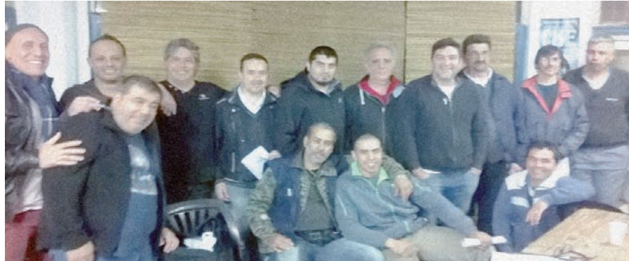
Algunos de los candidatos de la Violeta en el Frente de Unidad Violeta-Bordó.

Todos tenemos derecho a que nuestros hijos tengan prioridad para los ingresos, que los ascensos dejen de ser a dedo, y se debe respetar la antigüedad y conocimiento, publicando las vacantes como corresponde. Pasamos de manos privadas al Estado y la UF no movió un dedo para reclamar el resarcimiento.