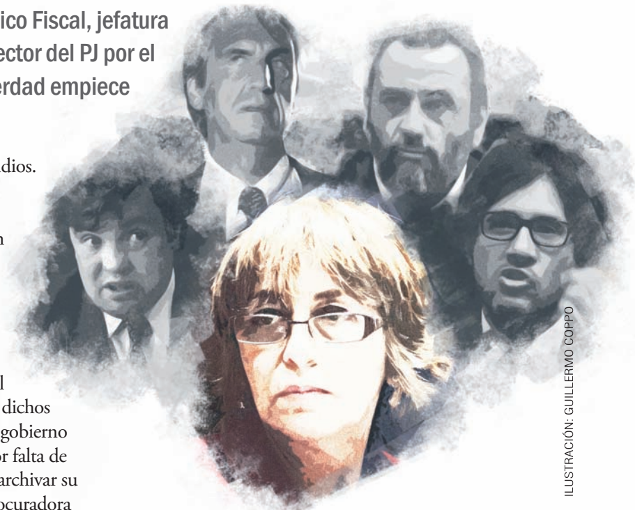
ILUSTRACIÓN: GUILLERMO COPPO

Lo que está desprestigiado es el Poder Judicial de conjunto: jueces y fiscales cómplices del crimen organizado, encubridores de la corrupción política y corruptos ellos mismos, siempre dispuestos a perseguir a los luchadores sociales pero amigos de los poderosos. Tienen una vida llena de privilegios con cargos vitalicios y sueldos altísimos, son prácticamente una casta intocable. Un engranaje más de un sistema y un Estado que sólo defiende los negocios capitalistas y a sí mismo.