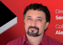
Director responsable Sergio García Colaborador especial Alejandro Bodart

Consíguela en Perú 439 - CABA | En nuestros locales del país En kioscos de revistas de CABA, GBA y ciudades del interior