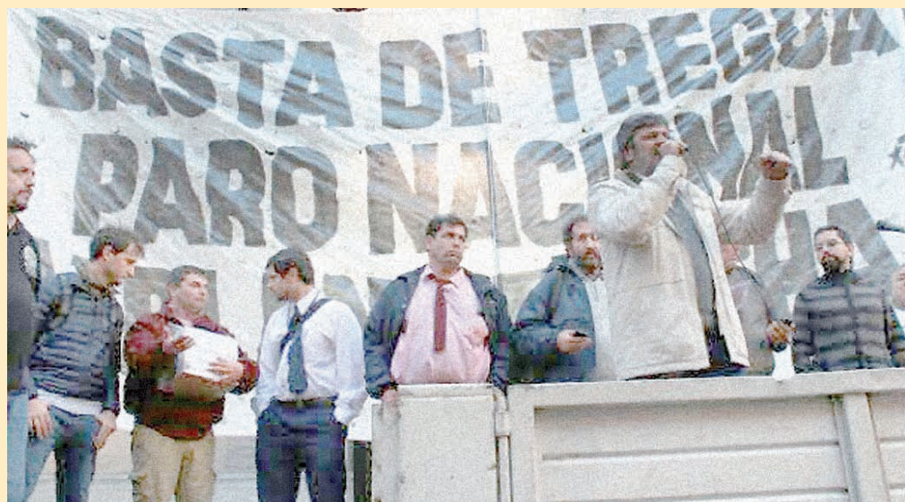
Acto del sindicalismo clasista el 28/10 frente al Ministerio de Trabajo

Llamamos al activismo sindical y a la izquierda a reflexionar sobre cuáles son las tareas más urgentes que están planteadas. Nosotros proponemos llamar a un gran encuentro sindical de todos los sectores clasistas y de izquierda, sin exclusiones. Organizarlo por consenso entre todas las corrientes que venimos enfrentando al gobierno, las patronales y las distintas alas de la burocracia. En base a un programa y una agenda para intervenir en común. Allí abordar todos los debates necesarios, al tiempo que priorizaremos los puntos de acuerdo para organizar y movilizar. Para apoyar todas las luchas, más allá de quién esté al frente. Para fortalecer a los nuevos delegados y promover listas de unidad clasista en todos los gremios. Impulsando un modelo sindical donde sean las bases las que decidan y una nueva dirección democrática y para la lucha. Esta es la propuesta de la Corriente Sindical del MST.