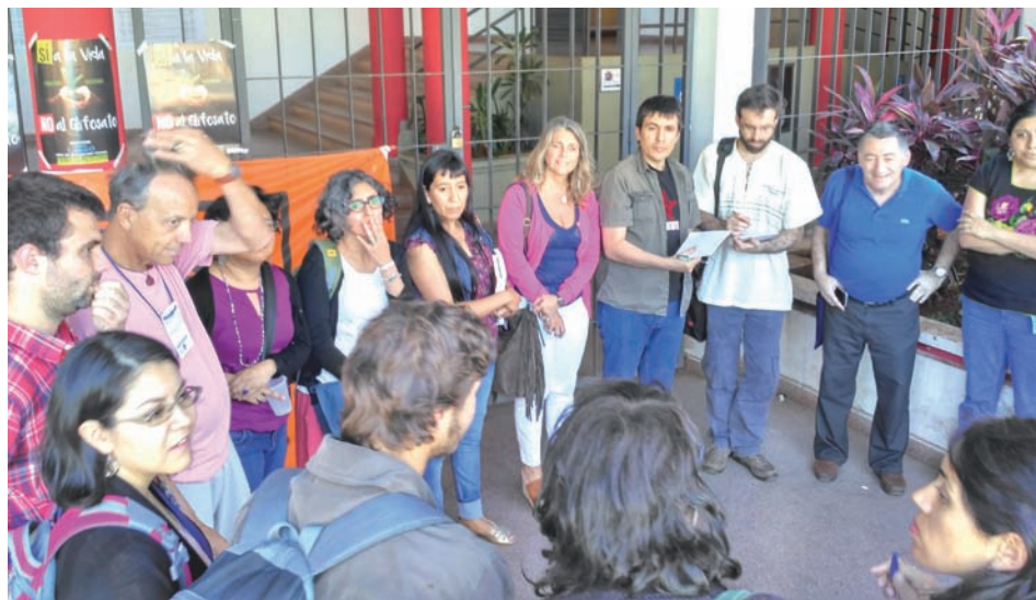
Activistas de varios países conformaron una Plataforma Continental contra los agrotóxicos

Los principales paneles, cada taller o encuentro transversal en Asunción estuvo cruzado por un debate crucial: el balance de los gobiernos progresistas y la perspectiva para lo que se viene. Sea que se discutiera del buen vivir o