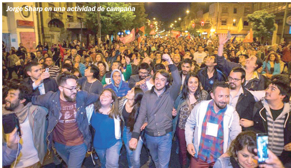
Jorge Sharp en una actividad de campaña

Primeramente saludar la victoria de Jorge Sharp, la voluntad de triunfo que tuvo su campaña y a partir de ahí el campo de posibilidad que inundó en la izquierda. El candidato del Movimiento Autonomista se impuso con más del 50% contra el candidato de la derecha y la Nueva Mayoría. Las diversas candidaturas independientes al duopolio tuvo su sorpresa en Valparaíso, a mano de Jorge Sharp, quien es militante del Movimiento Autonomista. Este grupo, junto al Frente de Estudiantes Libertarios, Nueva