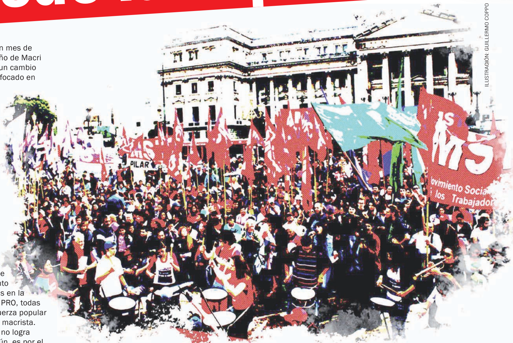
ILUSTRACIÓN: GUILLERMO COPPO

Desde el MST le proponemos a todas las fuerzas de la izquierda política y social que estén dispuestas, comenzar a dar pasos y conformar un nuevo espacio político común. Desde esa nueva construcción luego seguiremos proponiendo más unidad de la izquierda, tanto al FIT como a otros sectores. Pero hoy la primera tarea es animarnos a conformar un nuevo frente común de organizaciones políticas, referentes sociales, personalidades y trabajadoras/es y jóvenes que quieran sumar su aporte. Comencemos a andar. Caminemos juntos.