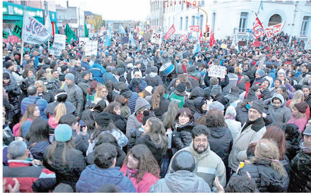
22 de abril: jubilados, empleados estatales, docentes, judiciales en una de las marchas más numerosas de los últimos 10 años.

El otro argumento central de Alicia y reproducido por los seguidores del kirchnerismo es el ahogo financiero al que la somete el gobierno nacional. Sin dudas, la política económica de Macri tiene consecuencias para la provincia. Pero como señalamos en artículos anteriores* es difícil saber los números reales de la provincia porque el gobierno se niega a mostrarlos. Sus diputados trabaron una ley de acceso a la información pública en la legislatura y Alicia apeló un fallo judicial que la obliga a brindar información. Por ejemplo: un documento del Tribunal de Cuentas (organismo con mayoría oficialista) muestra que el 20 de abril la cuenta donde ingresan los fondos de la Ley de Financiamiento Educativo tenía un saldo de más de $400 millones, sin embargo lxs docentes seguimos sin cobrar y esa plata no se sabe dónde fue. Algo similar ocurre con los fondos del incentivo docente, las retenciones por cuotas alimentarias o la ilegal retención de los aportes sindicales. A la ADOSAC, por ejemplo, el gobierno le debe actualmente $25 millones que lxs afiliados aportamos voluntariamente y se apropia el ejecutivo. Y hace otro