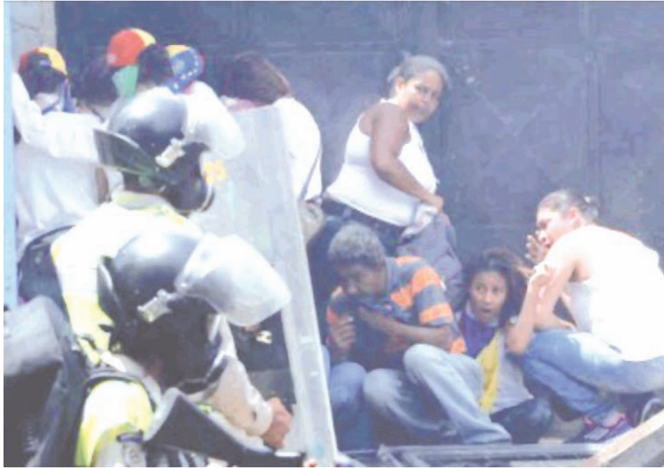
Ni Maduro ni la MUD son solución

Por eso creemos que en medio de crisis políticas y sociales de envergadura, no se puede actuar por los sentimientos o vivencias de un pasado ya distante ni justificar cualquier cosa a nombre de la simbología bolivariana. El sueño de Bolívar y el antiimperialismo de Chávez no están en Miraflores ni con Maduro. Asimilar esto, para entender la Venezuela real envuelta en la miseria y el desastre social, es parte necesaria de construir una propuesta desde la izquierda. Se necesita evitar las superficialidades y las campañas de castas burguesas oficialistas y opositoras, y animarse a analizar la profundidad del fenómeno y los hechos para de ahí sacar conclusiones correctas y, por ende, levantar propuestas acordes desde la izquierda anticapitalista y socialista. Eso tenemos que hacer quienes realmente queremos una salida positiva para las mayorías populares de Venezuela.