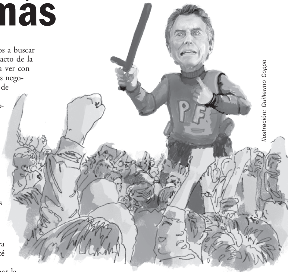
Ilustración: Guillermo Coppo

Son lo mismo. Santa Cruz representa un nuevo y claro ejemplo de la política K. No cobran los docentes, los jubilados y otros sectores. Según Alicia K, recibió una