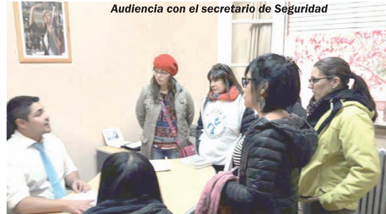
Audiencia con el secretario de Seguridad

En esta oportunidad podemos decir que hemos logrado conquistar un avance. Hay que seguirlo de cerca para que se efectivice y sirva de antecedente a futuro para posibles situaciones similares. Pero la realidad en Santa Cruz continuamente nos muestra que la policía y el sistema judicial son cómplices, en un silencio e inacción que termina permitiendo nuestras muertes y no encontrar justicia después.