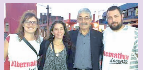
Lista Multicolor, SUTEBA San Isidro

El 17 de mayo votemos a la Multicolor en SUTEBA para ganarle a la Celeste en cada distrito y en la Provincial. Anotate como fiscal, junto a Alternativa Docente, para enfrentar el fraude Celeste con padrones inflados. Por un SUTEBA democrático, de lucha e independiente de los gobiernos.