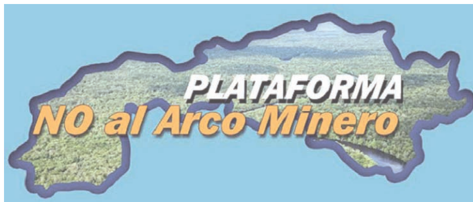
Organizaciones ambientalistas, políticas y sociales contra la megaminería

Sobre la base de esta situación crítica, lo decisivo es definir quién decide qué camino seguir, cómo salir de una escalada de muerte y enfrentamientos provocados por dos poderes cupulares mientras millones a su vez no se sienten representados por