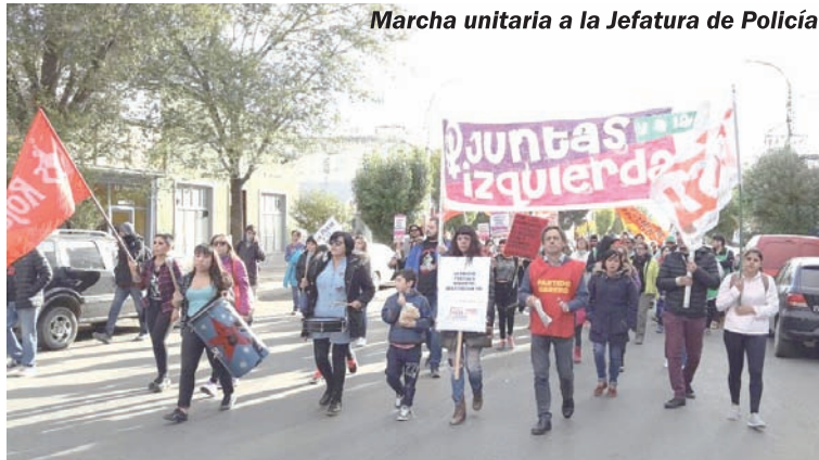
Marcha unitaria a la Jefatura de Policía