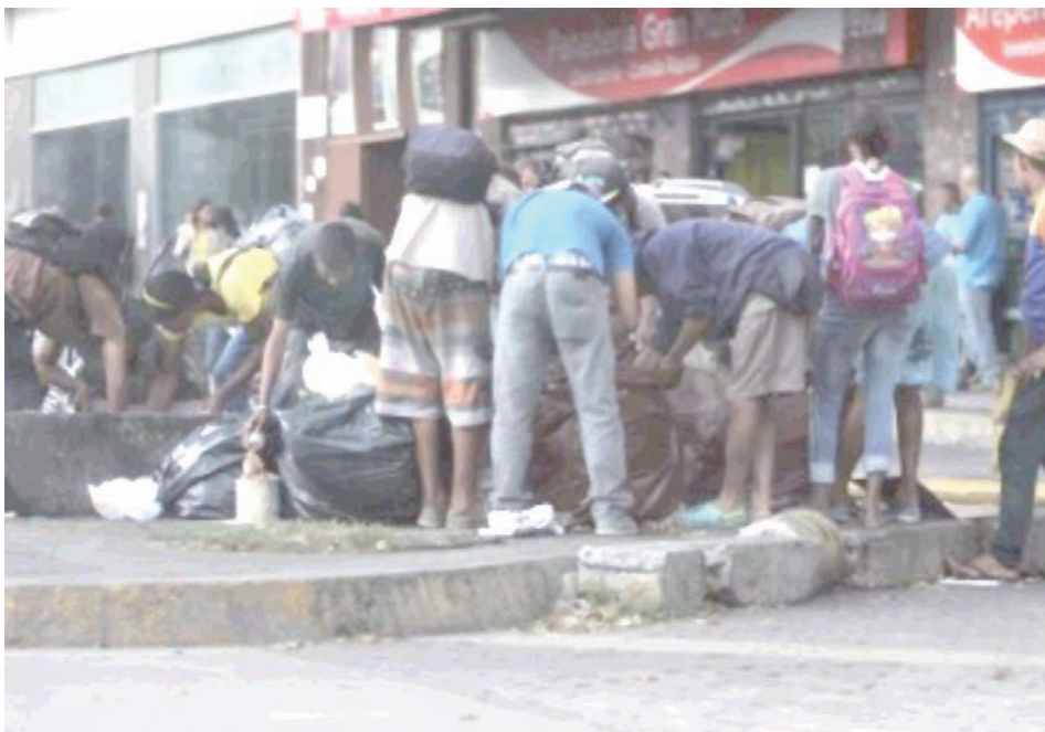
Saqueos en Caracas

como un narcótico para una nomenclatura dedicada a raspar la olla de los bienes públicos". En resumidas cuentas, en la Venezuela de Maduro se aplican recetas de ajuste sobre las mayorías populares que no tienen alimentación, remedios ni otras necesidades básicas satisfechas, mientras se siguen transfiriendo millones de dólares a grandes corporaciones. Esa es la realidad inocultable.