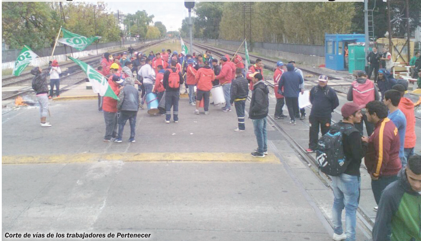
Corte de vías de los trabajadores de Perteneceer

La tercerización en el país como método de contratación se comenzó a aplicar a comienzo de la década de los 90, por la necesidad de las patronales de recuperarse de la crisis, incrementando la productividad y los beneficios mediante un mayor aprovechamiento de la fuerza laboral. La tercerización es uno de los mecanismos que tienen las empresas para avanzar sobre los convenios laborales y de ese modo abaratar los "costos" maximizando sus ganancias.