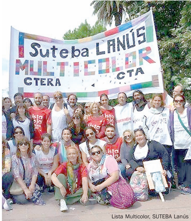
Lista Multicolor, SUTEBA Lanús

Los docentes protagonizamos una lucha heroica, 9 paros nacionales y un mes de paro provincial, multitudinarias marchas y apoyo social. Si no ganamos es porque la Celeste atomiza el reclamo, instala una Escuela Itinerante sin llamar