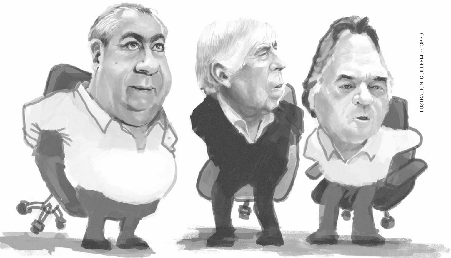
ILUSTRACIÓN: GUILLERMO COPPO

Lo que le preocupa en realidad al macrismo no es “democratizar” ni la presencia de “mafias” sino que esos dirigentes burocráticos, mafiosos y eternos no controlen con la firmeza necesaria a los trabajadores. En este punto, como lo demostraron en incontables ocasiones, y lo demuestran hoy congelando cualquier medida de