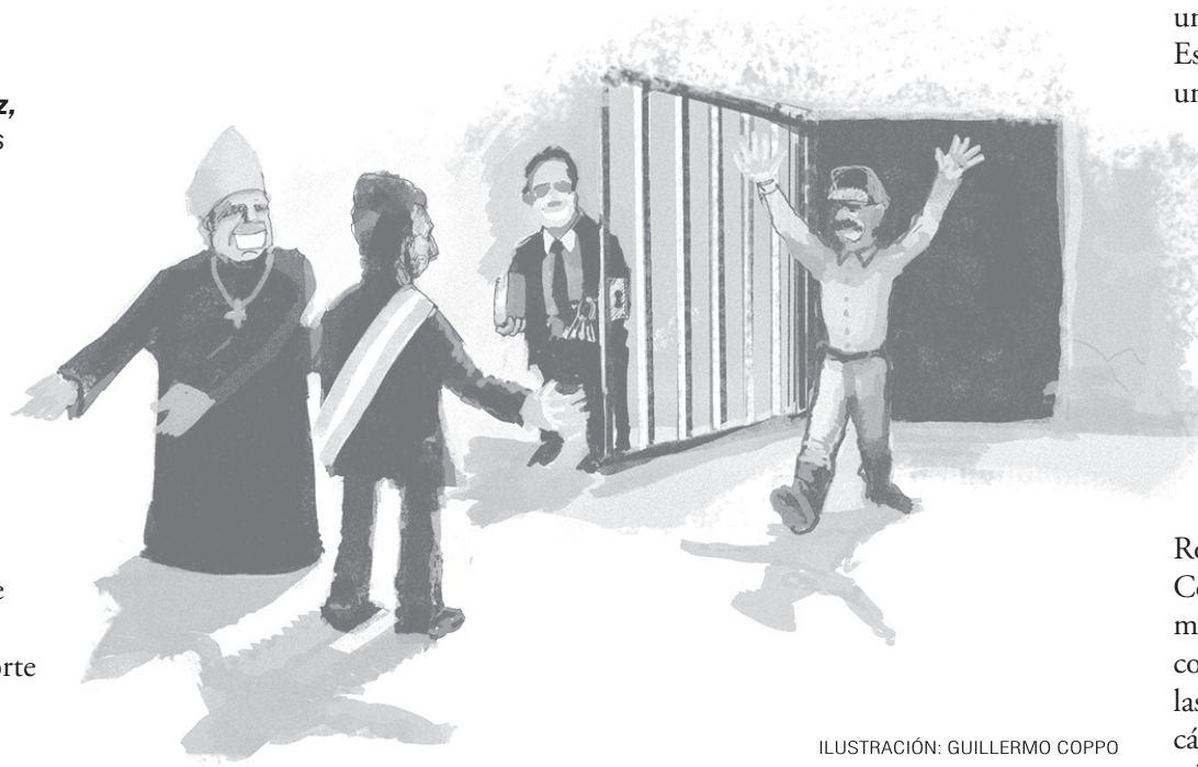
ILUSTRACIÓN: GUILLERMO COPPO

jueces Lorenzetti y Maqueda, señalando que el 2x1 no es aplicable a los delitos de lesa humanidad, como los que cometió Muiña. Para esos delitos, cualitativamente más graves que los delitos comunes, no hay amnistía ni indulto, ni prescripción; es decir, no vencen.