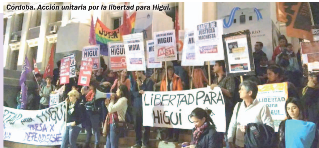
Córdoba. Acción unitaria por la libertad para Higuí.

liberarla. Así, la semana pasada se conformó en Capital el Frente por la Libertad y la Absolución de Higuí, un espacio destinado a coordinar acciones a nivel nacional.