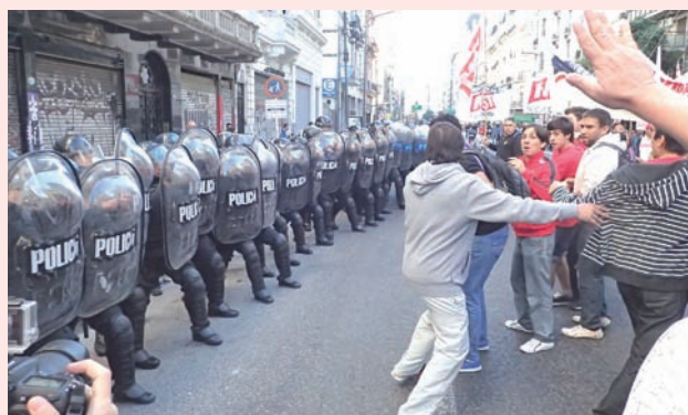
Represión al MST en Callao y Corrientes el 6 de abril

Los gobernantes entonces se desesperan por lavarles la cara, mostrar otra imagen y por eso necesitan tenerlos de su lado, como aliados