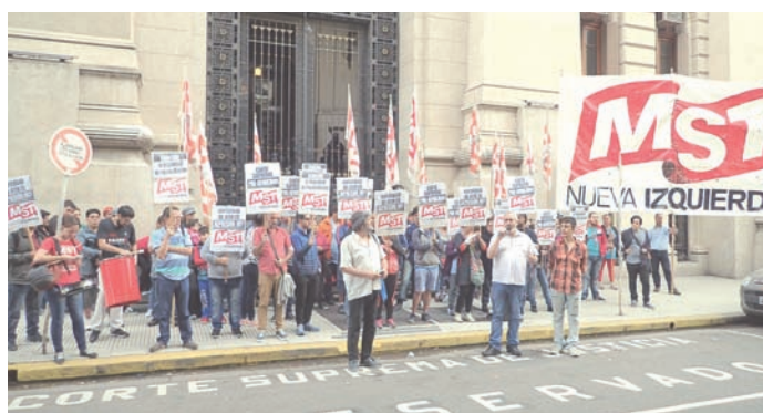
Escrache a la Corte contra el 2x1, el 5 de mayo.