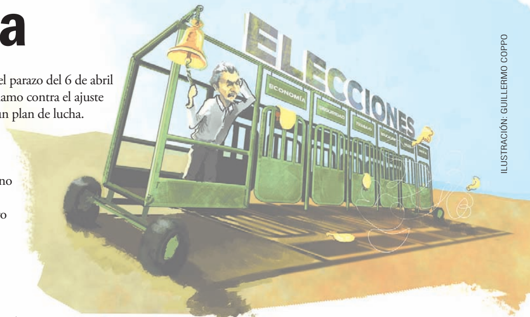
ILUSTRACIÓN: GUILLERMO COPPO

Qué se vota. Las PASO de agosto abrirán el camino para luego elegir legisladores. Con lo cual el debate se centra en qué diputados se necesitan en el Congreso. Acordate de lo que viste hasta ahora. Sobran macristas para votar ajustes. El massismo y el