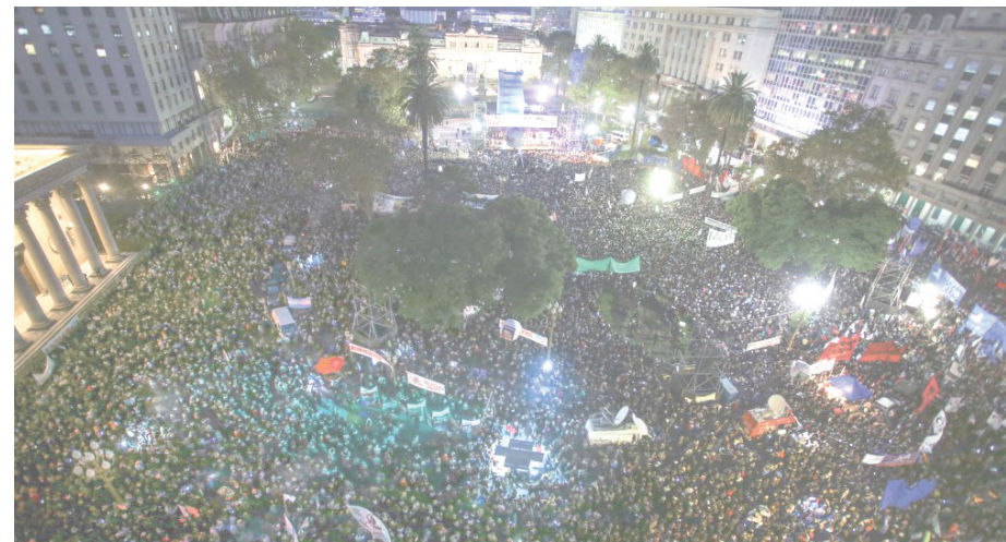
10 de mayo, la Plaza colmada contra el 2x1.