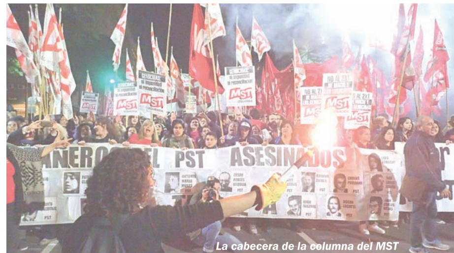
La cabecera de la columna del MST