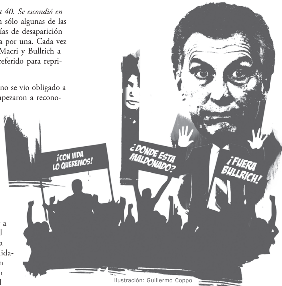
Ilustración: Guillermo Coppo

«Nos mean y dicen que llueve.» Sí los reaccionarios están