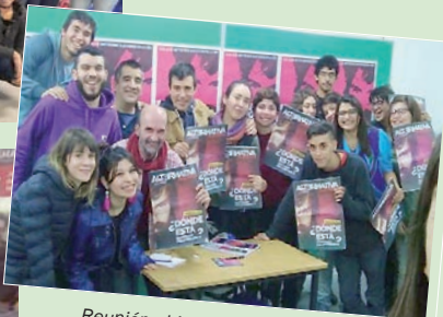
Reunión abierta en CBC Montes de Oca.