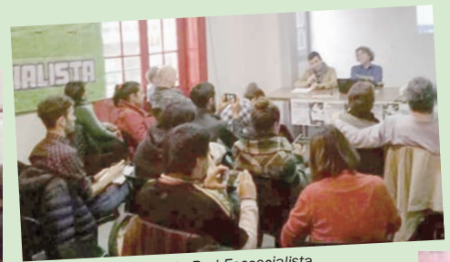
Con la Red Ecosocialista.