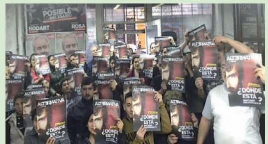
En Parque Avellaneda.