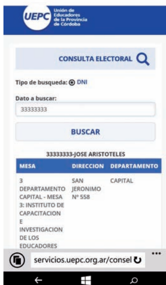
Prueba del fraude

Un proceso de desmovilización atraviesa al gremio, en un momento