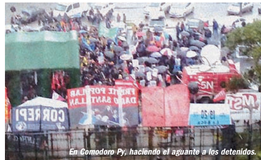
En Comodoro Py, haciendo el aguante a los detenidos.

Si bien el gobierno de Cambiemos salió fortalecido por el resultado de las PASO, su envalentonamiento tiene límites. Es un hecho que algunas franjas medias -incluso votantes del oficialismo- pueden tolerar la represión a un piquete de desocupados, pero no así una desaparición forzada,