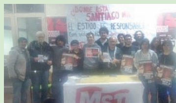
Charla en Facultad de Sociales UBA.