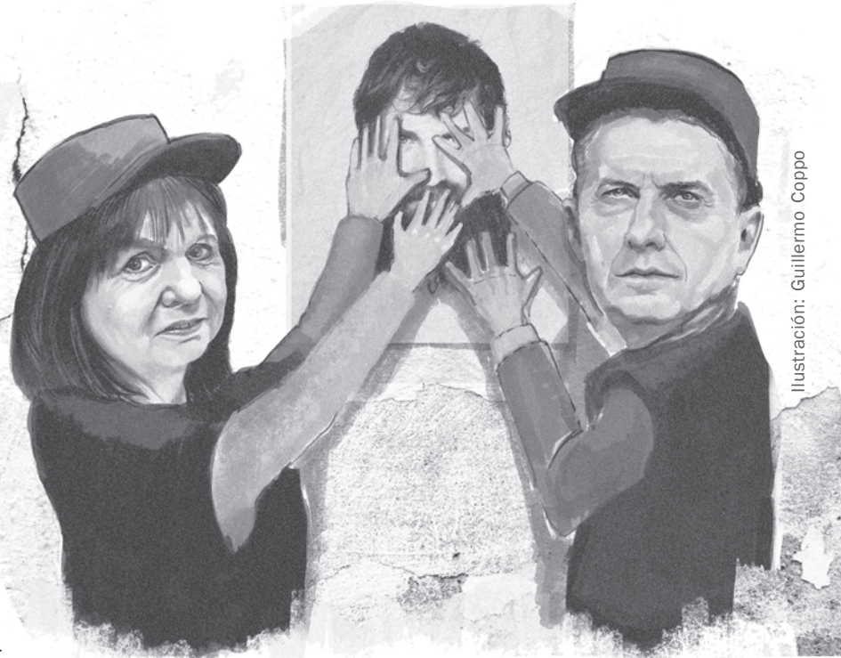
Ilustración: Guillermo Coppo

¡Que polenta tiene la juventud! Los secundarios tomaron escuelas, salieron a las calles y rechazaron el proyecto Escuela del Futuro. Por un lado estuvieron los que dijeron «Los chicos, son chicos y no saben» «No quieren estudiar ni laborar» junto a los que por una u otra vía cuestionaron las tomas. Por otro lado, estuvimos los que