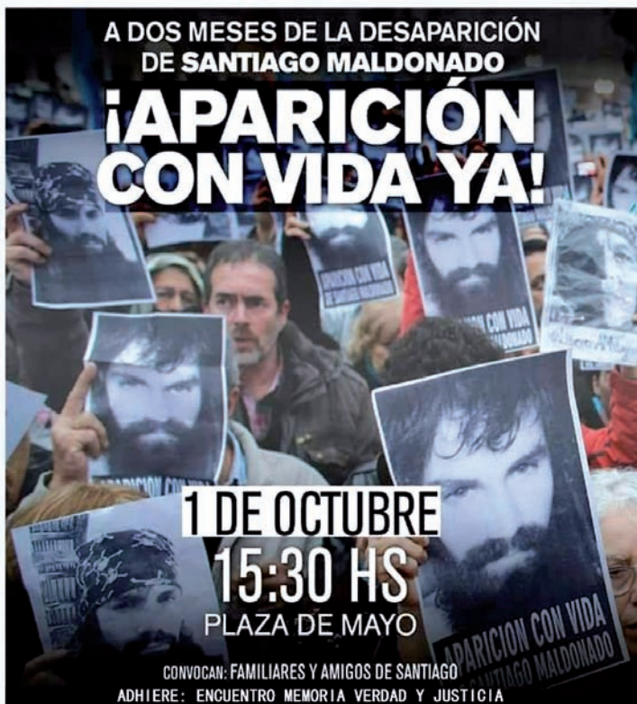
El MST concentra 14.30 en Florida y Diagonal Norte.