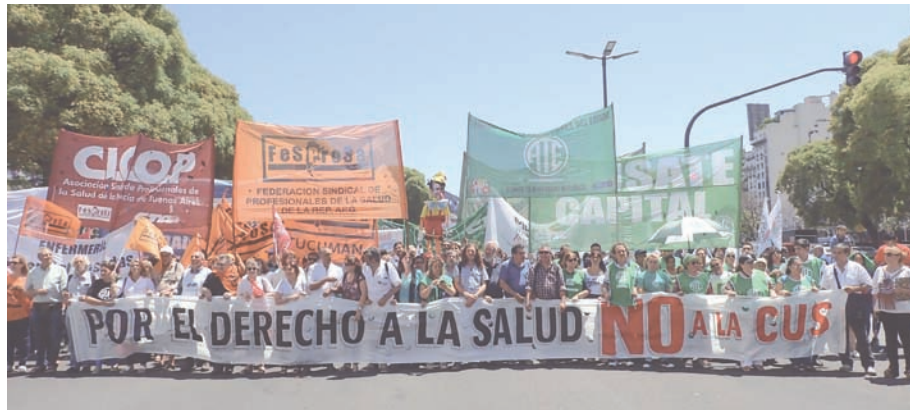
Cabecera unitaria de la marcha

La burda mentira de la CUS es que buscan otorgar "cobertura" a los sectores vulnerables, que ya tienen una "cobertura": el sistema público de salud, que incluye la atención de cualquier tipo de intervención sanitaria. Entonces... ¿por qué no mejorar el sistema público?