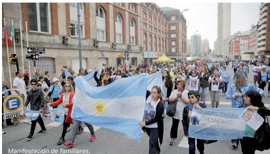
Manifestación de familiares.

En definitiva unas Fuerzas Armadas al servicio de las necesidades de nuestro pueblo. No contra el pueblo y lamentablemente contra aquellos integrantes pobres de sus filas, a los que ni siquiera se toman el trabajo de cuidar... mostrando su carácter y su desprecio de clase.