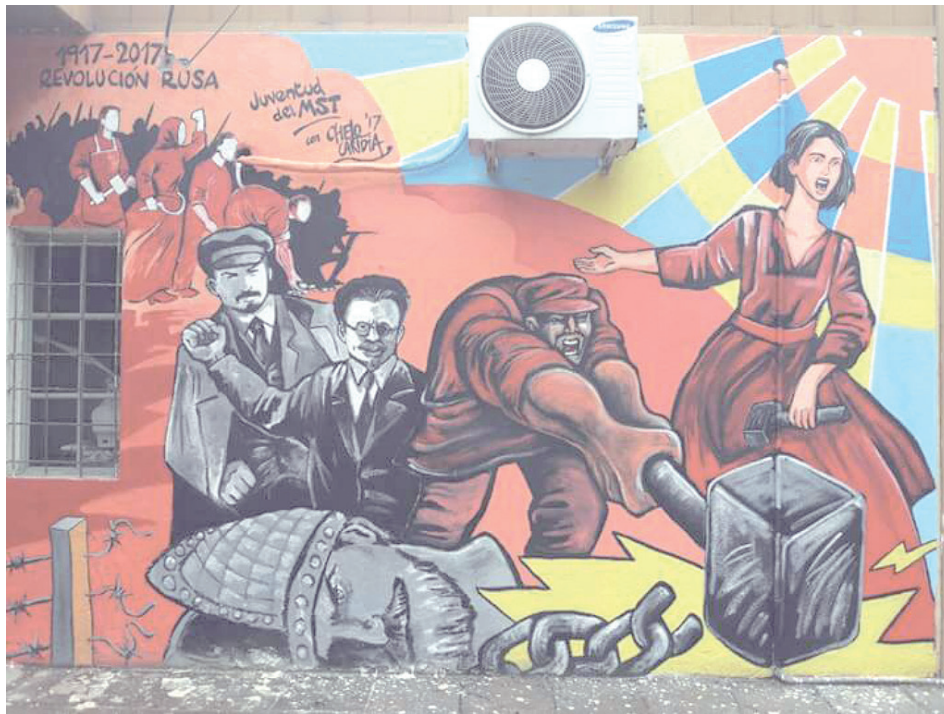
Mural realizado en la Facultad de Ciencias de la Educación y Psicología de Comahue por el artista Chelo Candia y la JS del MST.

Se expropió a los grandes terratenientes y se repartió la tierra a los millones de campesinos que llevaban siglos sobreviviendo, de hambruna en hambruna. Se decretó el control obrero de la producción y la autodeterminación de las naciones oprimidas por el imperio ruso. Mientras en Inglaterra, Francia, Alemania y EE.UU., las mujeres aún no tenían derecho a votar, en la Rusia obrera las mujeres conquistaron no solo el sufragio universal, sino también el acceso estatal y gratuito a los anticonceptivos y el aborto, y se inició la construcción de una red de guarderías, comedores y lavaderos comunitarios para facilitar la participación de las mujeres en el trabajo productivo y en la vida política y cultural. Se erigió el régimen más democrático que la humanidad haya conocido. Obra de la creatividad de las masas movilizadas, los soviets, esos consejos de diputados-delegados elegidos en asambleas y permanentemente revocables, pusieron el poder por primera y única vez en la historia en manos de las masas trabajadoras, que pasaron a incidir directa y cotidianamente en las decisiones políticas, económicas y sociales.