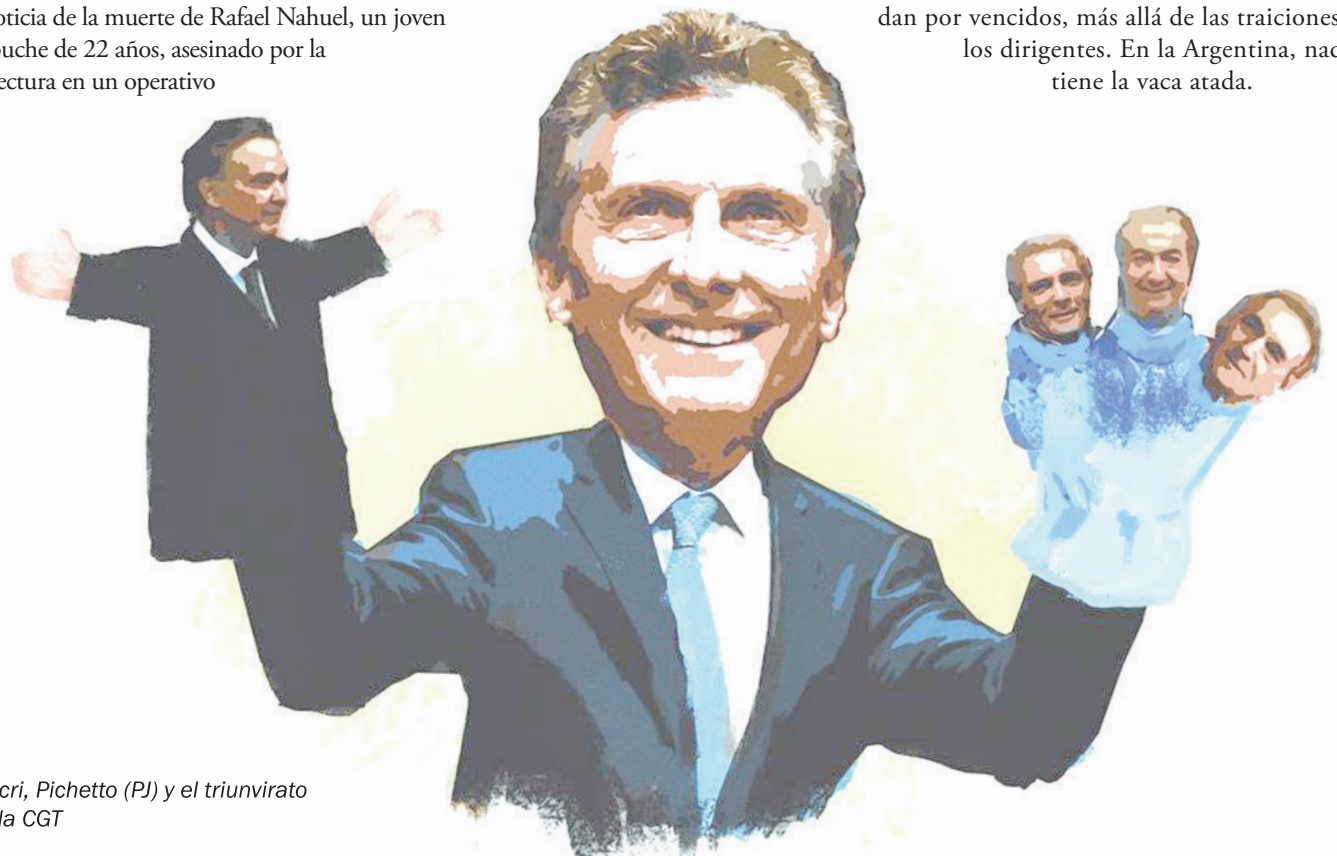
Macri, Pichetto (PJ) y el triunvirato de la CGT

Es la Argentina. Hay políticos que ya deberían aprender que acá todo es posible. Lo que hoy parece sólido, mañana se licúa. Lo que hoy parece triunfal, mañana pelea el descenso. Lo que hoy son apoyos masivos, mañana pueden ser extendidos desencantados. Esto tiene explicación. El país lleva décadas de crisis económicas y políticas permanentes. El régimen institucional sufrió un tremendo golpe con el Argentinazo y las consecuencias de la hecatombe capitalista del 2008 llegaron para quedarse. A esto se suman la falta de credibilidad de los viejos partidos y la tenaz resistencia de los trabajadores y el pueblo que nunca se dan por vencidos, más allá de las traiciones de los dirigentes. En la Argentina, nadie tiene la vaca atada.