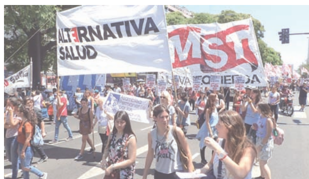
Columna de Alternativa Salud y el MST

Por todo esto, es que para enfrentar la implementación efectiva de la CUS creemos que es sustancial ir hacia la construcción de un gran movimiento que le pare la mano al gobierno. El MDS es ese gran primer paso, que lamentablemente aún no se hizo efectivo como por ejemplo contra la reforma laboral, donde aún prima la dispersión