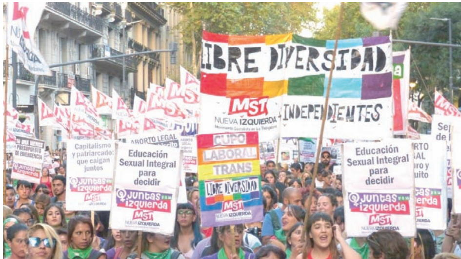
Nuestra columna en la marcha del 8M en Buenos Aires.