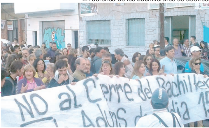
En defensa de los bachilleratos de adultos.

Hay que mantener el alerta, exigir que se anule la Resolución y que los Bachilleratos de Adultos se mantengan en Secundaria y Técnica. Para ello, reclamar a SUTEBA y el FUDB un paro de 48hs con movilización provincial, con paros progresivos hasta derogar de la funesta resolución y lograr aumento de salario y presupuesto.