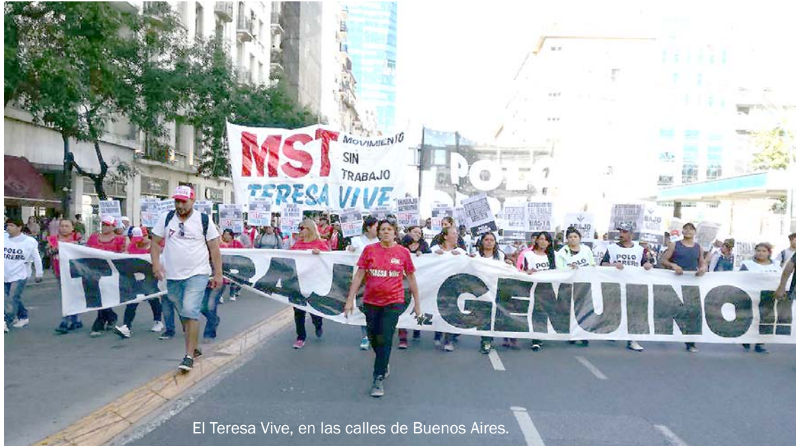
El Teresa Vive, en las calles de Buenos Aires.

El 80% de quienes formamos los movimientos sociales somos mujeres. Somos las mismas que el sistema