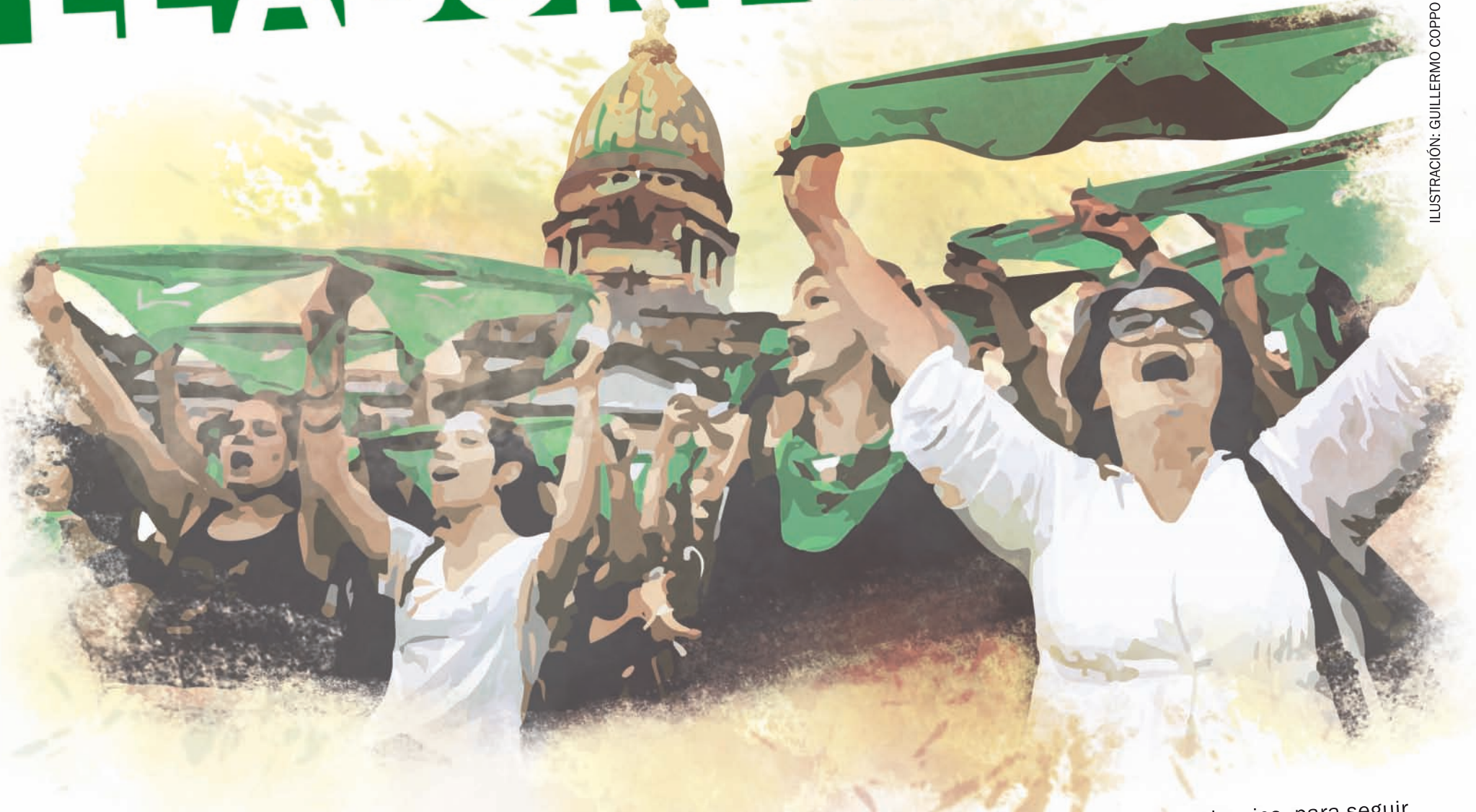
ILUSTRACIÓN: GUILLERMO COPPO

Finalmente, el martes 20 de marzo las cuatro comisiones de la Cámara de Diputados acordaron el cronograma de audiencias sobre los proyectos de ley relativos al aborto. Serán los martes y jueves de 9.30 a 18.30 y cada diputada o diputado puede presentar hasta cuatro expositores, que tendrán 7 minutos cada uno. Este proceso terminará a fines de mayo, de modo que el proyecto iría a votación al recinto de sesiones en junio. Si la ley se aprueba en Diputados pasa al Senado, donde la batalla es más difícil pero no imposible.