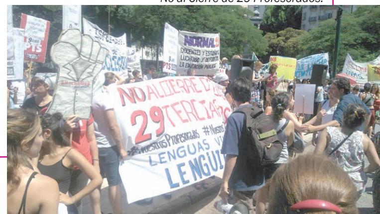
No al Cierre de 29 Profesorados.

Mientras peleamos por que retiren este proyecto, debemos debatir qué reformas queremos en la Formación Docente. Con un Congreso Pedagógico Educativo Nacional y resolutivo, donde instituciones privadas y la iglesia no tengan injerencia. Y aumentar el presupuesto, eliminando el subsidio a las privadas. Estas peleas se pueden ganar. Te invitamos a sumarte a darlas en conjunto.