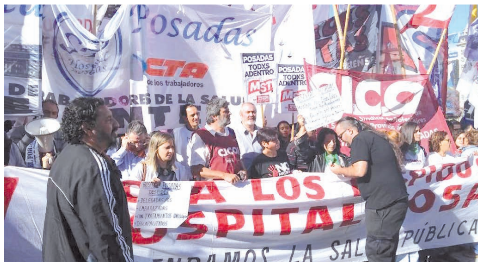
20M: marchando al ministerio de Salud.

Con unidad, coordinación y fuerza podemos reincorporar a nuestrxs compañerxs. Tenemos que insistir en el reclamo de coordinar con otros sectores, comenzando por el INTI, como discutimos en el encuentro del 17F. Y ante las reiteradas negativas a comenzar una mesa de diálogo, por parte del gobierno tenemos que preparar las movilizaciones y cortes tanto en los accesos y calles. Tenemos la certeza de que este conflicto es parte de un plan de gobierno para tratar de destruir la salud pública, preparando el terreno para las reformas privatizadoras y para ello necesita no sólo reducir presupuestos sino descabezar a las conducciones combativas como las de CICOP y STS y a las agrupaciones que venimos bancando la pelea. La unidad y la solidaridad son claves para lograr el triunfo.