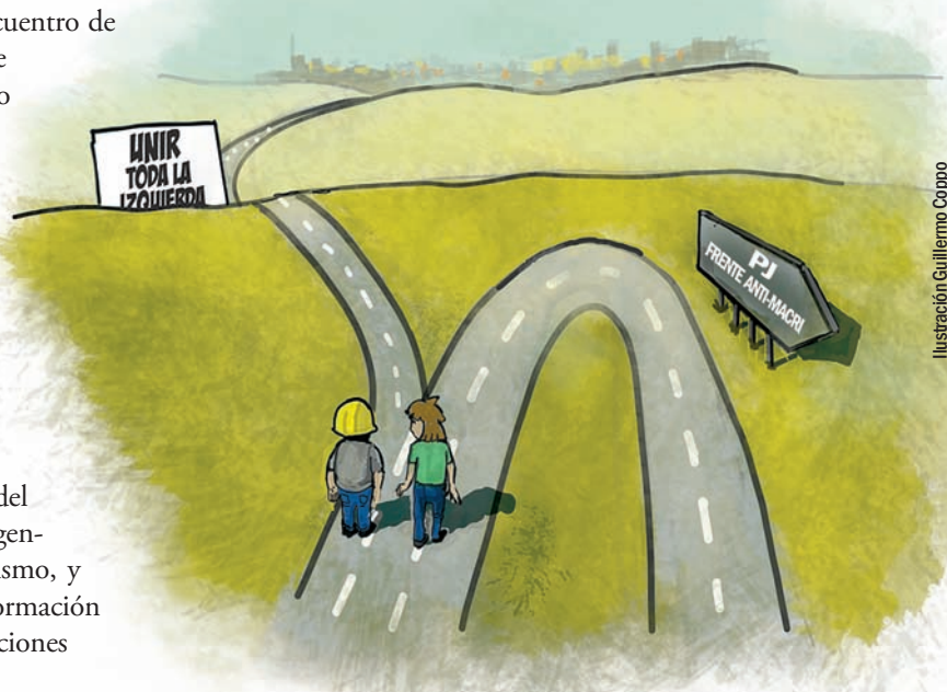
Ilustración Guillermo Coppo

Hoy no se fía, mañana sí. El PJ, además, no propone la unidad antimacrista para la necesidad más urgente que tienen los trabajadores y el pueblo, que es luchar hoy para derrotar el plan de ajuste y represión de Cambiemos. No hay unidad peronista para romper el techo salarial, ni para unir las luchas en curso contra despidos en el Posadas, el INTI, Río Turbio y tantos lugares más, ni para conquistar el derecho al aborto. Al contrario, algunos dirigentes parecen