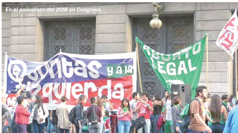
En el pañuelazo del 20M en Congreso.

En igual sentido, algunas posturas en la Campaña no querían hacer el pañuelazo ante la Quinta de Olivos porque "Macri habilitó el debate parlamentario". Es al revés: fue la movilización la que lo obligó a decir "si la ley se vota, no la veto". Y será nuestra movilización y presión, con las jóvenes al frente, la que obligará a votar Sí en Diputados y en el propio Senado.