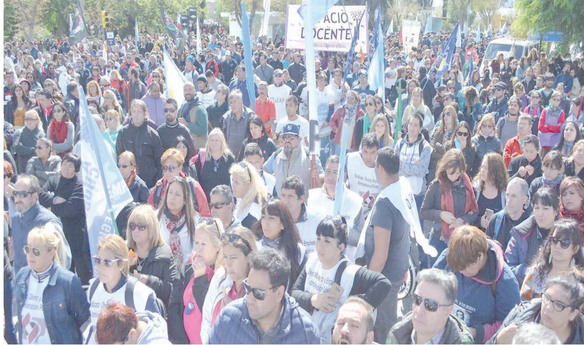
Masiva movilización en Chubut.

En asambleas se debe exigir un nuevo paro nacional para retomar y unir la lucha, convocar a la Marcha Federal y un plan de luchar resuelto en asambleas y plenarios. Por un salario que cubra la canasta familiar y el aumento ya, al 10% del PBI, del presupuesto educativo.