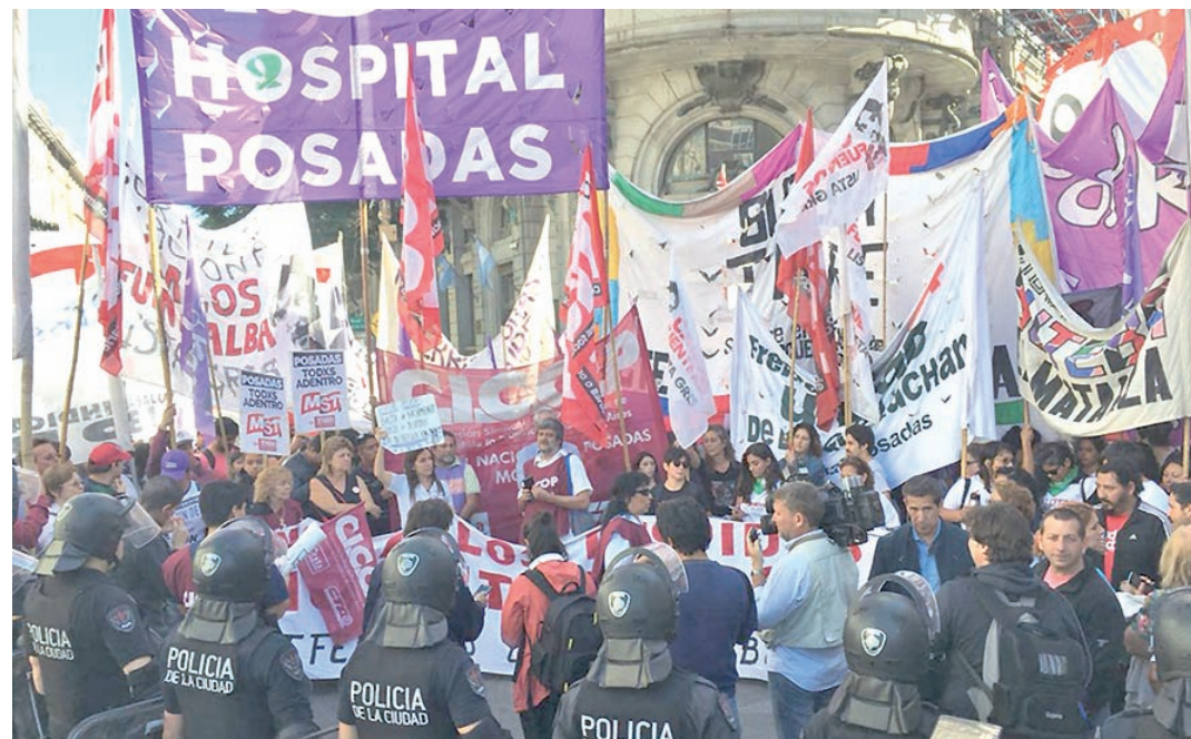
20M: cortando la Avenida 9 de Julio.

Ante este panorama el Posadas no deja de recibir solidaridad por parte de la población, por eso hoy en día tenemos acompañándonos a la comisión de pacientes del hospital Posadas. Toda esta gran solidaridad con los conflictos y la