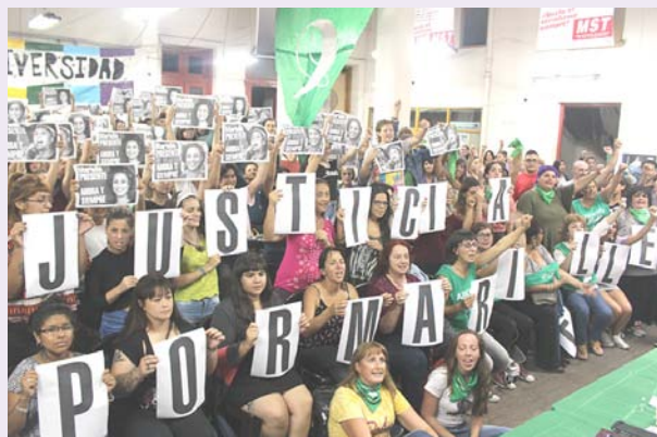
Asamblea feminista metropolitana.