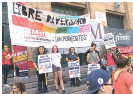
En el acto unitario ante la Facultad de Medicina (UBA), el 20F.

como una transición sino como una identidad específica. Incluso utilizan el término bisexual en forma amplia, no necesariamente entendido como atracción hacia un varón y una mujer, sino atracción por el propio género y por otro distinto, sea cual fuere.