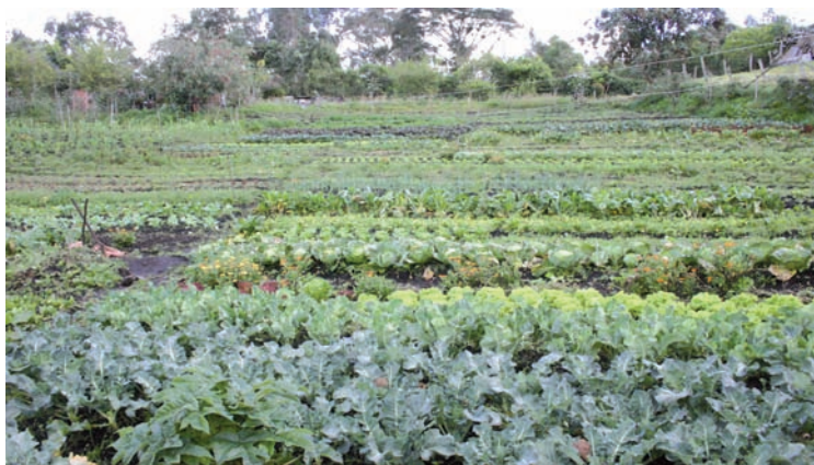
La agroecología a gran escala es una opción viable frente al agronegocio capitalista

Obviamente, todo este plan requiere una reorientación general de la economía, con perspectiva anticapitalista, de confrontación con las corporaciones y un potente control social de lxs trabajadorxs del campo y la ciudad movilizadas de forma asociada. Son algunas de las medidas que levantamos como causas sociales y políticas básicas para garantizar derechos para el 99%. Para eso militamos.