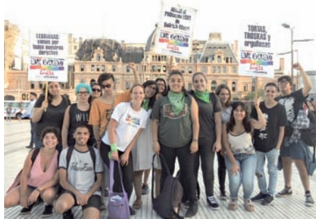
El 7M, en la estación Constitución, por la visibilidad lésbica.