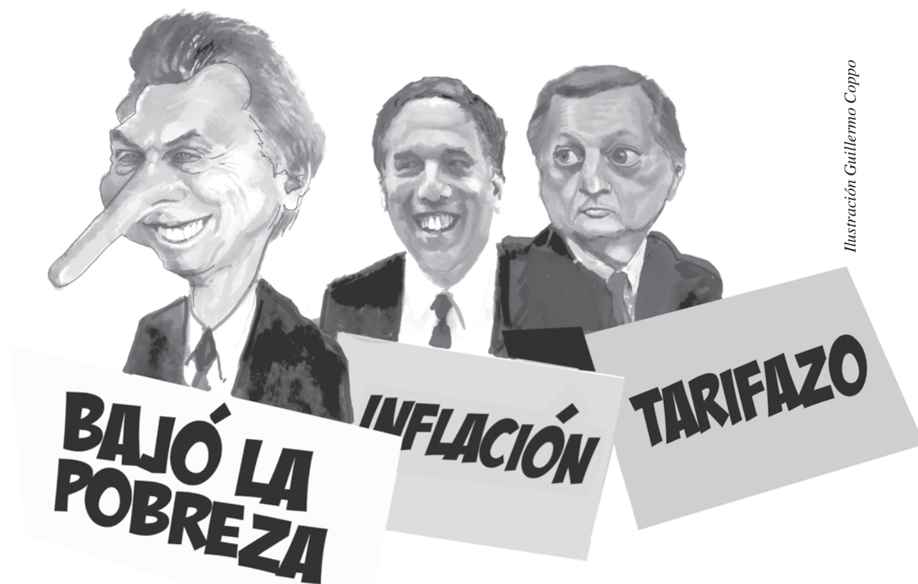
Ilustración Guillermo Coppo

Llegó el tarifazo del gas. La indignación va saltando de casa en casa, de depto a depto, en la medida que van llegando las boletas con el brutal aumento del 40% establecido por el ministro de Energía Juan José Aranguren. Para peor, llegó un mes antes de lo establecido legalmente. Este nuevo manotazo al bolsillo popular se justifica con la supuesta necesidad de recortar subsidios, que, en el caso del gas, es una mentira descarada. Solo está subsidiado el transporte y distribución del fluido una parte menor de la factura. Es decir, ya pagábamos el costo real del gas, pero el gobierno LO modificó arbitrariamente. De esta manera, los usuarios le subsidiamos las ganancias a las petroleras en su negocio.