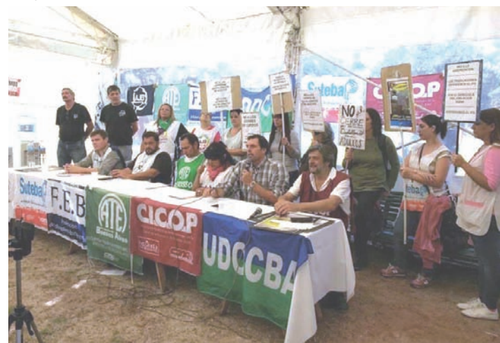
Carpa unitaria frente a la Gobernación.

Plata hay, el gobierno nacional debe aportar partidas extras, eliminar los subsidios a la enseñanza privada, acabar con los privilegios: en vez de dietazos a senadores que cobran $120 mil, que ganen como una maestra o todxs ganemos como diputado, poner impuestos a las corporaciones y dejar de pagar la deuda a los bonistas. La deuda es con el pueblo. Para potenciar estas peleas se necesita un polo unitario del sindicalismo combativo; unidad necesaria para apoyar las luchas, reclamar con más fuerza el paro nacional y dar pasos hacia la nueva dirección que se necesita. Te invitamos a organizarte en nuestras agrupaciones sindicales de ANCLA para dar juntos esta disputa.