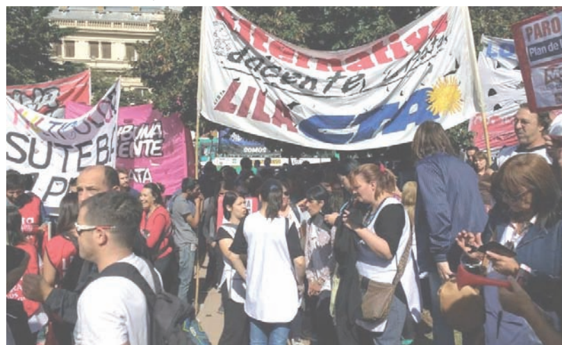
Alternativa Docente, presente.

de lucha del gremialismo docente, el que protagoniza un tercio de las huelgas del país, y llega a encabezar el 50% de las medidas con estatales y salud.