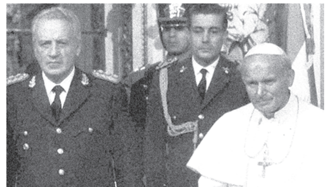
Juan Pablo II junto a Galtieri.