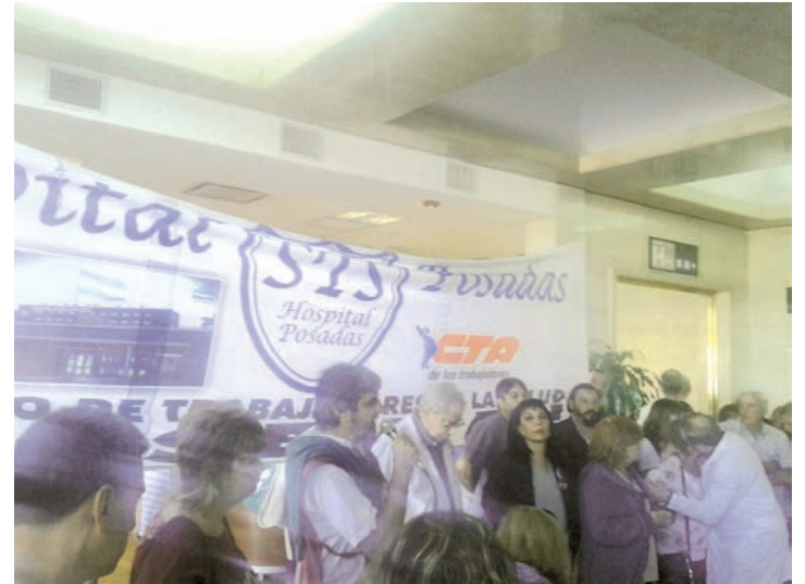
Asamblea resolviendo las próximas medidas.

Por eso no nos queda otra opción, hay que tomar la lucha en nuestras manos y demostrarle al gobierno que