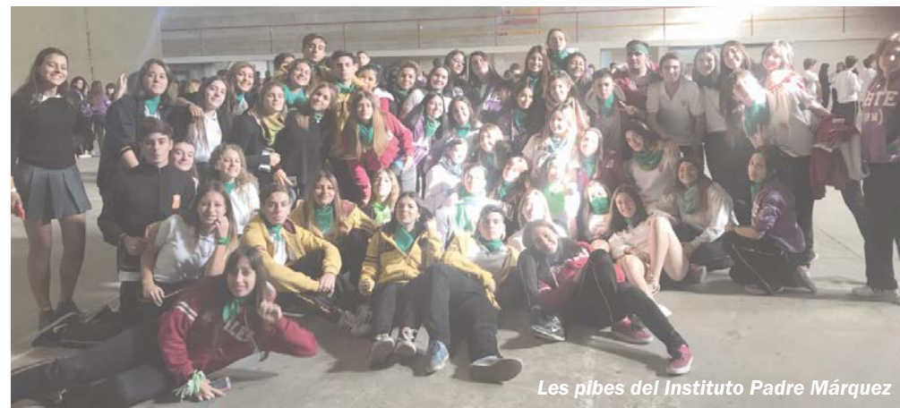
Les pibes del Instituto Padre Márquez

La nota de color se la llevó el bizarro y enorme feto de plástico, que generó fuerte bronca y repudio que se hicieron sentir en