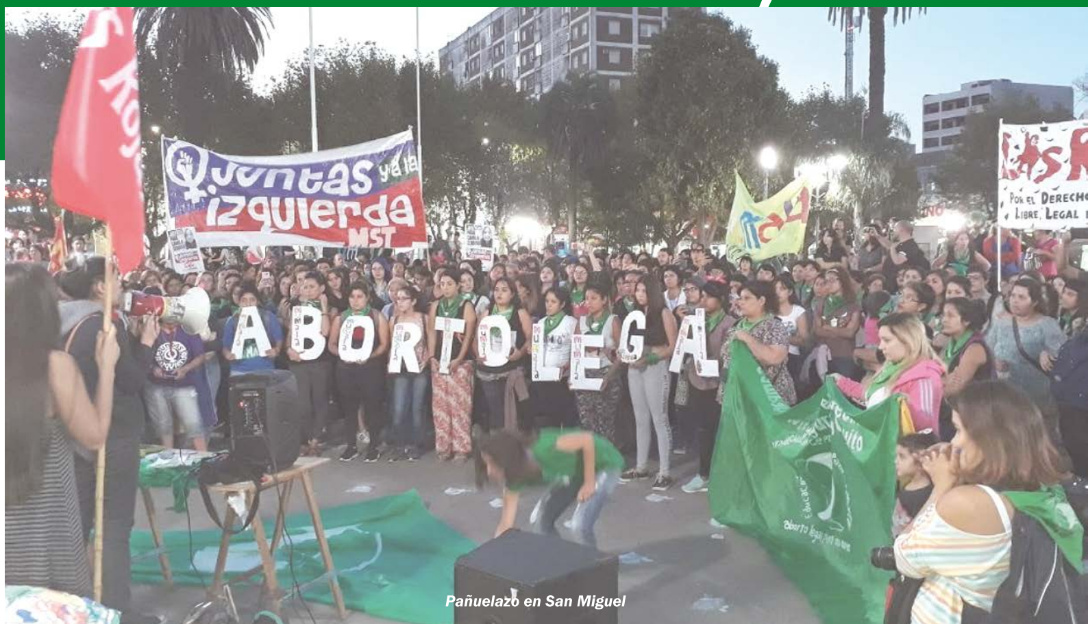
Pañuelazo en San Miguel

para conquistar el aborto legal: nuestra organización y nuestra movilización en las calles.