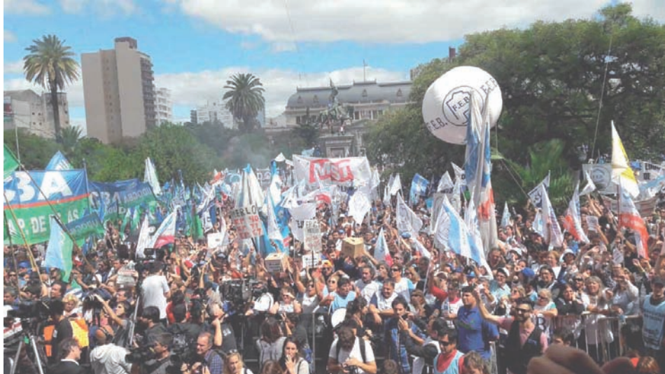
Se necesita un plan de lucha conjunto.

¿Se puede ganar? ¿No hay cómo torcerles el brazo? ¿Cómo encarar con éxito la pelea salarial? Lo primero es decir que si pueden mostrar esa decisión de seguir con el ajuste es por la burocracia sindical, en particular la CGT, que salió a salvarle la ropa al negrero y cascoteado ministro Triaca, al firmar por el 15% que pedía.