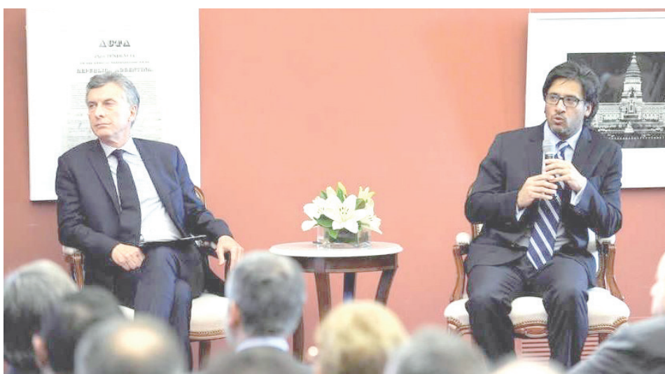
Macri y Garavano, ministros de Justicia