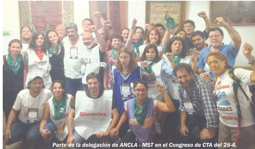
Parte de la delegación de ANCLA - MST en el Congreso de CTA del 28-4.

Llamamos a articular la lista alternativas sobre las siguientes bases programáticas, entre otras.