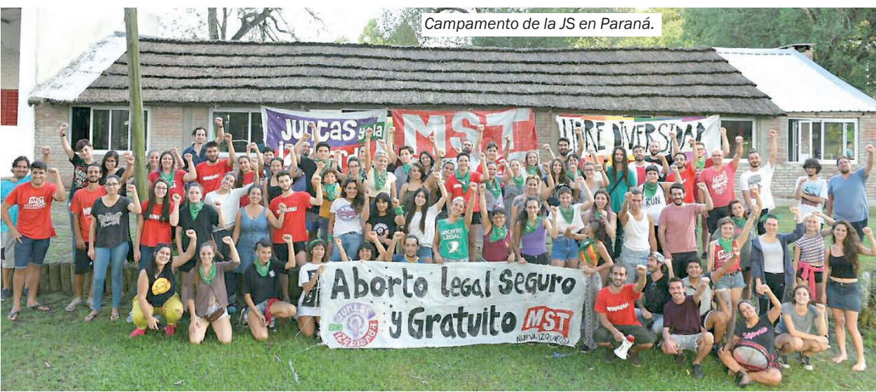
Campamento de la JS en Paraná.