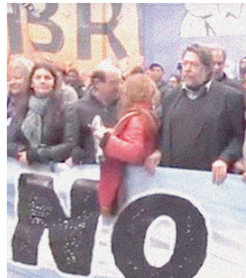
Cabecera de la marcha contra el FMI, el 17 de n

Sin duda la irrupción de la crisis y el regreso del FMI recolocan con fuerza la necesidad de la mayor unidad de acción en la calle contra el plan macrista. La dirigencia sindical que hace la plancha traiciona esta lucha. Los que convocan medidas aisladas no están a la altura de lo que hace falta. Los que dividen con sectarismo le hacen el juego a este plan siniestro. Hace falta una enorme movilización nacional ahora, y un paro nacional para frenar y derrotar todo el plan de Macri y el FMI, incluyendo el tarifazo y el miserable techo salarial. La marcha contra el FMI a Plaza de Mayo que hicimos en unidad la semana pasada fue un buen paso. Pero hace falta mucho más. La Marcha Federal que el 1º de junio llega a la Capital, puede