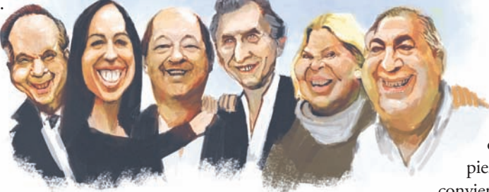
ILUSTRACIÓN: GUILLERMO COPPO

Necesitan apoyo político para avanzar con un ajuste que ya no puede esperar. Entonces convocaron a la mesa política de Cambiemos que tenían relegada, dándole espacio al radicalismo y la Coalición Cívica. Y convocan al PJ a negociar el Presupuesto 2019 y el ajuste.