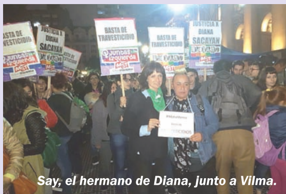
Say, el hermano de Diana, junto a Vilma.

El 17 de mayo, día mundial contra el homo-lesbo-trans-odio, organizamos besazos disidentes ante las catedrales de San Juan y Paraná, la Universidad de José C. Paz y otros lugares del país.