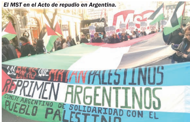
El MST en el Acto de repudio en Argentina.

La realidad demostró que la naturaleza del estado gendarme no permite ninguna negociación ni convivencia pacífica. Su objetivo es aplastar la resistencia palestina,