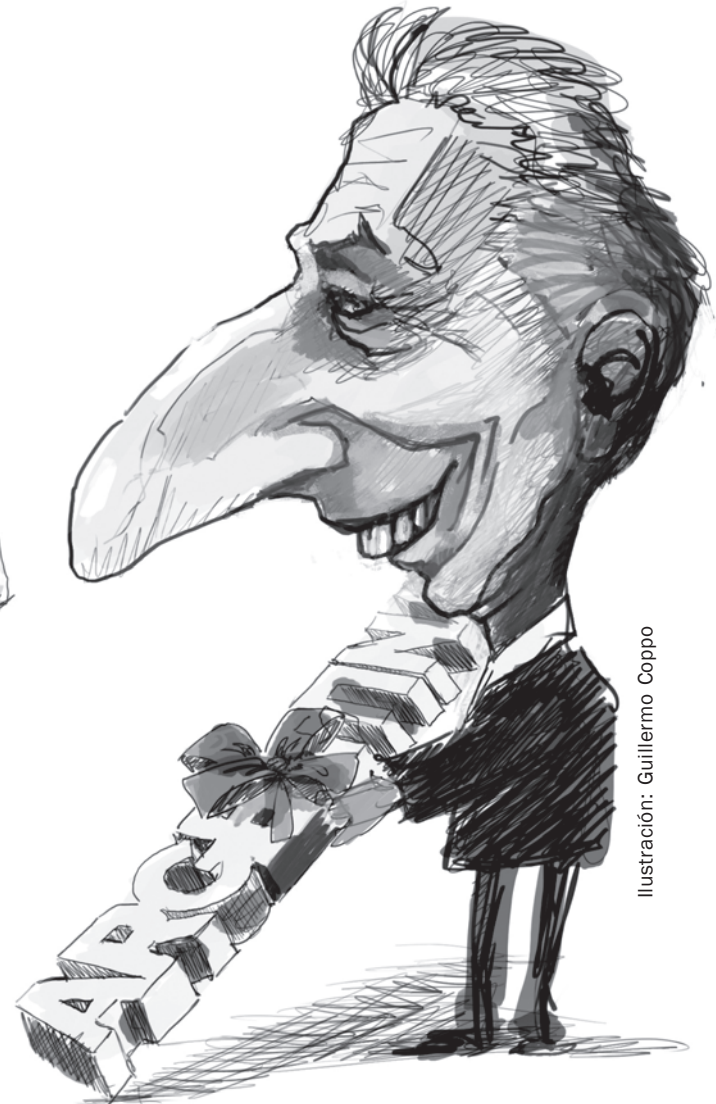
Ilustración: Guillermo Coppo

capital especulativo) se agotó por completo en 2 años. Fracásó porque no pudo cumplir con la meta esencial que era aplicar un ajuste