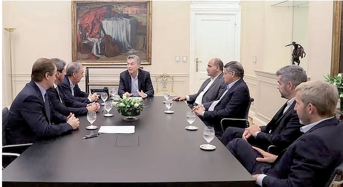
Macri transando con los gobernadores.

• Recesión y estancamiento: Pasándose por alto la recesión que atravesamos, prevén un crecimiento de apenas el 2% (ojo que esto incluye la previsión que las exportaciones, gracias al dólar a $ 30 y a la