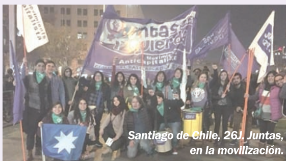
Santiago de Chile, 26J, Juntas, en la movilización.

El 8A, como parte de la campaña que impulsa nuestra corriente política internacional Anticapitalistas en Red, en varios países de Latinoamérica y de Europa habrá acciones feministas unitarias frente a las respectivas embajadas argentinas en apoyo a nuestra lucha por el aborto legal.