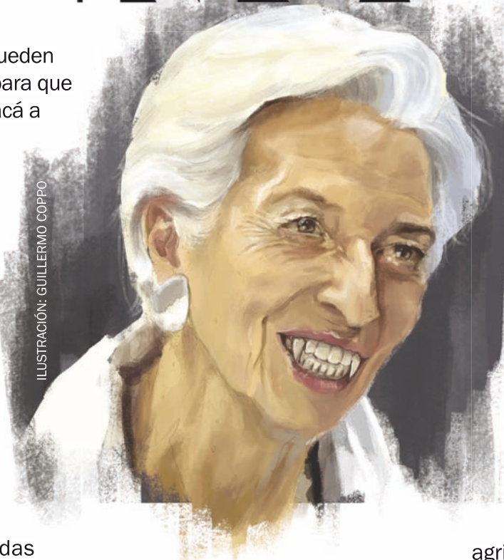
ILUSTRACIÓN: GUILLERMO COPPO

Pero sobretodo lo que necesitamos, para barrer a los entregadores y sus planes y no volver al pasado, es construir una fuerza política que este de nuestro lado y pelee consecuentemente por estos puntos, sumate al MST Nueva Izquierda y demos juntas esa batalla.