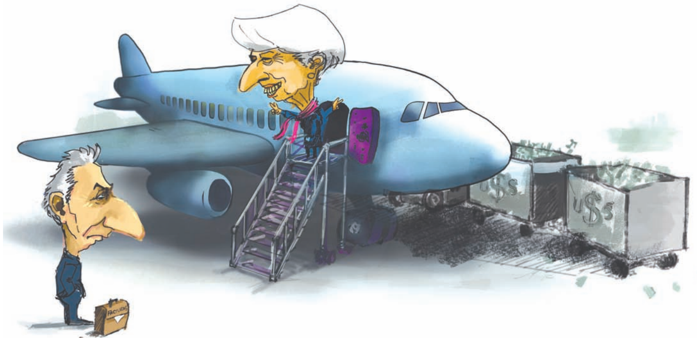
ILUSTRACIÓN: GUILLERMO COPPO