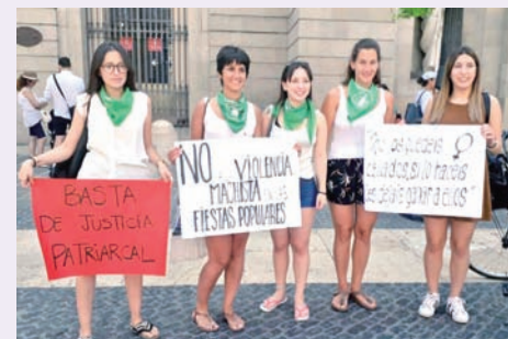
Barcelona, 7J. Juntas, preparando el 8A.

En el Estado español, nuestras compañeras de Juntas y a la Izquierda-SOL (Socialismo y Libertad) integran el colectivo Marea Verde Barcelona y activan en unidad con la Comisión Santiago Maldonado. El 1A hacen una marcha por la Rambla, que finaliza con pañuelazo. El 8A a las 12.30 van al consulado argentino, a las 20 concentran ante la Generalitat -sede del gobierno catalán- y desde las 21 prevén una vigilia para seguir la sesión.