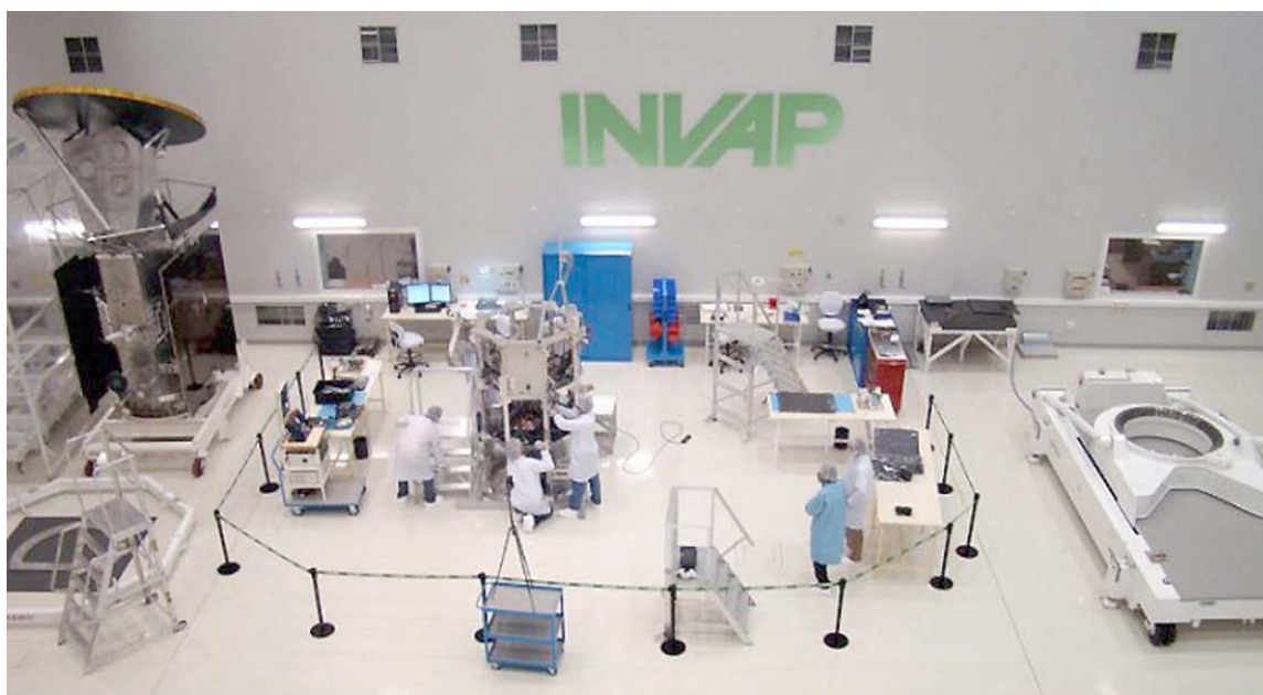
Macri en INVAP anunció recortes. Después tuvo que retroceder

modelo social alternativo, sin FMI, sin negocios capitalistas y sin depredación ambiental. Nuestra apuesta es a una transición que reconvierta la matriz tecnológica a partir de una deliberación democrática y social con el excluyente protagonismo de lxs trabajadorxs y profesionales del sector: de INVAP, de CNEA, de Atucha. Ese es nuestro punto de vista: de clase y ecosocialista.