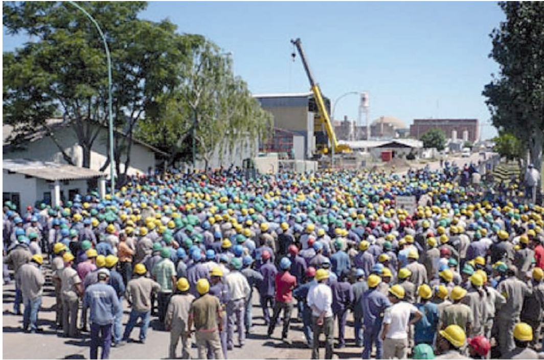
Asamblea obrera en Atucha

ma laboral de precarización superior al 50 %. Por lo tanto, el macrismo encontró una estructura de desarrollo tecnológico desarticulada, dividida en nichos y un plantel laboral en estado de precariedad, junto a burocracias sindicales asociadas al manejo de fondos y otras inmovilizadas por un rutinarismo conservador y cortoplacista.