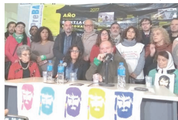
Conferencia de prensa

El 1° de agosto, en la Plaza de Mayo, hacemos un festival y acto unitario el EMVJ y la Mesa de los organismos de derechos humanos vinculados al gobierno anterior. Las consignas convocantes son: Santiago es solidaridad y el