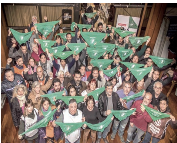
La Multicolor une a la izquierda sindical: ANCLA/MST, CSC/PO, Rompiendo Cadenas, IS, MAC/PTS,

Nuestra corriente sindical ANCLA y sus agrupaciones Alternativa Docente, Alternativa Estatal, Alternativa Salud, Alternativa Universitaria y Alternativa Telefónica, es uno de los dos pilares nacionales en los que se asienta la Lista 6 Multicolor, con centenares de candidatxs en todo el país. Además de nuestro importante rol en la lista nacional, nuestra corriente sindical también encabeza las listas de la provincia de Córdoba, Entre Ríos, Mendoza, San Juan y Santiago del Estero. Y vamos con la Secretaría General Adjunta en las provincias de Santa Fe, Tucumán, Santa Cruz, Salta y Jujuy. Directivos y delegados que vienen dando pelea en la CTA Autónoma de los gremios docentes, estatales de ATE, CICOP, FeSPoSa y otrxs trabajadores de la salud, judiciales, municipales, docentes universitarixs, gremios privados de la CTA (telefónicos, conductores, vigiladores, etc.) y referentes territoriales del MST Teresa Vive van como candidatxs por nuestra corriente.