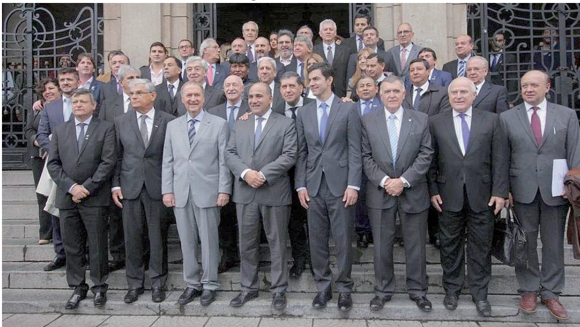
Cumbre de gobernadores del PJ en Tucumán.

Este es el verdadero rol que ha venido cumpliendo el PJ-FPV desde el comienzo del gobierno de Macri: Hace declaraciones altisonantes en contra de las medidas de ajuste, pero después termina votándole las leyes que necesita para aplicarlo, como pasó con la Reforma Previsional últimamente. Sólo que ahora la situación es mucho más grave, por la magnitud del ajuste y por estar al servicio del FMI que es odiado por la inmensa mayoría de la población, lo que les hace presuponer que tendrá efectos directos en los votos del año próximo. Esa es la razón por la que hoy se muestran como más combativos y opositores, pero seguramente volverán a traicionar con su voto. La única manera de lograr que no pase el Presupuesto y todo este plan de ajuste es con la movilización de los trabajadores y el pueblo, mediante un plan de lucha con medidas progresivas hasta lograr derrotarlo.