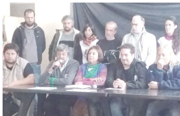
Conferencia de prensa en el SUTNA.

proyecto de presupuesto de ajuste y reclamando un paro nacional de 36 hs activo y que continúe con un plan de lucha. Barajar una fecha cercana al tratamiento del presupuesto para su realización con el mayor arco unitario alcanzado.