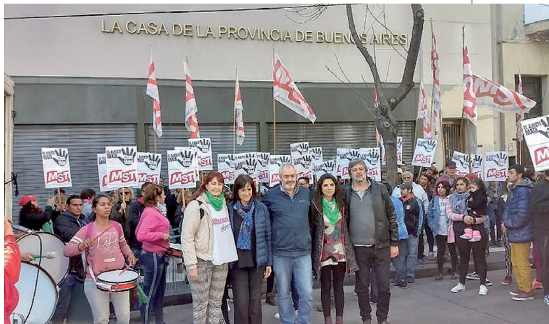
CABA, 27A. Protesta contra Vidal y su ajuste, ante la Casa de la Provincia.

Nosotros no apoyamos y denunciamos los ataques persecutorios de