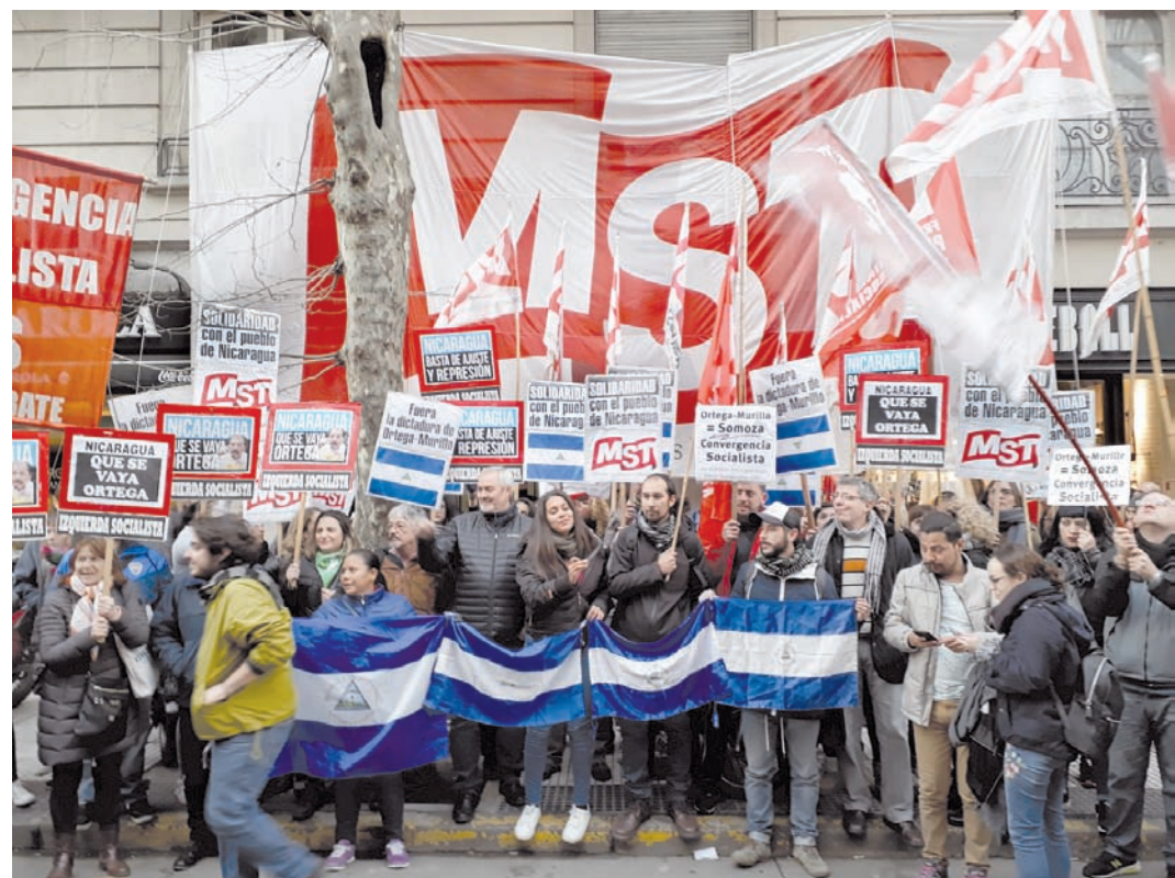
CABA, 24A. Protesta ante la embajada de Nicaragua.

Se creyeron que si conciliaban con el imperialismo y la gran burguesía, éstos los iban a incorporar al statu quo . Poco después, cuando habían desmovilizado y desarmado al pueblo, el imperialismo les pagó como lo hace siempre: les armaron