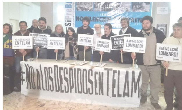
Solidaridad con Telam.