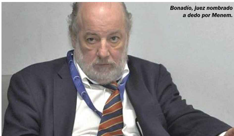
Bonadío, juez nombrado a dedo por Menem.

con intereses de “opositores” como Picheto, que pretenden rearmar una alternativa peronista pero que saben que corren serios riesgos de perder una interna contra Cristina.