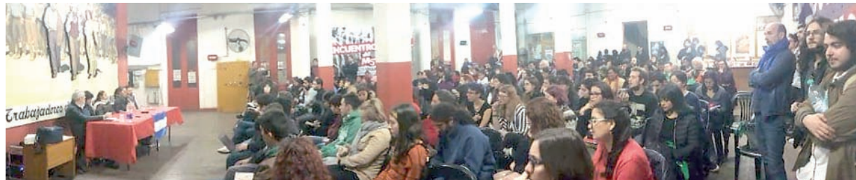
CABA, 22A. Charla con los referentes de la Caravana, en el local del MST.

No es sólo la lucha de los compañeros: es nuestra lucha también. Nosotros construimos una organización internacionalista porque el mundo es uno solo, los intereses son los mismos. Hemos pasado por dictaduras, y muchos compañeros se salvaron la vida por una campaña internacional. Sabemos que a veces lo que te salva es saber que hay gente que pelea por vos en otro lado. Los poderosos se juntan para jodernos siempre, lo que nos salva es la solidaridad internacional.