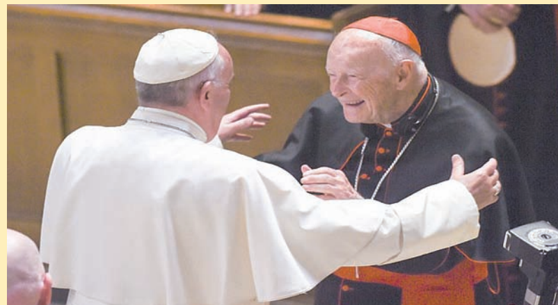
Francisco y el abusador McCarrick, al que encubrió.

Y para esos delitos sexuales, la Iglesia pretende impunidad. El proyecto macrista de ley de «libertad