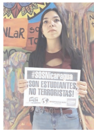
Universidad Nacional de La Rioja

Ver todas las fotos en www.anticapitalistasenred.org