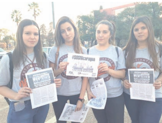
Universidad Nacional de Córdoba

macrista estas últimas semanas; y vamos a continuar la campaña, hasta que Ortega y Murillo se vayan y el pueblo nica conquiste la Nicaragua libre, democrática y socialista por la que viene luchando.