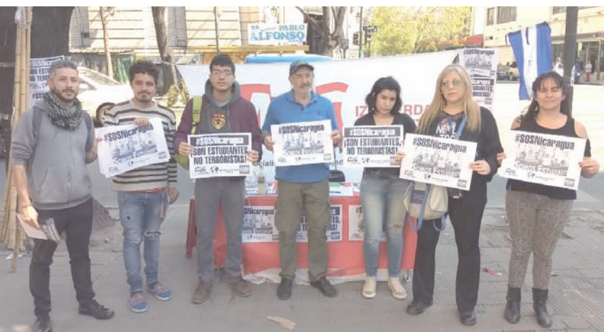
Universidad Nacional de La Plata