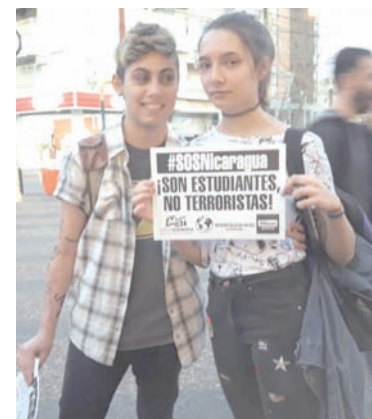
Universidad Nacional de La Pampa