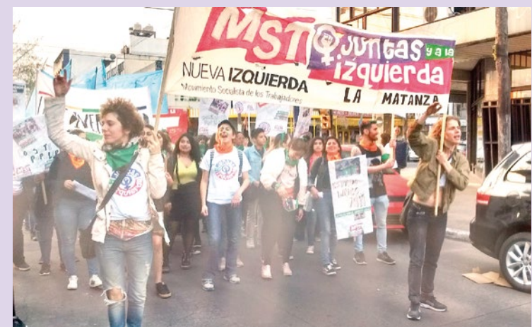
La Matanza, 8S. Juntas, en el 21º Encuentro Regional de mujeres, lesbianas y trans.