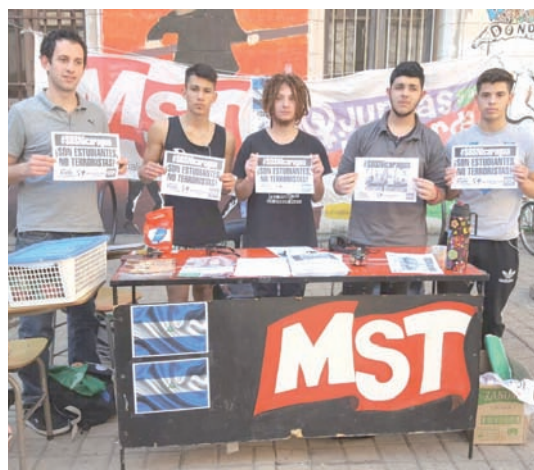
Universidad Nacional de Rosario