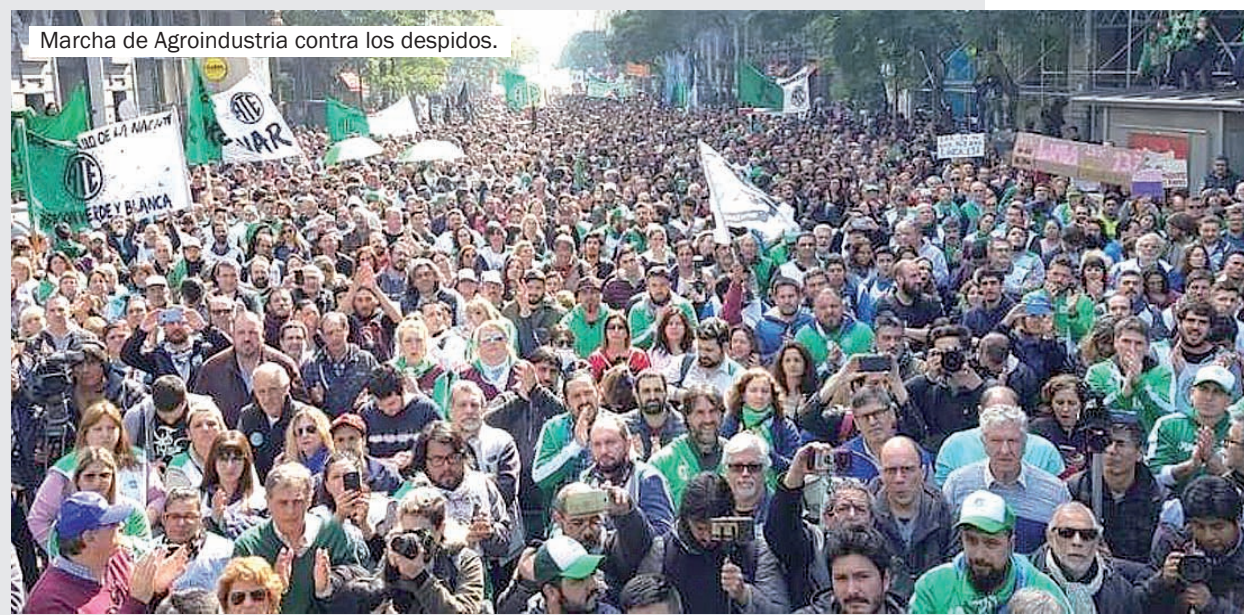
Marcha de Agroindustria contra los despidos.

Todos coinciden que el dólar a $ 40 está sobrevaluado un 30%, lo que quiere decir no sólo que hay desconfianza en los grandes compradores sino que todo nos saldrá al pueblo,