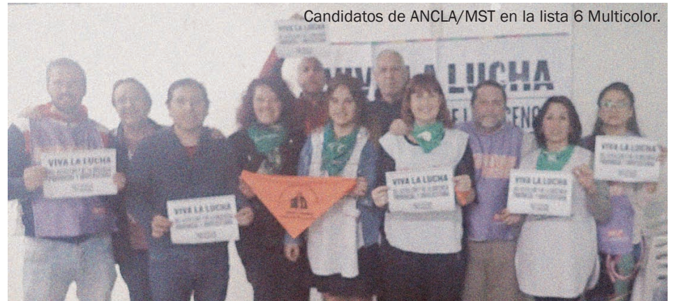
Candidatos de ANCLA/MST en la lista 6 Multicolor.

Pudimos explicar que la dirigencia de los tres sectores tienen responsabilidad en vaciar y paralizar la Central,