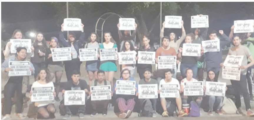
Universidad Nacional de Entre Ríos