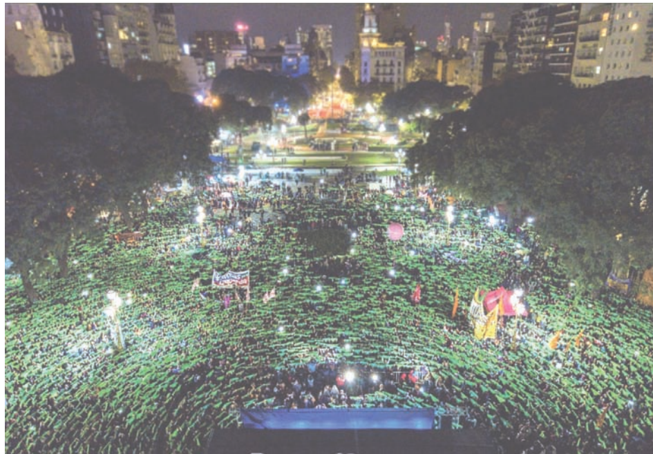
Juntas y el MST, parte activa de la marea verde.

Además, en el balance del 8A la propia Campaña afirma que “logramos la despenalización social del aborto”, que “en las calles el aborto ya sea ley” y que “representa a la mayoría de la población del país” 2 . Coincidimos. Si la mayoría está a favor, ¿entonces por qué no consultarla? ¿Por qué esperar hasta 2020 en vez de hacer una consulta popular ahora para que todo el país debata y vote sí o no a la ley que ya aprobó Diputados? ¿Por qué articulación considera válida la opinión institucional del Senado, una cámara retrógrada por naturaleza, pero no la opinión democrática de las mujeres y todo el pueblo?