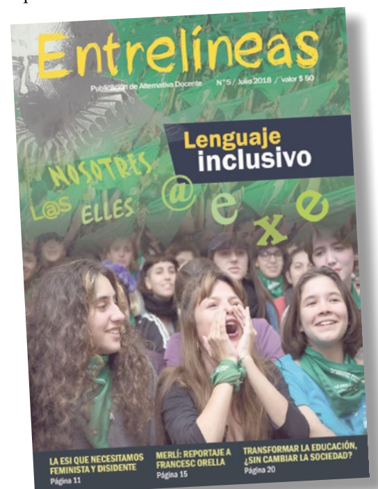
Salió la revista Entrelíneas 5: pedila a quien te acerca este periódico, valor $50

Para definir contenidos y actualizar los lineamientos, el gobierno y el Congreso deben dejar de consultar a la Iglesia Católica y demás religiones para que opinemos y decidamos los protagonistas de la educación: estudiantes, docentes, feministas y la comunidad. Hay que terminar con la hipocresía de la Iglesia, que sin ponerse colorada vive de la plata del Estado, o sea de todes, pero a la hora de aplicar las leyes dice "estos chicos son míos" y "estos colegios son míos y hago lo que quiero". Hay que anular todos los subsidios que recibe y que esa plata vaya a una real implementación de la ESI y su diseño democrático. Separar Iglesia y Estado es vital para avanzar en materia de derechos. Estas y otras ideas, y generar espacios de debate, pueden aportar a esta nueva ESI, democrática, laica, científica, feminista y disidente que necesitamos.