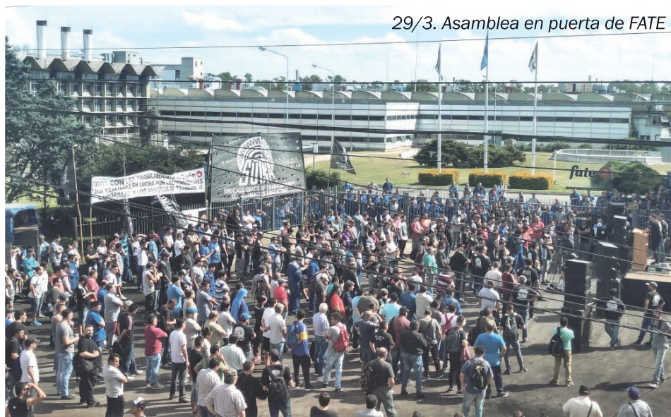
29/3. Asamblea en puerta de FATE

En vez de acciones aisladas se propició unirnos con otros trabajadores en lucha y