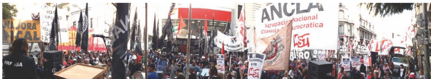
28/3. 12 hs frente a la Sec. de Trabajo

Rosario: elección de delegados en La Virginia