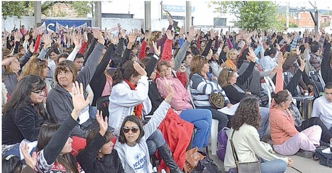
Asamblea de la docencia autoconvocada de Salta.

No nos inmovilizan las sirenas del posibilismo que se contenta con reformas parciales, mayor visibilidad, tener voz y ser consultadas porque es «políti-