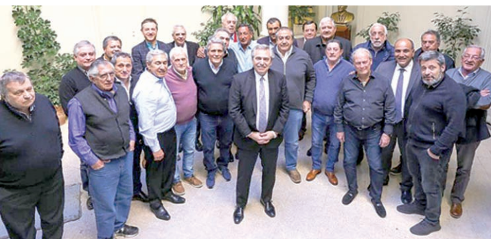
Alberto Fernández con la burocracia sindical.

Y preparándonos para los próximos combates. Impulsando la mayor unidad de acción y embretando a esta dirigencia que en tiempos electorales se llena la boca contra la reforma pero que rápidamente van a volver a transar alegremente en el backstage de la Rosada. Pero al mismo tiempo dando pasos en la renovación sindical, por una nueva dirección y un modelo democrático, combativo y con perspectiva de género.