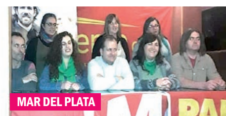
MAR DEL PLATA