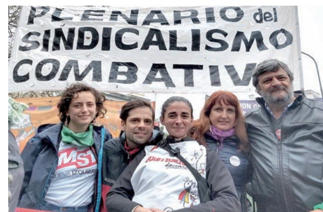
El sindicalismo combativo en la listas del FIT-Unidad.