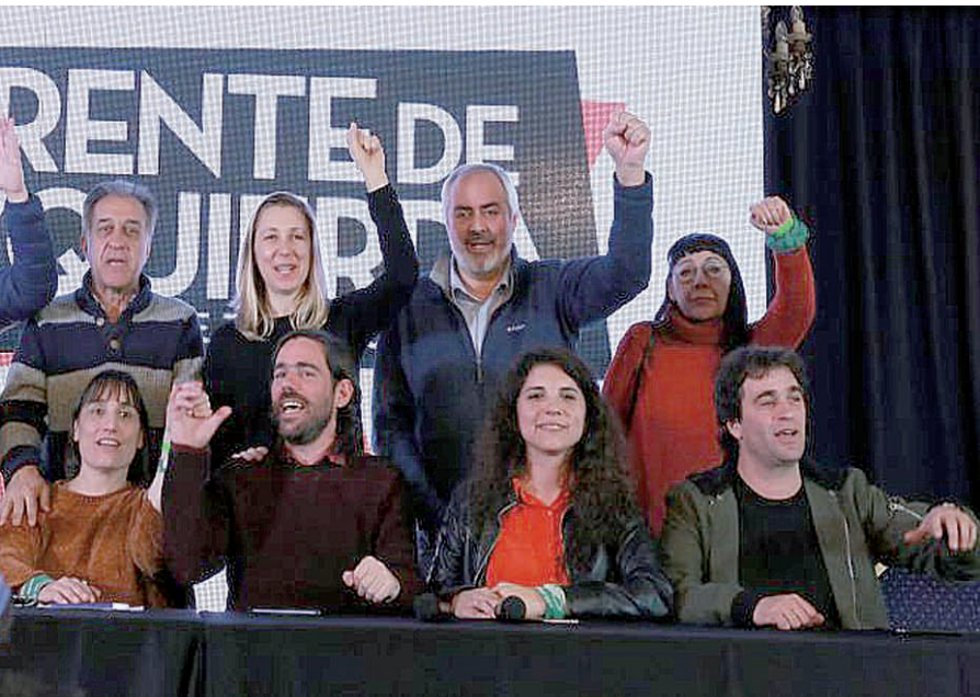
Conferencia de prensa posterior a las PASO.

frente. Una política equivocada que ahora continúa expresando un balance engañoso para intentar demostrar que todo está mal, lo cual de conjunto muestra un modelo de vieja izquierda que así, no aporta nada positivo.