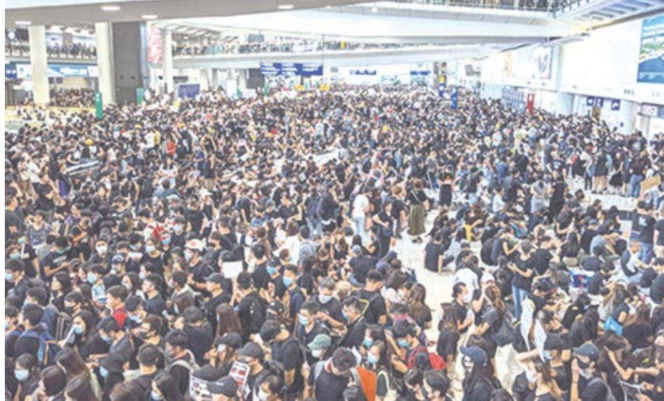
Ocupación del aeropuerto internacional de Hong Kong

Estos recortes a las libertades democráticas, junto a las penurias económicas del descargo de la crisis económica —profundizada por la guerra comercial entre China y Estados Unidos— sobre los trabajadores, se han acumulado para desatar el presente estallido.