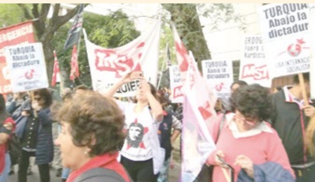
El MST y la LIS, en un acto en solidaridad con el pueblo kurdo y contra el dictador Erdogan, el lunes 26 ante la embajada turca en Buenos Aires.