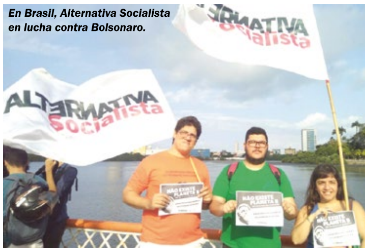
En Brasil, Alternativa Socialista en lucha contra Bolsonaro.

se lamentan por la catástrofe y otras frases de compromiso. Son contaminadores, depredadores del ecosistema, responsables del desastre.