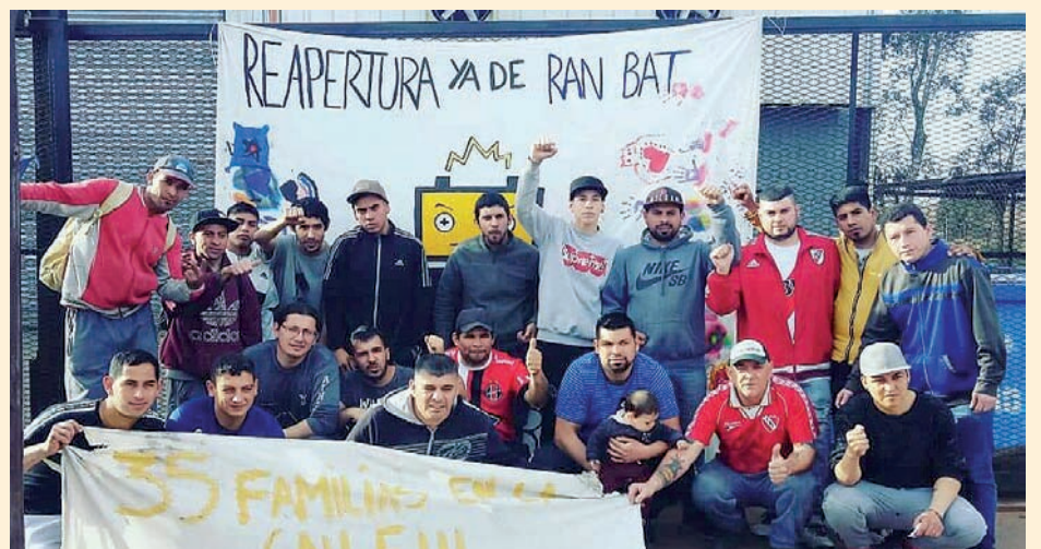
Trabajadores de Ran Bat en lucha

El 27, luego de 22 días de lucha, acampe y movilización, ante Trabajo la patronal se comprometió a reincorporar a todos los trabajadores, pasar a planta a todos los contratados y el Ministerio mandará una inspección de salubridad. Es un triunfo de la lucha, la unidad y la gran solidaridad recibida. Volvemos al trabajo fortalecidos y con la guardia alta.