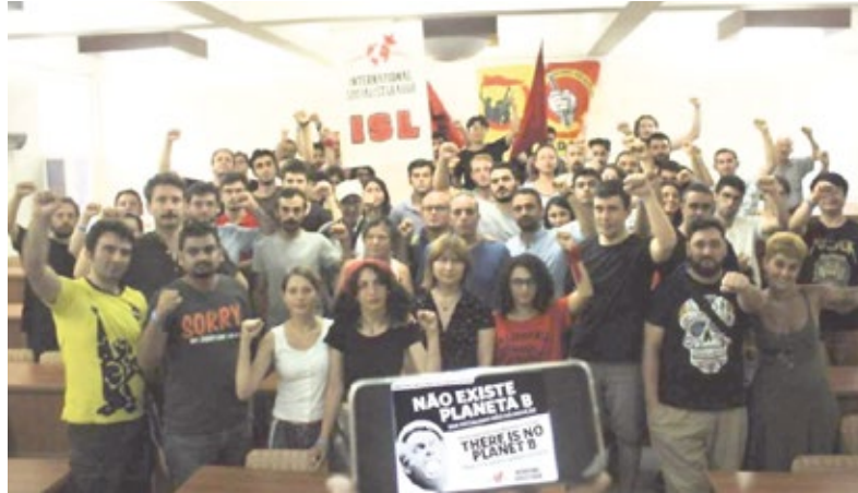
Campamento del SEP y la LIS en Turquía, solidario con la Amazonía.