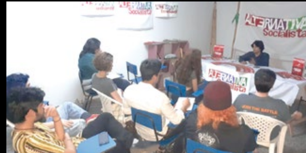
En Asunción, compañeros de Alternativa Socialista de Paraguay presentaron el sábado 24 la revista Revolución Permanente de la LIS.