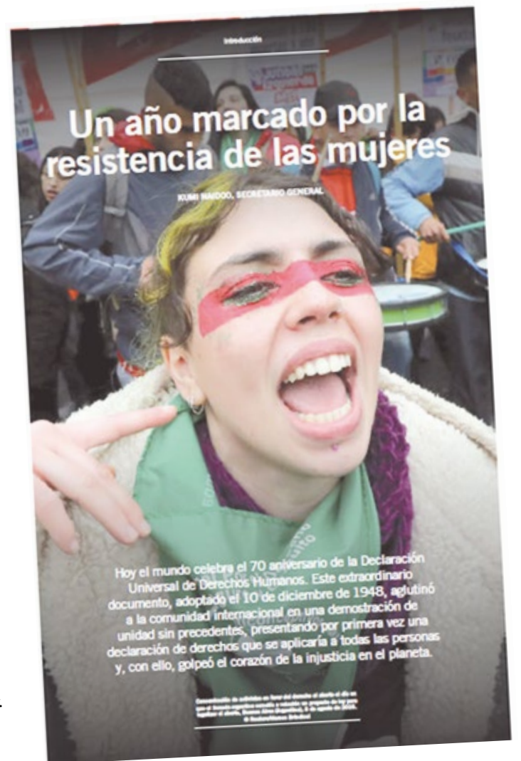
Informe 2019 de Amnesty International, ilustrado con nuestra lucha.