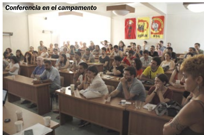
Conferencia en el campamento

La clausura del Campamento no podía ser mejor: marchamos a un acampe en una región de montaña, no lejos de las históricas ruinas de Troya, para apoyar la lucha contra un proyecto megaminero en la región que impulsa Erdogan asociado a un holding de corporaciones canadienses, de la familia de la Barrick y Peter Munk. Nos movilizamos y participamos de un acto muy sentido en las puertas de ese emprendimiento. Emociona la unidad internacionalista en defensa de nuestros bienes comunes. Como síntesis, nos llevamos una experiencia muy estimulante de politización internacional, solidificamos lazos, construimos un evento de formación de cuadros para la revolución con balance positivo, y nos preparamos para un intenso cronograma que se viene para la LIS y que, en particular, tendrá como desafío para la juventud la realización del Campamento Internacional 2020 en Argentina. Será para todas las secciones de nuestra internacional una gran tarea a encarar y en especial, para el MST, sección anfitriona una movilizante responsabilidad que desde ahora nos vamos a abocar a planificar. En suma: internacionalismo militante, práctico, para la acción y una juventud que se prepara para efectivamente, dar vuelta todo.