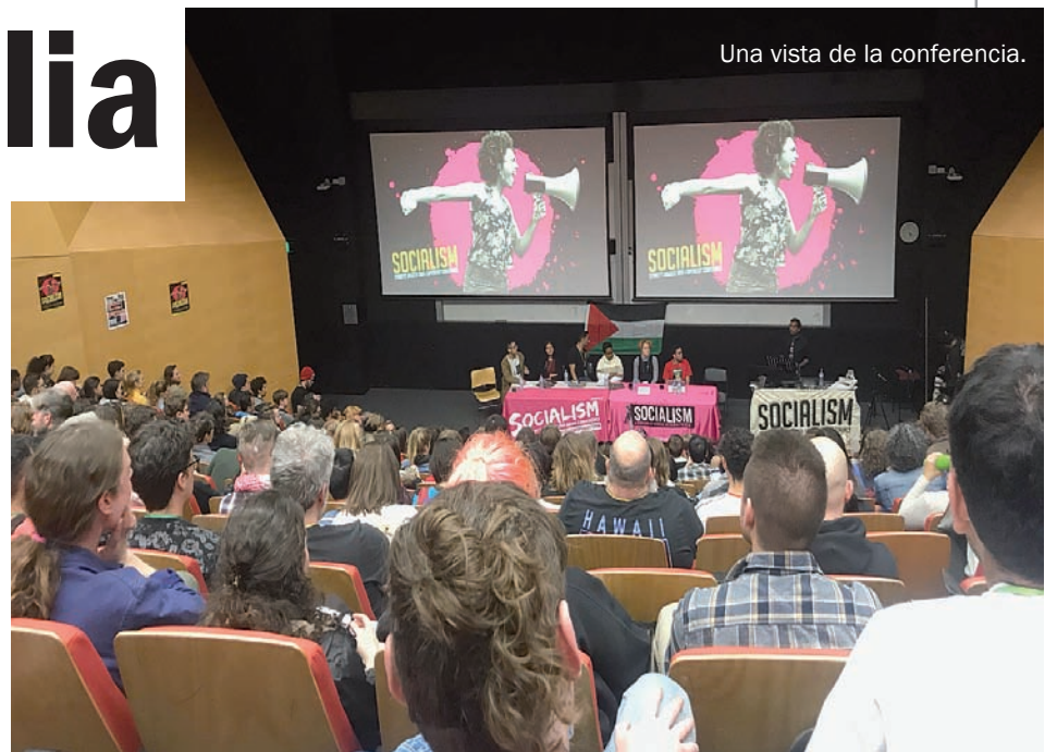
Una vista de la conferencia.

Australia ocupa un lugar clave en la región del pacífico. Desde sus orígenes fue un enclave para el avance del colonialismo y el imperialismo, primero británico y luego de Estados Unidos. Formalmente es una Monarquía parlamentaria con la reina Isabel II de Inglaterra como soberana. Aunque la alianza política y militar fundamental es con Norteamérica, que tiene importantes bases militares en su territorio. Allí la creciente tensión entre EEUU y China se ha transformado en un debate central de la política nacional, y fue uno de los temas clave de la conferencia. Si sus vínculos históricos con el imperialismo yanqui marcan el alineamiento de la burguesía australiana con EEUU, su economía se ha vuelto crecientemente dependiente de las exportaciones a China. Éstas, constituidas fundamentalmente por carbón y la venta de servicios educativos, representan el 40% de los