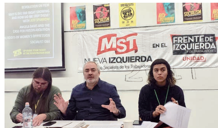
Bodart en uno de los paneles.

A pesar de provenir de diferentes tradiciones, tenemos conclusiones