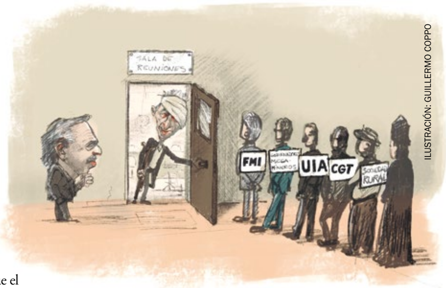
ILUSTRACIÓN: GUILLERMO COPPO

Mientras tanto, el ajuste. Luego de un vergonzoso silencio de la mayor parte de las centrales sindicales, finalmente el pasado 10 se llevó a cabo el paro nacional de ATE, pero lejos de proponerse como el puntapié inicial de un plan de lucha que permita recuperar al menos una porción de lo que nos arrancaron a los trabajadores en este tiempo, tuvo sabor a “descompresión”. El papel lamentable y subordinado a las fuerzas políticas burguesas del 95% de las conducciones