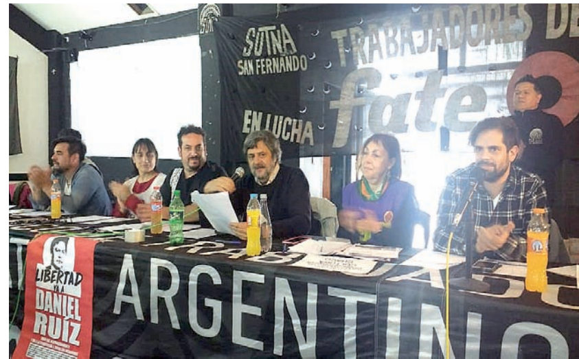
Mesa de reunión en el SUTNA de San Fernando.