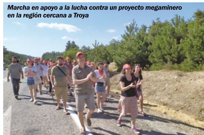
Marcha en apoyo a la lucha contra un proyecto megaminero en la región cercana a Troya