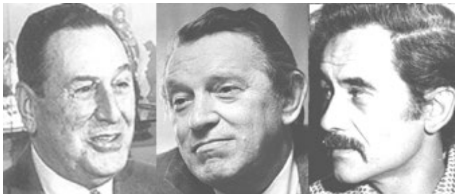
Perón, Gelbard y Rucci

Este intento de colaboración o conciliación de clases tuvo ya trágicos antecedentes en épocas de Perón. Por eso Cristina reivindica a José Ber Gelbard, ministro de Economía de Perón en