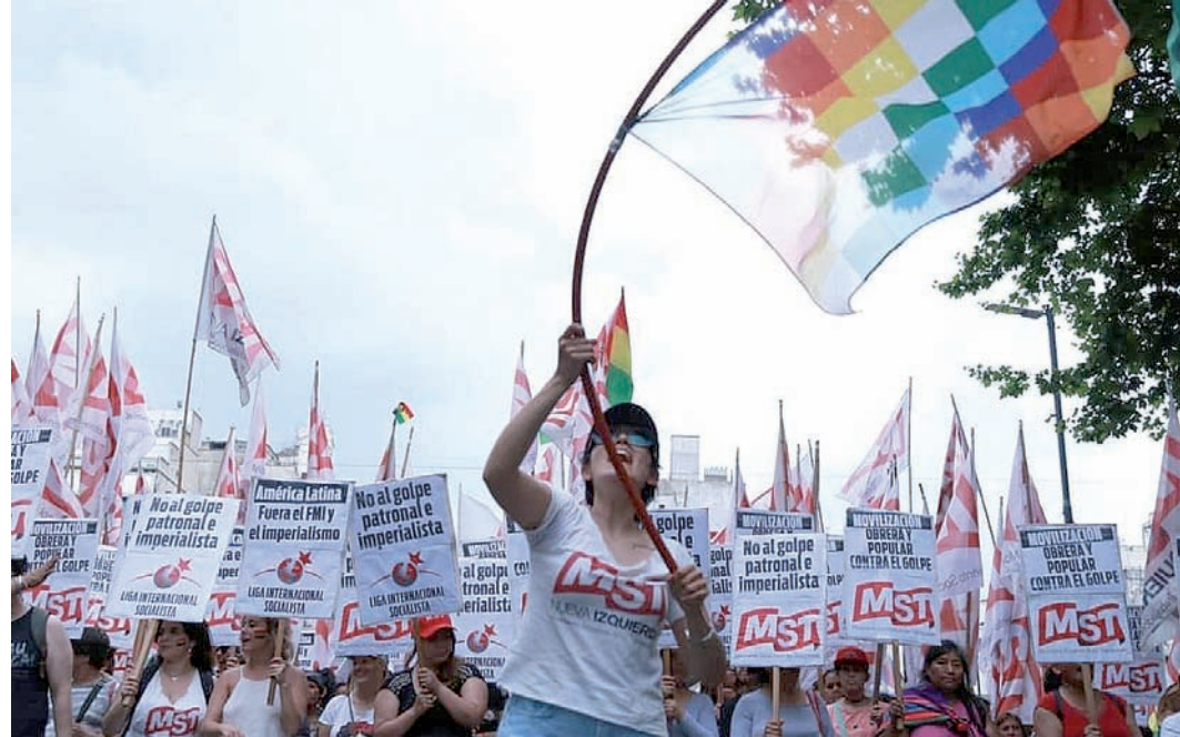
En Argentina, el MST crece y se consolida en la izquierda revolucionaria.

*Tercero, supongamos que la línea de «crecer primero» resulta, y la economía se reactiva y genera recursos, ¿es lo prioritario para una estrategia de