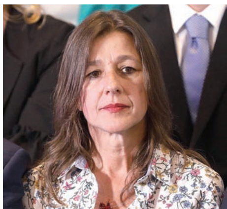
Ministra de Seguridad, Sabina Frederic.

Si esa es la reforma “integral”, no habrá “justicia realmente independiente” que prometió AF. La justicia actual es dependiente, funcional y adicta al poder político porque a los jueces los