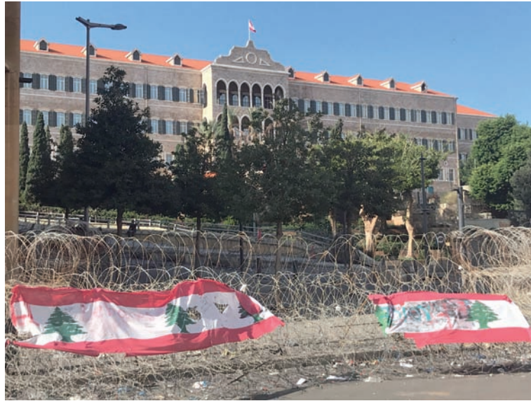
La Casa de Gobierno, rodeada de vallas.

Sin ningún tipo de transporte público, electricidad y agua potable insuficiente para abastecer a la pobla-