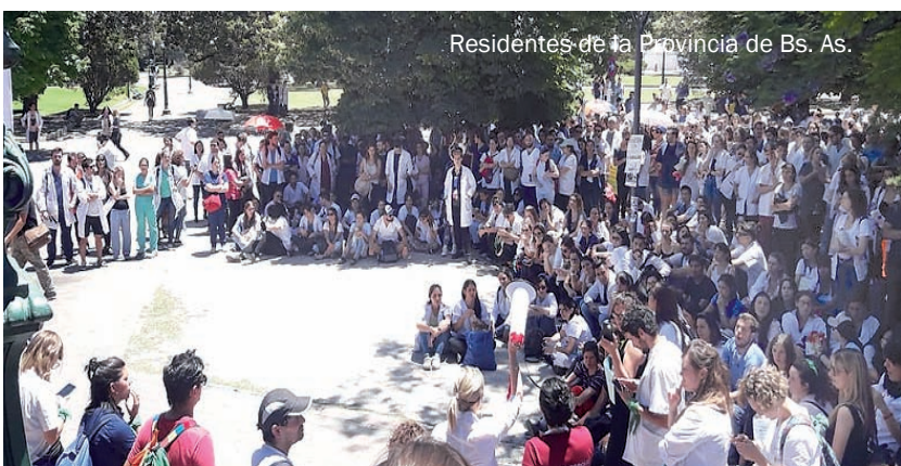
Residentes de la Provincia de Bs. As.

una respuesta política urgente, no nos olvidemos que a la salud pública la hacemos todxs.