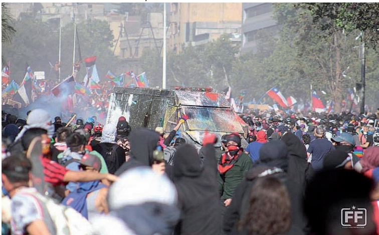
El proceso de revolución en Chile no se detiene.

Y entonces, si la política se traslada del «palacio a las calles» ahí definen otras fuerzas. Claro, depende del rol que asumamos en el campo de la izquierda. Tenemos debates también en este punto, en las páginas centrales se desarrollan. Mientras tanto, el MST no le tiene miedo a remar a contracorriente, a ser minoría temporal. Estamos sembrando influencia, vamos ganando inserción entre lxs trabajadorxs, la juventud y los sectores populares. Hacemos de la sospecha un método, de la independencia política de clase, un principio. Tenemos programa alternativo. Seguimos construyendo y nos preparamos para rápidas aceleraciones de la situación. Esa es nuestra hipótesis. Los de arriba le tienen pánico a «Chile» o «Colombia». Nosotrxs, festejamos esas revoluciones y las miramos como nuestro espejo.