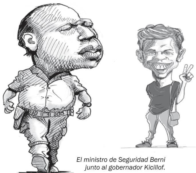
El ministro de Seguridad Berni junto al gobernador Kicillof.