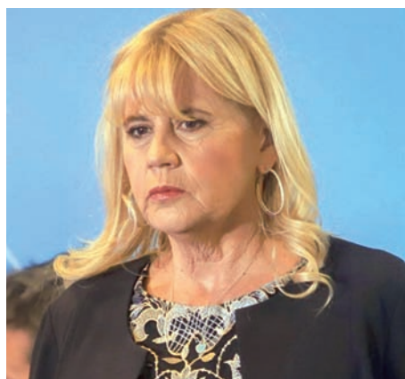
Ministra de Justicia, Marcela Losardo.

Vamos al tema seguridad, siempre polémico. AF anunció: “He decidido intervenir la Agencia Federal de Inteligencia... Dispondré la derogación del Decreto 656 del 2016, que consagró