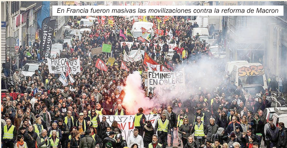
En Francia fueron masivas las movilizaciones contra la reforma de Macron

En general, en el mundo hay tres tipos de sistemas jubilatorios: los sistemas públicos de reparto, los fondos de pensión privados y algunos sistemas mixtos.