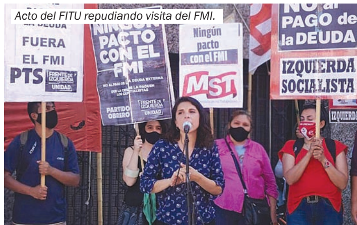
Acto del FITU repudiando visita del FMI.