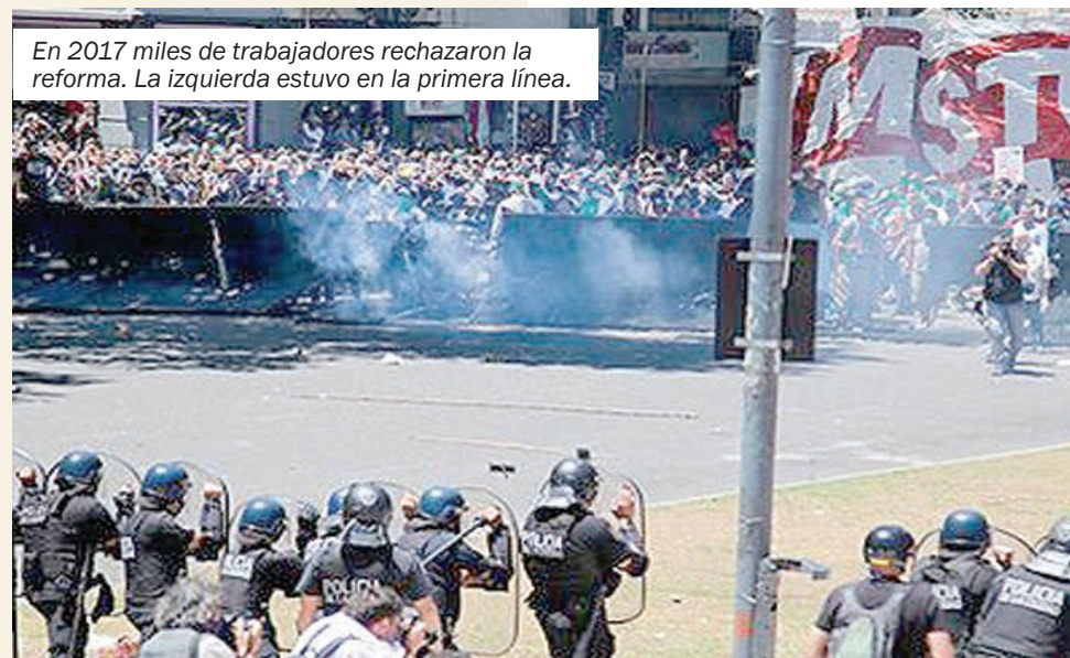
En 2017 miles de trabajadores rechazaron la reforma. La izquierda estuvo en la primera línea.