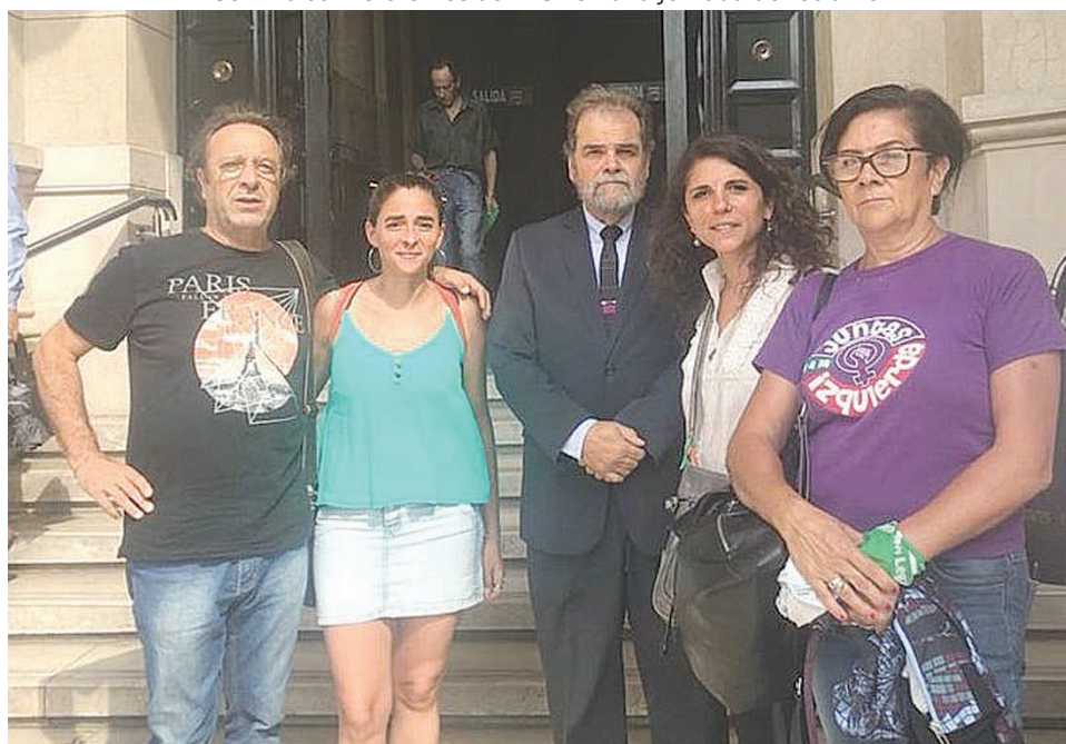
Semino con referentes del MST en una jornada de reclamo.