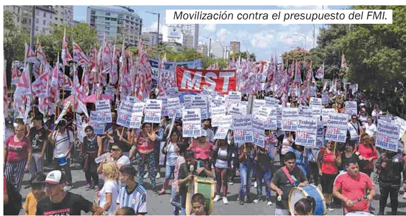
Movilización contra el presupuesto del FMI.

con el Fondo y declarar un No Pago soberano y unilateral de la fraudulenta deuda contraída por Macri y una auditoría del total de la deuda pública