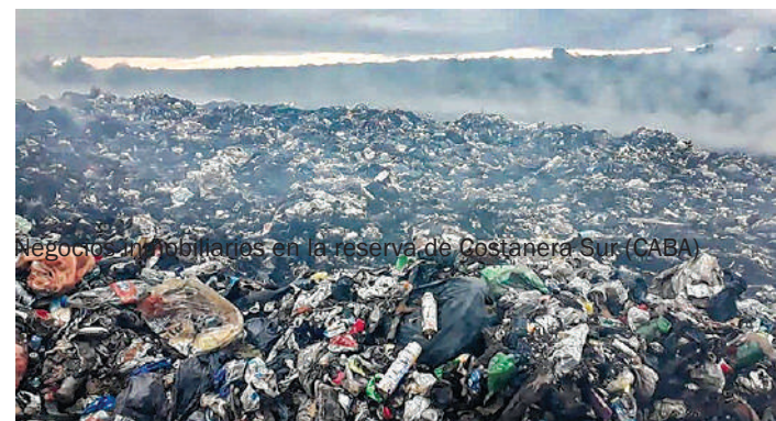
Negocios inmobiliarios en la reserva de Costanera Sur (CABA).