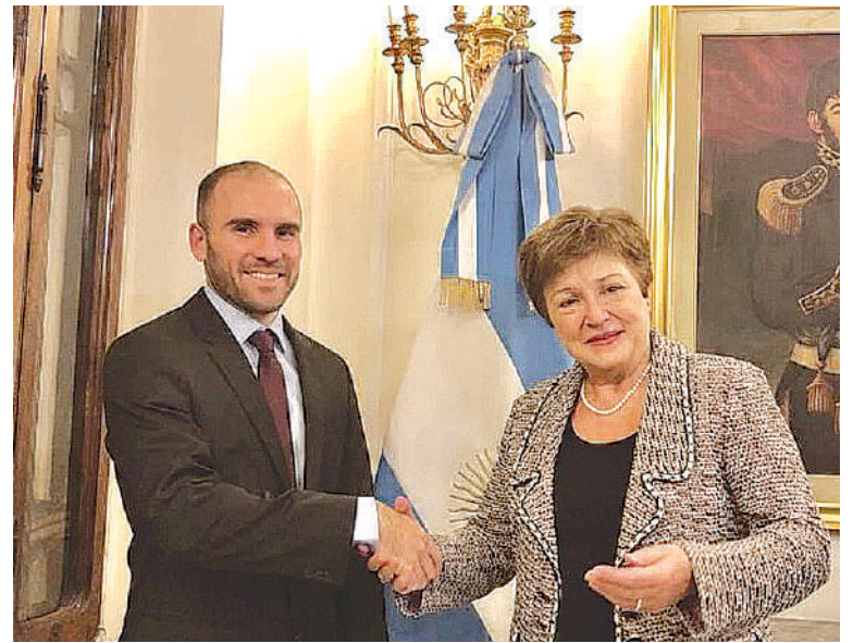
Guzman con el FMI