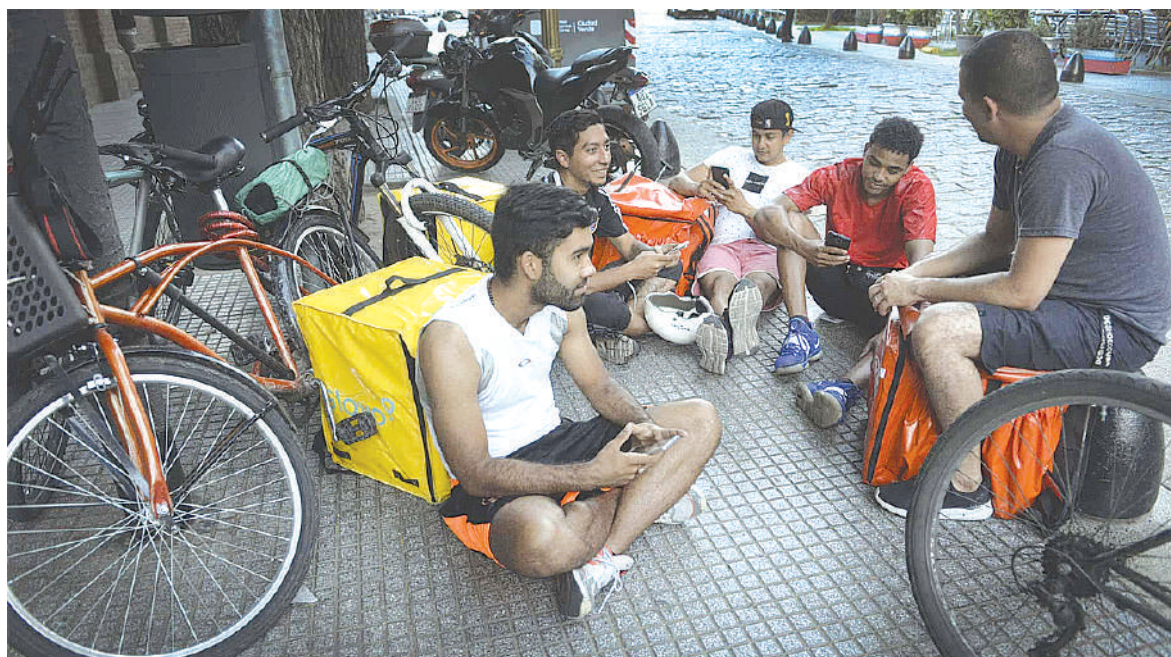
Trabajo precarizado para los jóvenes.

Rúa y, a pesar del supuesto discurso de desendeudamiento de los Kirchner, pagamos con el matrimonio decenas de miles de millones de dólares, incluso al contado y por adelantado al FMI. Entonces, mal que le pese a Cristina digamos que ella no tiene la exclusividad, todos han sido «pagadores seriales» pero, a pesar de ello la deuda creció desde los U$S 53 millones que día Perón, a los más de U$S 240 mil millones que nos dejó el kirchnerismo y ni qué hablar del salto en U$S 82 mil millones de Macri que llevaría la deuda a más de U$S 323 mil millones. Toda o casi toda esa deuda es fraudulenta e ilegal, sea porque se duplicaron los certificados, porque se estatizó deuda privada para que la pagáramos todos, o como decía Alberto en campaña, con razón, porque la usaron los amigos del macrismo para fugarla. Lo cierto es que llegamos al 2020 con la sunción del Frente de Todos, con una deuda inmensa de más de 60 mil millones de dólares con los privados, 44.000 con el FMI y más de 10.000 con el