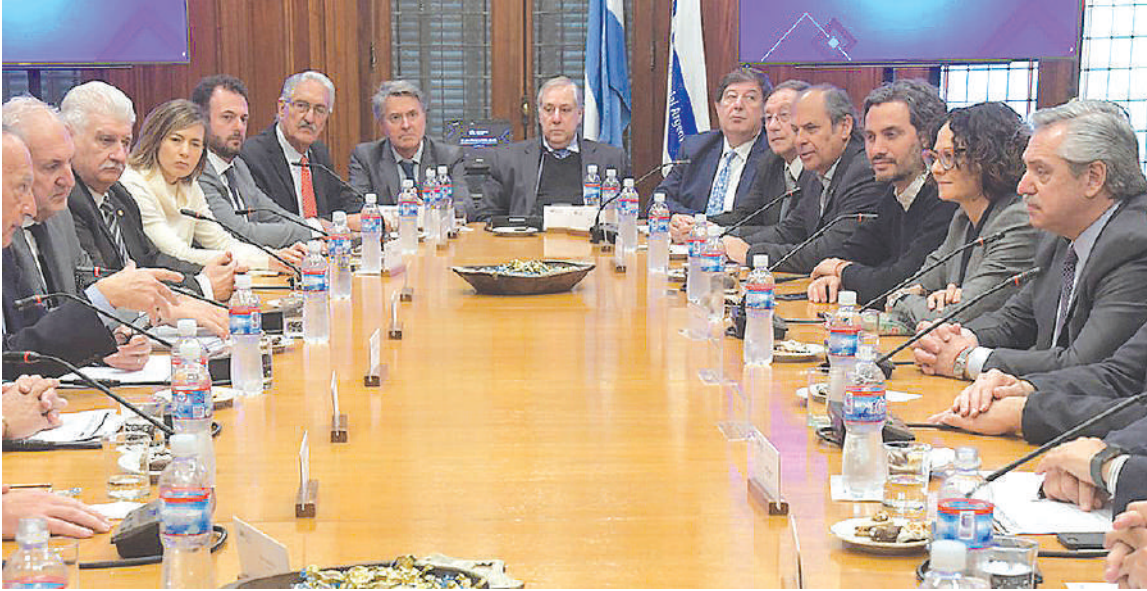
Fernández con la UIA.

Alberto y los suyos nos dicen que la economía está creciendo a niveles prepandemia. Hasta el FMI cambió las previsiones de crecimiento para la Argentina del 5,8 al 6,4% superando la media regional, a la par que hay ingreso récord de dólares por las exportaciones agroalimentarias. Pero la realidad nos muestra que la pobreza e indigencia crecen año tras año, alcanzando ahora a casi el 50% de la población. Son las consecuencias de un modelo capitalista que, con algunos matices se viene aplicando desde hace décadas, siempre al beneficio del imperialismo y las grandes corporaciones.