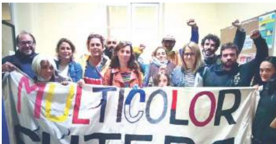
SUTEBA La Plata Multicolor

en Educación, en Trabajo o en el ministerio de Mujeres, Géneros y Diversidad.