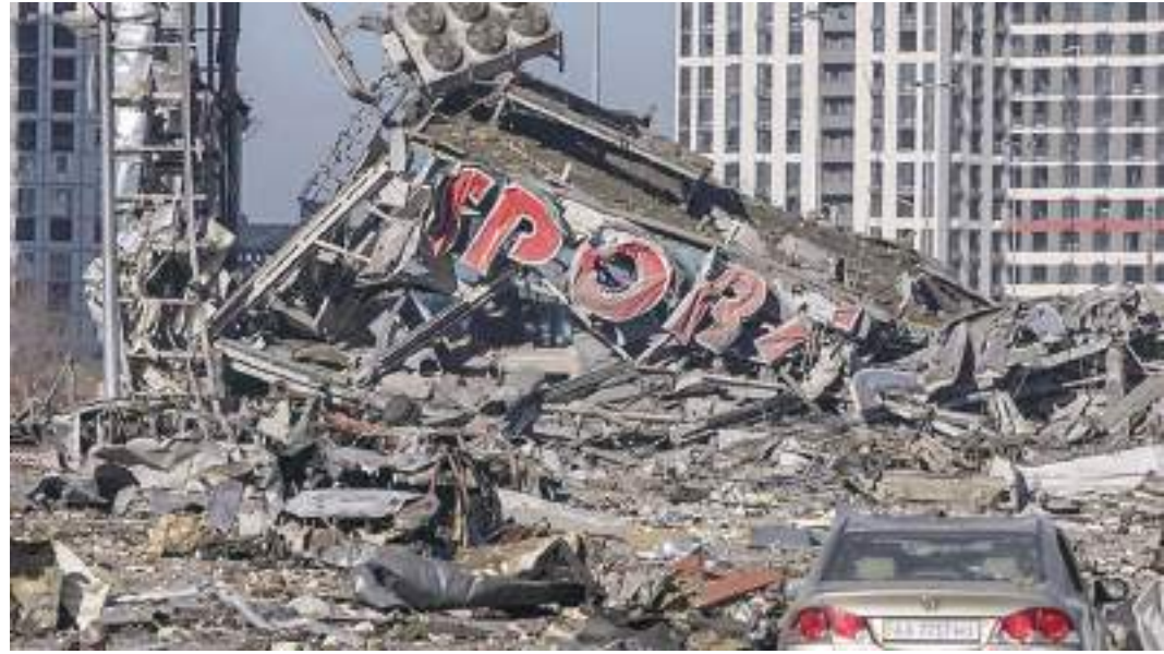
Centro comercial destruido por los bombardeos en Kiev.

La Indian Oil Corporation acaba de adquirir petróleo ruso con un descuento del 25%, además les compra el 60% de su armamento. El imperialismo norteamericano se hace el adalid de las sanciones, pero sigue importando uranio ruso para sus centrales. El presidente argentino, Alberto Fernández, ofreció a Putin tomar su país «como puerta en América Latina» para el comercio. El reaccionario Jair Bolsonaro estrechó la mano de Putin. El primer ministro pakistaní, Imran Jan, fue recibido por el Kremlin, no ha condenado la invasión y enfrenta una moción de censura.