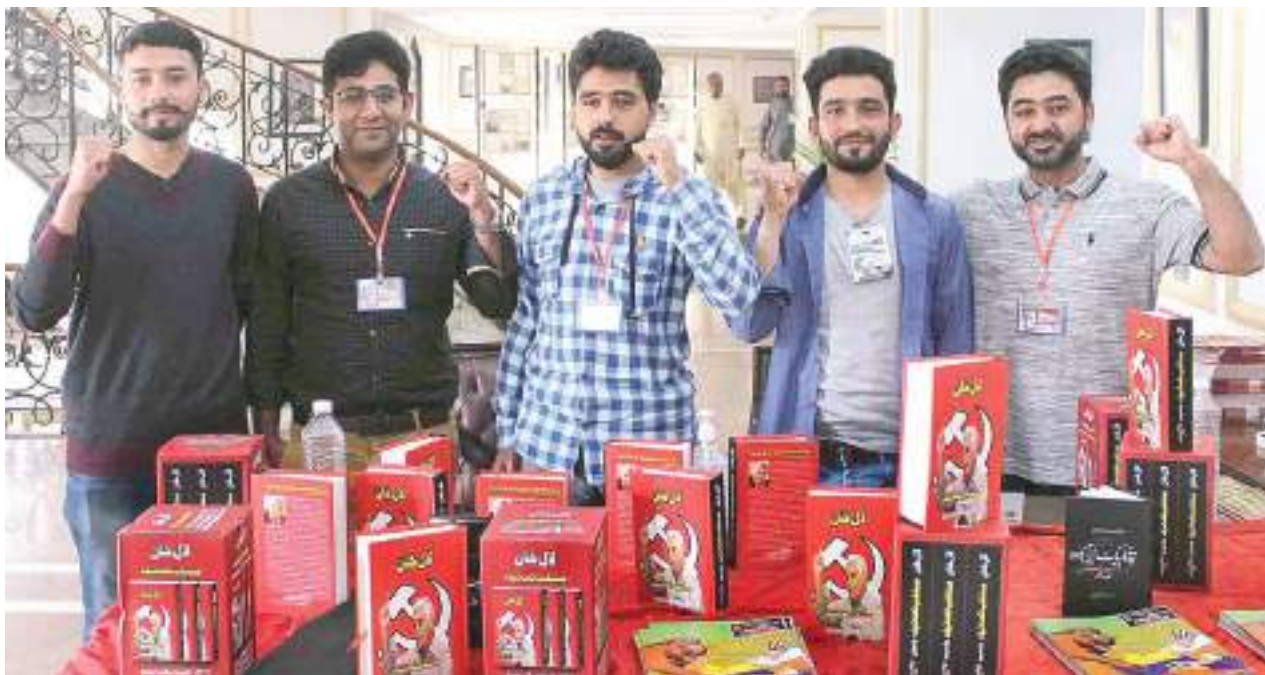
Las recién publicadas Obras Seleccionadas de Lal Khan.

Por otro lado, la crisis política se profundiza, y las medidas implementadas por el FMI no han resuelto las contradicciones fundamentales del capitalismo paquistaní. Entonces la perspectiva en el próximo