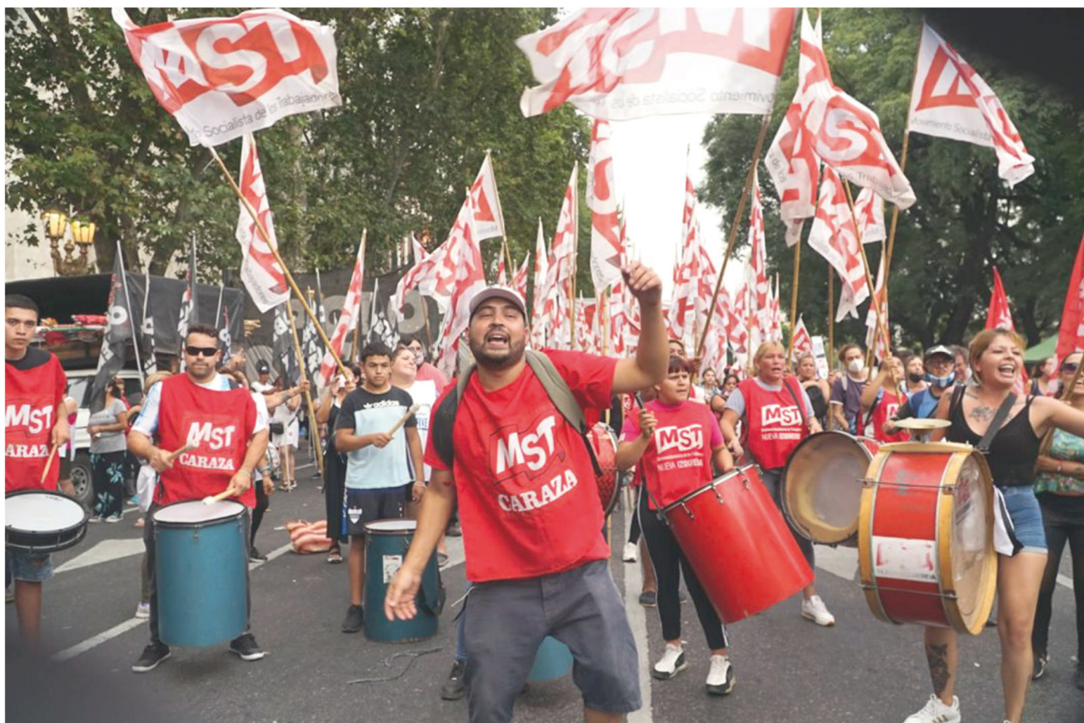
El MST junto al FIT Unidad estuvo en la calle rechazando el pacto

Y a su vez, tenemos que seguir insistiendo en fortalecer la alternativa política para enfrentar a todo el arco político patronal, desde el falso progresismo, como la derecha de Juntos por el Cambio como así también a los libertarios. Y esa alternativa es el Frente de Izquierda y de trabajadores Unidad de la que somos parte y estamos convencidas que hay que ampliarla y así fortalecerla, manteniendo nuestro programa anticapitalista y socialista.