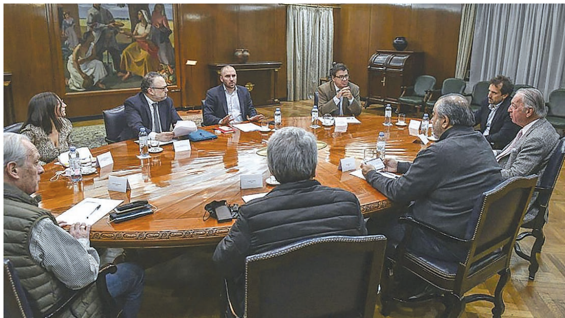
La CGT con el gobierno y la UIA.

La fragilidad y crisis del régimen los aprieta aún más a que no hagan nada