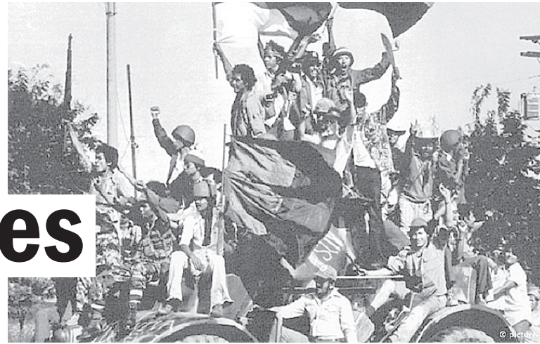
El pueblo libera Managua en 1979.