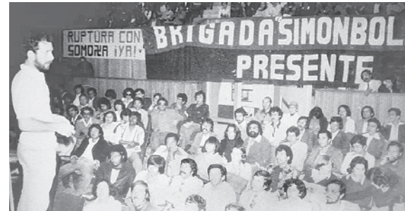
La Brigada Simón Bolívar en Nicaragua.