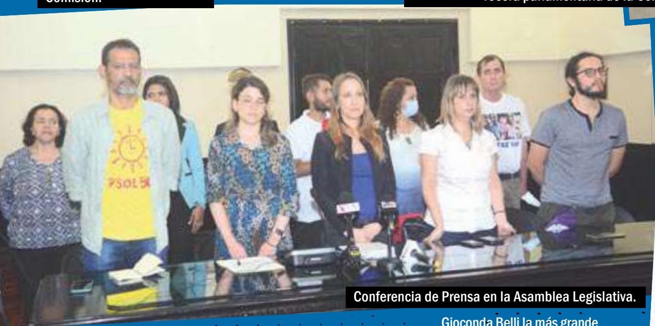
Conferencia de Prensa en la Asamblea Legislativa.