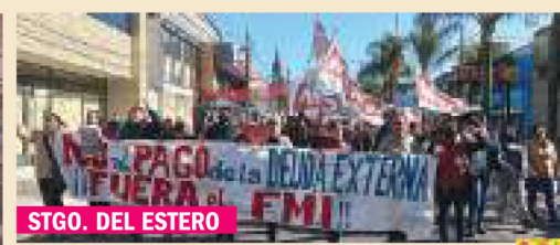
STGO. DEL ESTERO