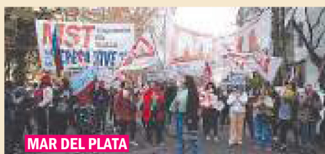
MAR DEL PLATA