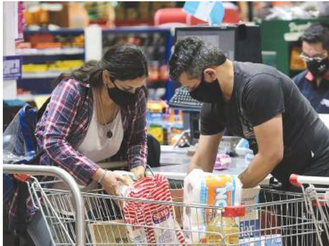
La inflación, drama cotidiano.

Así no va más. Hay que tomar medidas de emergencia: congelar ya