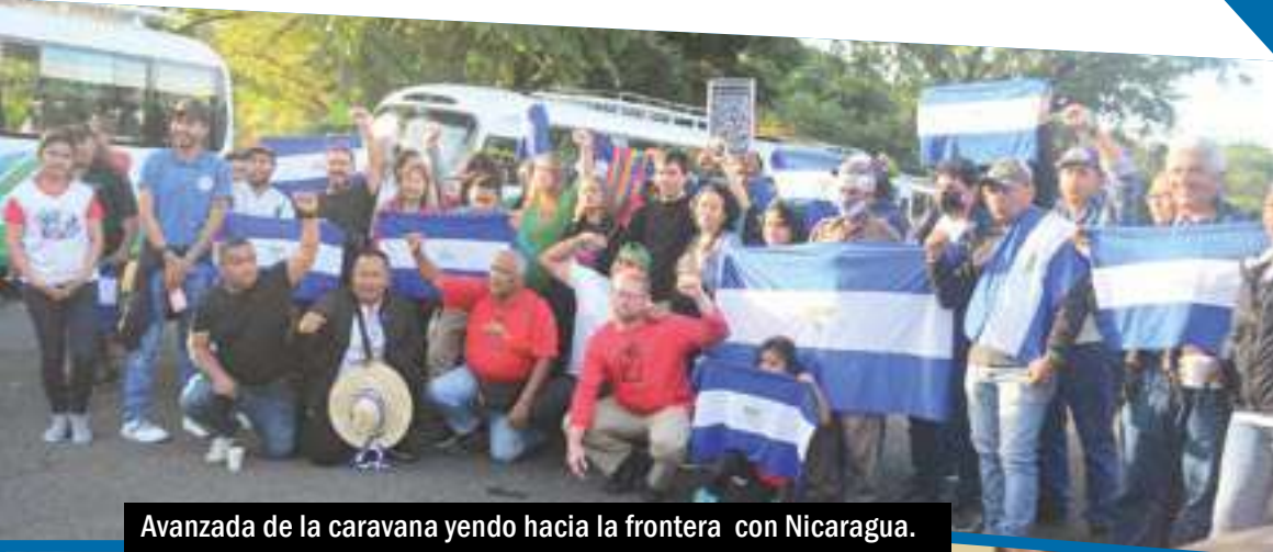
Avanzada de la caravana yendo hacia la frontera con Nicaragua.

Las repercusiones en la prensa local, regional e internacional fueron enormes. La Comisión Internacional y la Liga Internacional Socialista fueron parte de la agenda regional durante días. Todavía hoy continúan las derivaciones en Costa Rica y en el exilio nicaragüense. En Nicaragua hay una dictadura sangrienta que comete crímenes y persigue por razones políticas para preservar el poder y hacer negocios familiares. No podemos ser indiferente Nicaragua. El mundo tiene que saber lo que está sucediendo allí. La izquierda mundial tiene que hacer de esta causa, bandera de movilización y compromiso.