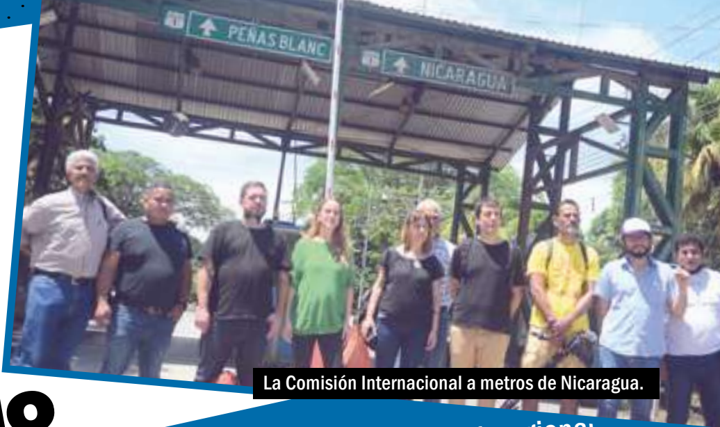
La Comisión Internacional a metros de Nicaragua.

Las repercusiones en la prensa local, regional e internacional fueron enormes. La Comisión Internacional y la Liga Internacional Socialista fueron parte de la agenda regional durante días. Todavía hoy continúan las derivaciones en Costa Rica y en el exilio nicaragüense. En Nicaragua hay una dictadura sangrienta que comete crímenes y persigue por razones políticas para preservar el poder y hacer negocios familiares. No podemos ser indiferente Nicaragua. El mundo tiene que saber lo que está sucediendo allí. La izquierda mundial tiene que hacer de esta causa, bandera de movilización y compromiso.