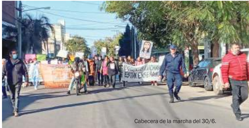
Cabecera de la marcha del 30/6.

Más allá de eso y combinado con que tampoco fue definido en asamblea,