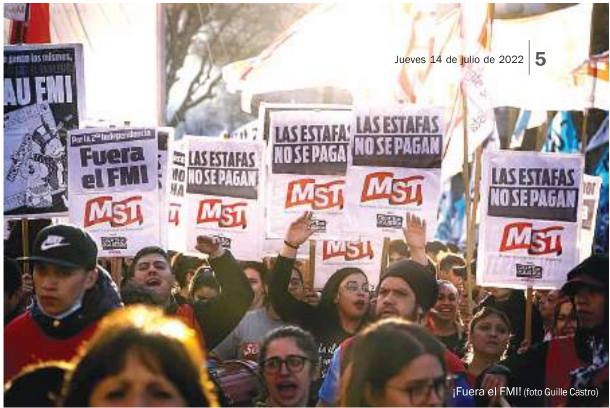
¡Fuera el FMI!

Lo mismo ocurre con el sistema bancario. La única forma de controlar el crédito y evitar la fuga de capitales al exterior, la evasión fiscal, el lavado de dinero y otras operaciones fraudulentas habituales de los capitalistas es nacionalizando el conjunto de la banca.