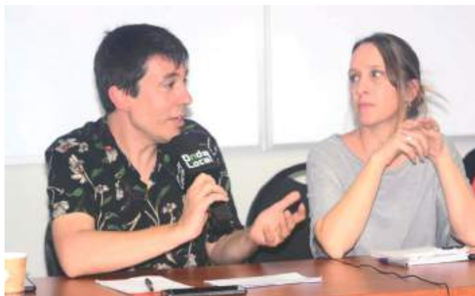
Conferencia de Prensa posterior a la Caravana a la Frontera

ambiguamente a favor de la lucha por la libertad de los presos políticos, para que pasen de las palabras a los hechos enérgicos. Petro, por ejemplo, en Colombia, que dijo que “aspiraba a una América sin presos por razones políticas”. Pero lo mismo cabe para otros gobiernos de la región.