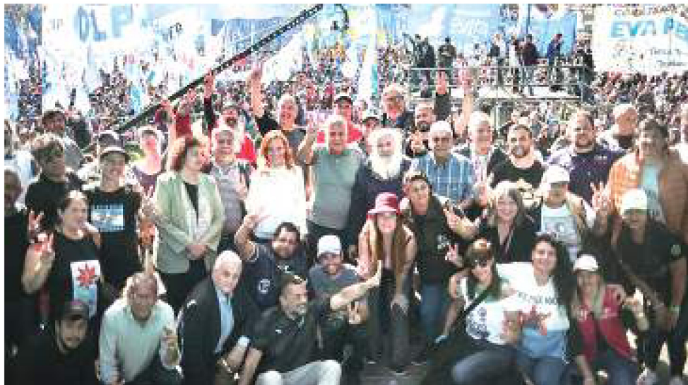
Los movimientos oficialistas y papales en La Matanza.