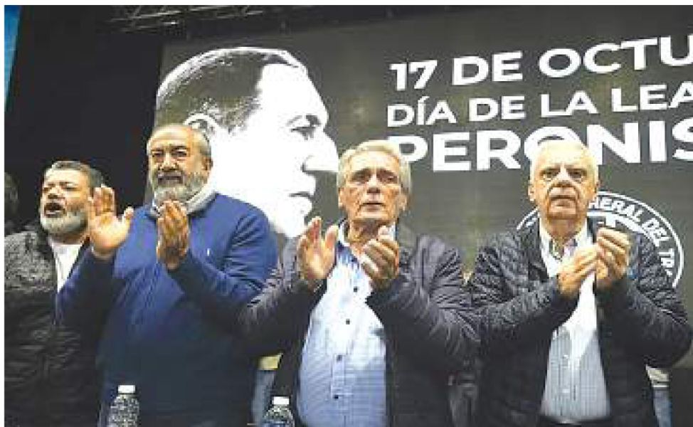
Los Gordos reclamaron lugares en las listas.