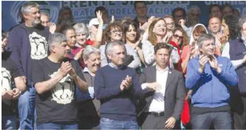
Modesto acto en Plaza de Mayo del PJ bonaerense, La C mpora y el sindicalismo K.