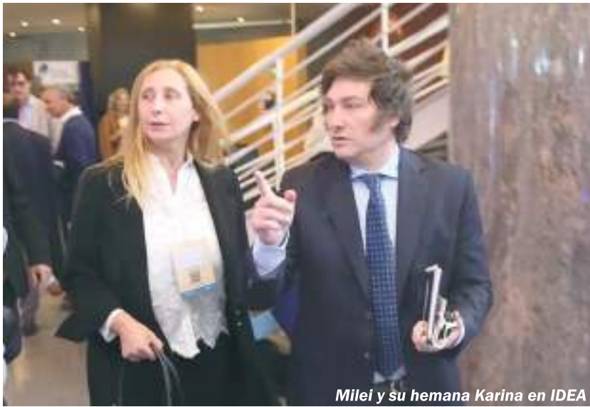
Milei y su hermana Karina en IDEA