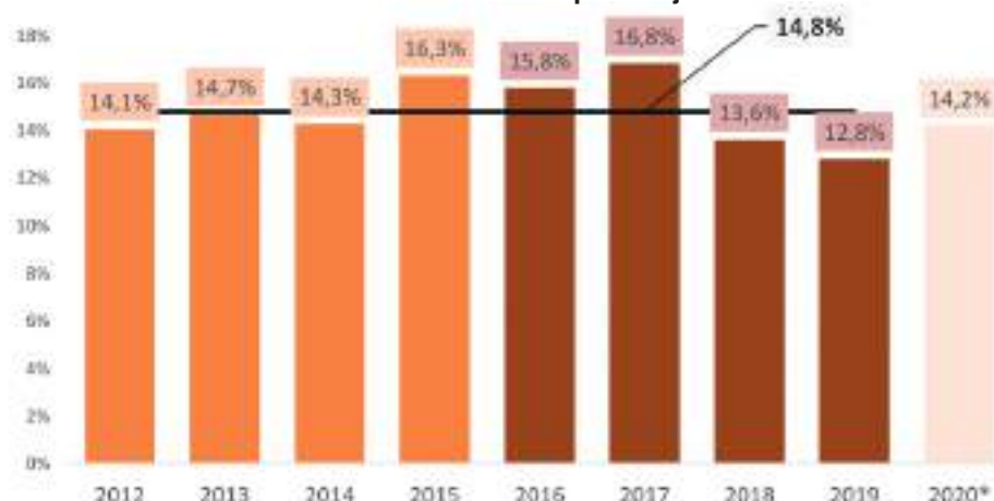
Costo laboral con relación al Valor Bruto de Producción de las primeras 500 empresas. Período 2012-2020. En porcentaje

Pese a que dieron números contundentes al decir que hace 11 años no crece el empleo privado y sí, en cambio, hay un incremento exponencial los índices de pobreza, ninguno se hace cargo. Todo sería culpa del Estado y la política, siendo temas vedados la alta evasión impositiva y la sostenida fuga de divisas. Massa la llegó a plantear, cuando cuestionó que un porcentaje de argentinos tengan 86.000 millones de dólares en guaridas fiscales en los EEUU.