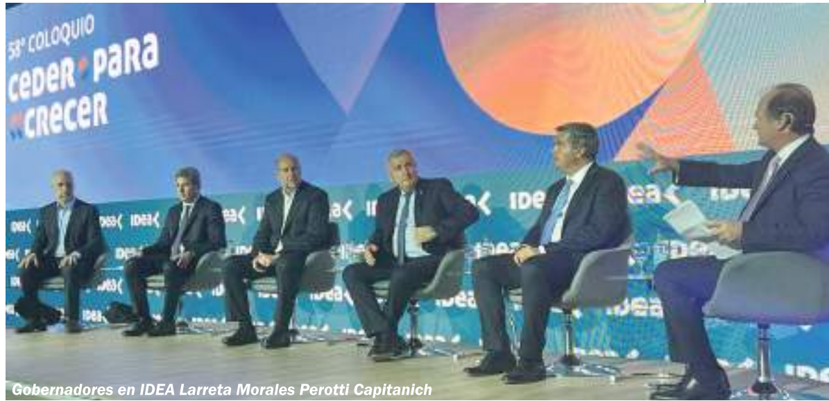
Gobernadores en IDEA Larreta Morales Perotti Capitanich

Por definición incluso de la Real Academia, una empresa es una organización dedicada a actividades industriales, mercantiles o de prestación de servicios con afán de lucro. Por lo tanto, la actividad empresarial son las acciones de una compañía para obtener ganancias. Por eso y para asegurar esa finalidad lucrativa, este empresariado es responsable de no generar empleo privado genuino, de avanzar en modalidades de mayor precariedad laboral, trabajo informal, contratos basura, pasantías y becarios jóvenes híper explotados.