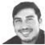
Leo Rando Junta Interna ATE Cultura - Alternativa Estatal/ANCLA

La nueva ministra menemista de trabajo Kelly Olmos abrió el debate planteando que «con alta inflación es muy difícil empardar los salarios». Si no se toma ninguna medida de fondo, si lo que conviene es mantener los sueldos bajos para abaratar costos y explotar más a los trabajadores, si la burocracia sindical actúa de manera cómplice... desde esa perspectiva sí que es difícil. Pero hay otro camino (que muestra otros resultados) el de la organización y la lucha.