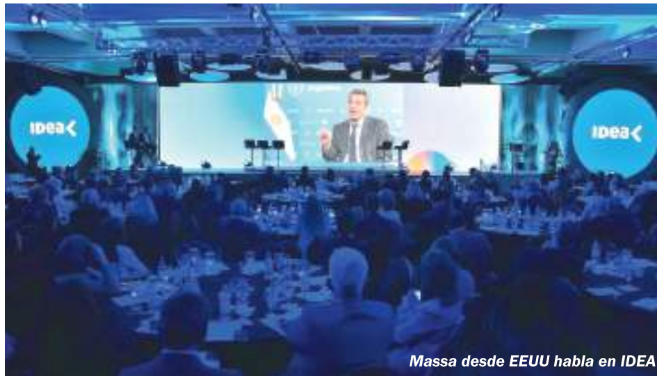
Massa desde EEUU habla en IDEA

Por eso los balances de las principales empresas alimenticias reflejan subas en las ganancias en comparación con el año anterior. Arcor pasó de $ 14.438 millones a 19.935 millones. Molinos Río de la Plata, de 1637 millones a 5.195 millones. Ledesma ganó $ 5.712 millones y Molinos Semino ganó 69 millones (Página 12, 8/10).