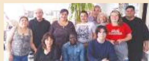
Con compañeros de la zona Norte del Gran Buenos Aires.