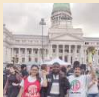
En la jornada frente al Congreso por los fondos de fomento a la cultura.