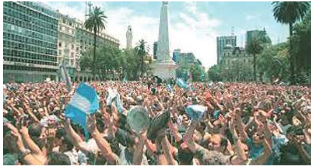
El Argentinazo, diciembre 2001.

Su discurso progre y nacionalista duró muy poco. Pronto dio paso a una política que continuó en lo esencial en