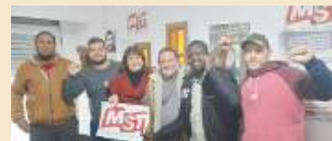
Con compañeros de la zona Sur del Gran Buenos Aires.