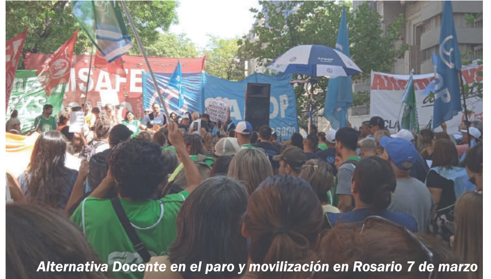
Alternativa Docente en el paro y movilización en Rosario 7 de marzo

Porque vemos que un importante sector se siente defraudado al haber votado a Alberto y Cristina para sacarse de encima