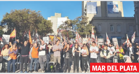
MAR DEL PLATA