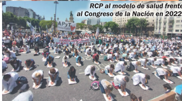
RCP al modelo de salud frente al Congreso de la Nación en 2022.

Norma: El ataque de la agrupación Marrón del PTS fue muy duro e irresponsable, en medio de las elecciones y de un conflicto del turno franquero que apoyamos desde la APyT con responsabilidad de orientación en el mismo. Fue con fundamentos falsos ya que jamás pactamos con ningún gobierno y nos pasamos denunciando a la burocracia sindical. En el fondo el ataque responde a diferencias en la concepción del modelo sindical que para nosotros tiene que ser plural sin discriminar a quienes piensan distinto o vienen de distintas corrientes políticas. Evidentemente este grupo, sin responsabilidad al frente de un sindicato como el nuestro, actúa alegremente con provocaciones hacia una organización sindical reconocidamente antiburocrática y de lucha. Su accionar es claramente nocivo para las y los trabajadores. Soy orgullosamente militante del MST en el FIT Unidad y defensora de la pluralidad y libertad de pensamiento de Otra Voz y de nuestra querida APyT como conquista de las y los trabajadores del Equipo de Salud. Fue importante que la agrupación de conjunto,