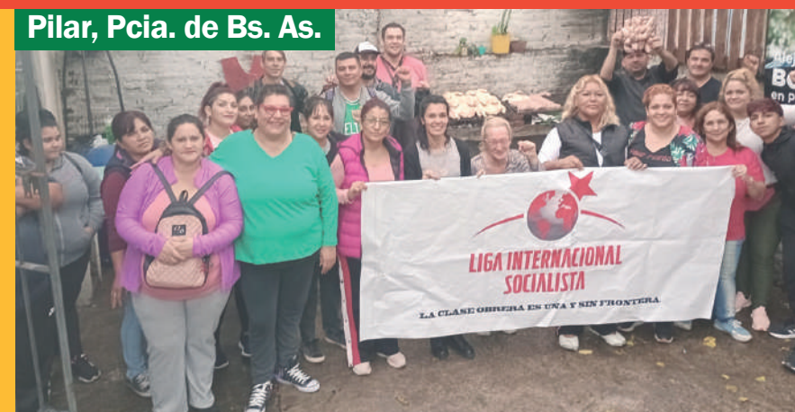
Pilar, Pcia. de Bs. As.