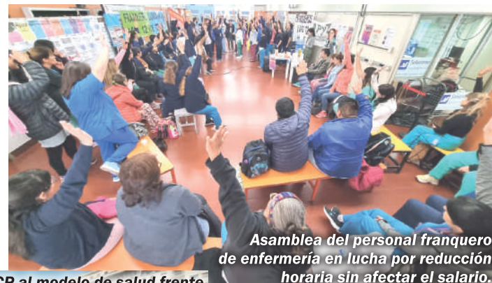
Asamblea del personal franquero de enfermería en lucha por reducción horaria sin afectar el salario.

Luchamos por un Convenio Colectivo de Trabajo que amplíe derechos y presentamos el proyecto por el 82% de haber jubilatorio para las y los trabajadores del Garrahan. El desafío es fortalecer nuestra herramienta sindical y a Otra Voz como alternativa a las corrientes hegemónicas ligadas al poder y a la burocracia sindical. La APyT es plural, democrática, independiente de los gobiernos, antiburocrática y combativa. Consultamos todo con la base y estamos siempre.