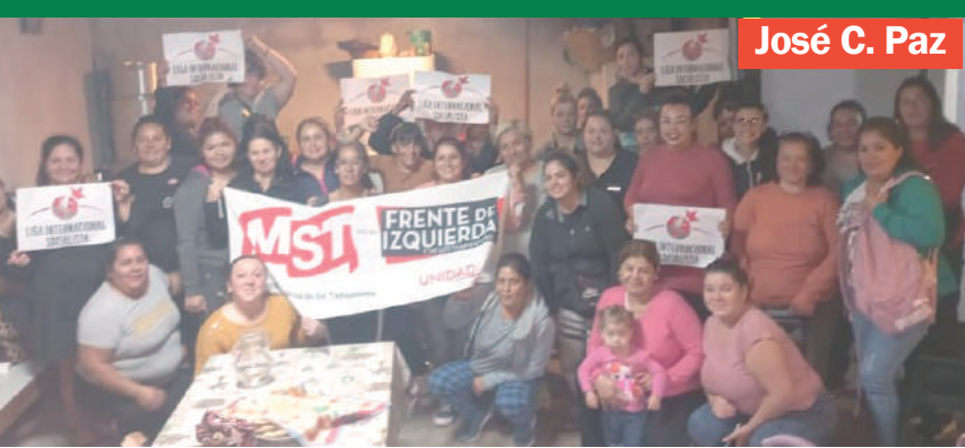
José C. Paz