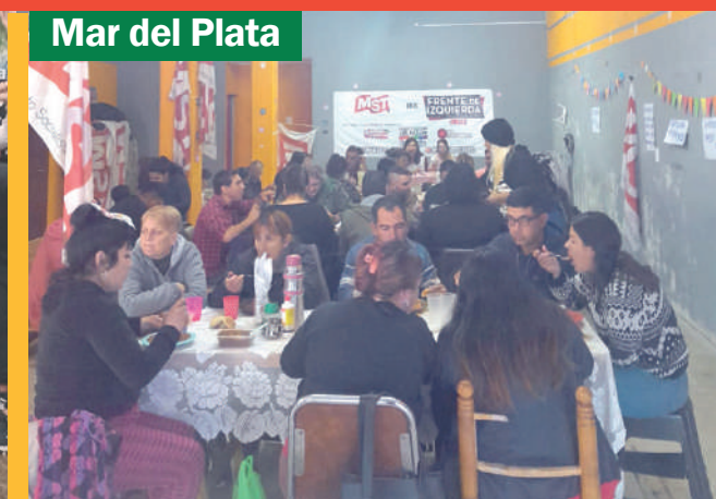
Mar del Plata