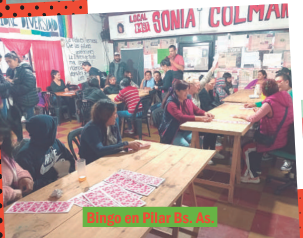
Bingo en Pilar Bs. As.