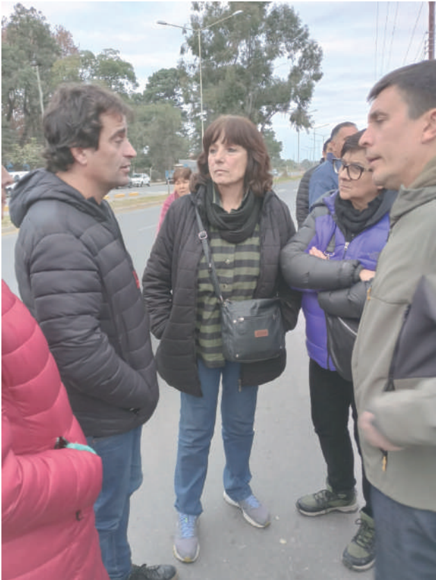
Solano y Ripoll en el Penal de Alto Comedero exigiendo la libertad de decenas de detenidos.

Frente de Izquierda y de Trabajadores Unidad Lista "Unidad de luchadores y la Izquierda" (Partido Obrero y MST)