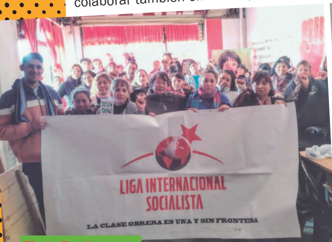
Tigre, Bs. As.