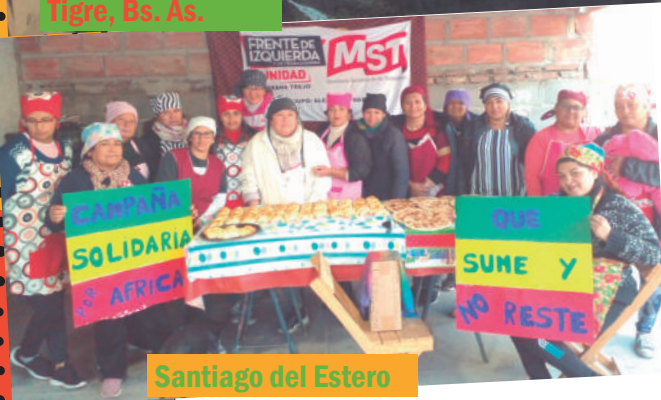
Santiago del Estero