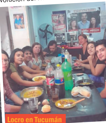
Locro en Tucumán