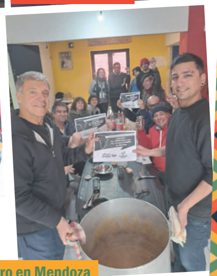
Locro en Mendoza