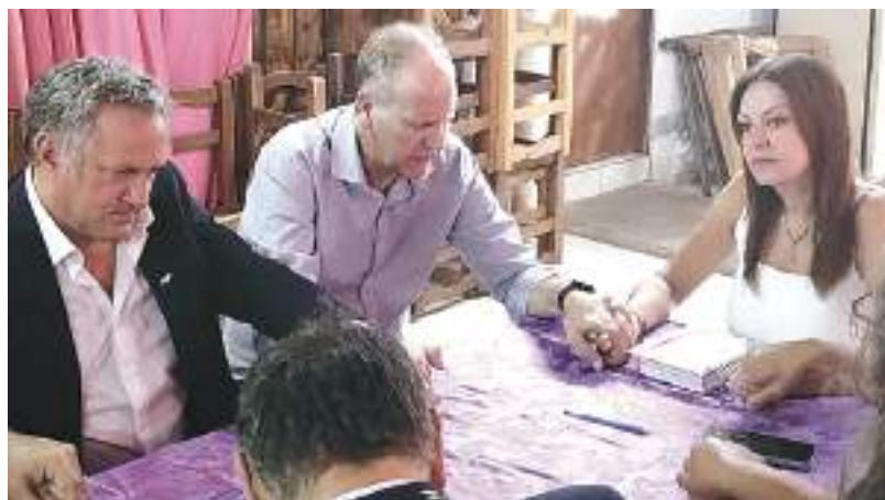
Pettovello con líderes evangélicos.

comedores y trabajo genuino para todas y todos. Vamos por un plan de obras públicas y la reducción de la jornada laboral con reparto de las horas de trabajo, para generar esos puestos de trabajo que tanto necesitamos.